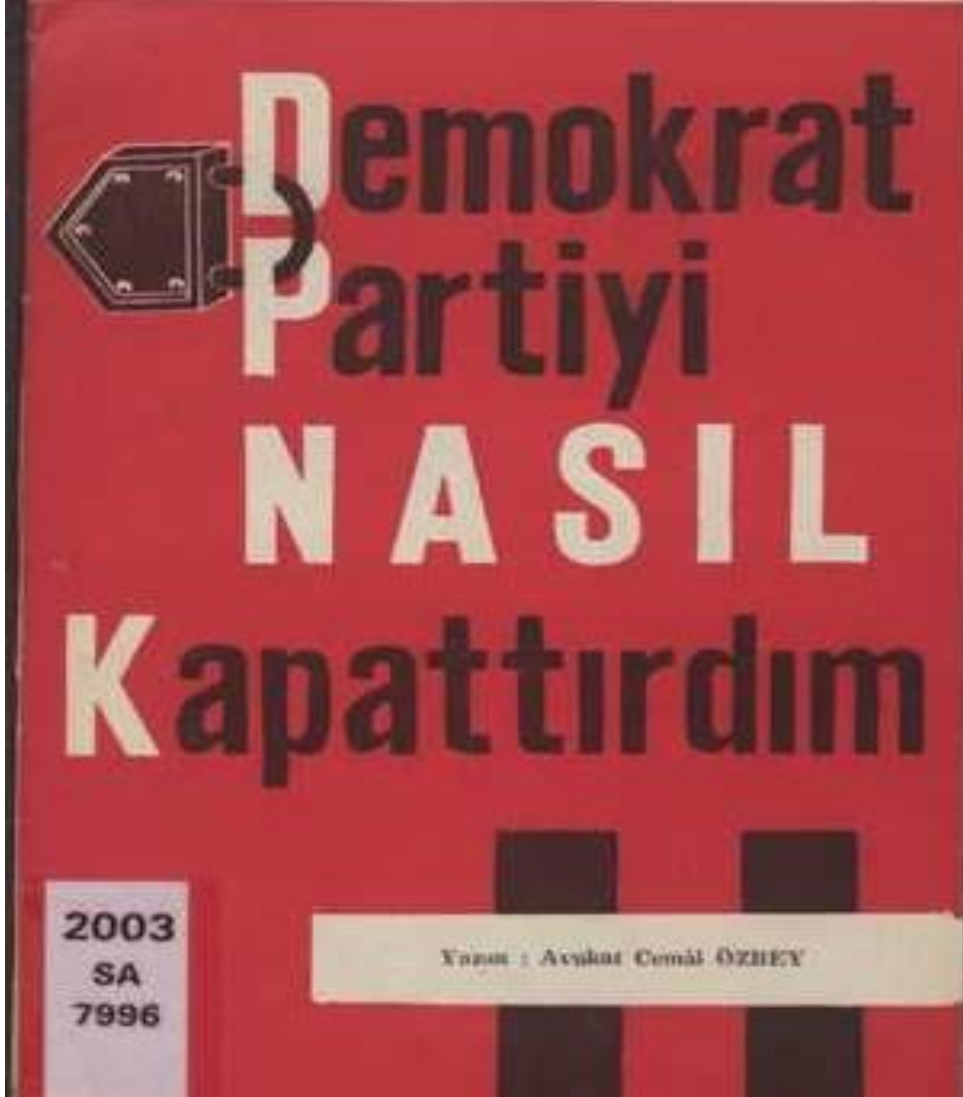
Ek 4: ÖZBEY, C. (1961). Demokrat Parti'yi Nasıl Kapattırdım . Ankara: Emek Basım.