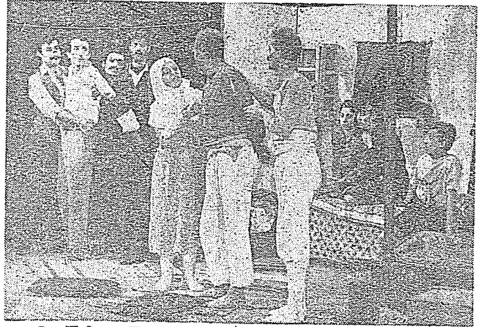
© Yalova Kaymakamı'nın bir bölümünde san'atçılar toplu halde..