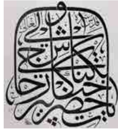
Görsel 4 Yazı ile Hacı Bektaş Veli tacı. Bektaşî tacı şeklinde istiflenmiş olan Ya Hazreti Pir Hacı Bektaş Veli yazılı hat levhanın fotoğrafı.