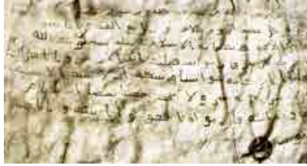
Görsel 1 Hz.Peygamber’inHerakleios'a gönderdiği mektup. https://islamansiklopedisi.org.tr/herakleios

Bağdatlı hattat İbn Mukte, elif harfini ve daireyi ölçü olarak kabul edip, aklam-ı sitteyi belli kurallara bağladı. İbnü’l Bevvab yazıyı estetik açıdan daha ileriye taşımıştır. Son Abbasi halifesi Mustasım’ın saray hattatı Yakut-ı Mustasım harflere ayrı bir güzellik getirmiştir. İranlı ve Türk hat-