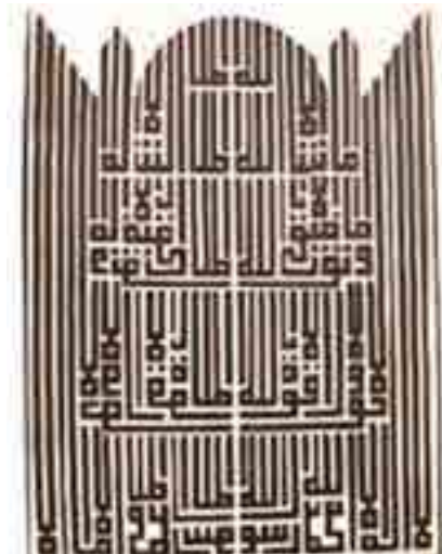
Görsel 3 Yazılarla yapılmış cami silüeti (Malik Aksel Koleksiyonu) (Aksel, 2015, s. 15).

Görsel 3’teki metin, Kelime-i Tevhid’dir. Camide karşılıklı olarak “ Maşaallah ” “ Vematevfiki illâ billah ”(Hud 11/88) ayeti yazmaktadır. “Başarmam Allah’ın yardımına bağlıdır” anlamına gelmektedir. 6 Altındaki satırda hadislerde “ La Havle Vela Kuvvete İllâ Billah ”, (Buhari, Ezan, 7; Müslim, Salat, 12),Kur’an-ı Kerim’de ise: “ La Kuvvete İllâ Billâh ” (el-Kehf,18/39) şeklinde geçen “Her türlü değişim ve gücün kaynağı sadece Allah’tır” anlamına gelen sözler yer almaktadır(Koçkuzu, 1997, s. 536). En altta ise “ Kelime-i Tevhid ” bulunur. Eserde yazı ile oluşturulan düzen dikkati çekmektedir. “ Kelime-i Tevhid ” dahil bütün hatlar düz ve köşelidir; sadece kubbe yuvarlak formdadır. Eserin övülmesinin günah olduğunu düşüncesi ile yapan kişinin ismi bulunmamaktadır.