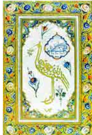
Görsel 5 İsmail Zühdü’nün leylak şeklindeki besmelesi. https://islamansiklopedisi.org.tr/ismail-zuhdu-yeni

Görsel 5’teki eser İsmail Zühdü Efendi’nin leylak biçimindeki besmele yazısıdır, yaşadığı dönem için ileri bir denemedir. “Ancak bu eseri zerendud tarzında işleyen müzehhip 1213 (1798) yerine dalgınlıkla 1013 (1604) tarihini esere koymuştur.” (Derman, 2001, s. 126)