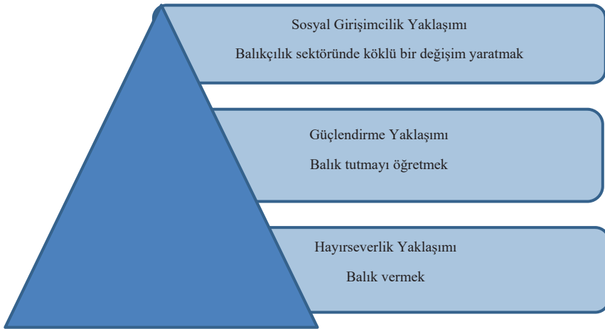
Şekil 2. Sosyal Girişimcilik Yaklaşımı

Denizalp (2009) yukarıda dikkat edilecek noktalardan ve sosyal girişimcide bulunması gereken beceri ve yeterliliklerden yola çıkarak sosyal girişimcilik mantığını daha iyi anlamaya yardımcı olmak için Şekil 2'de gösterildiği gibi bir yaklaşımı ortaya koymuştur.