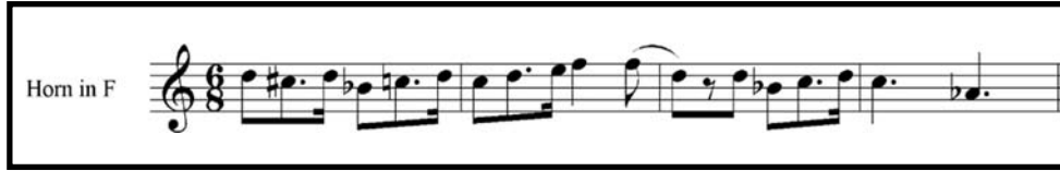
Örnek 3: Op. 88 Fantasy for Horn A Teması İçin Ritmik Çalışma Örnekleri

Malcolm Arnold, Op. 88 Fantasy for Horn eserinde büyük bir etki yaratmak amacıyla nüansları ve artikülasyonları etkili bir şekilde kullanmıştır. Nüans ve artikülasyon değişikliklerine sıkça yer veren Arnold, piano, forte nüanslarını ve staccato, legato artikülasyonlarını kullanarak kontrast yaratmıştır.