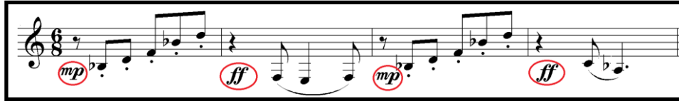
Örnek 4: Op. 88 Fantasy for Horn 17-20. Ölçüler Arasındaki Nüans ve Artikülasyon Değişiklikleri.

Malcolm Arnold, Op. 88 Fantasy for Horn eserinde büyük bir etki yaratmak amacıyla nüansları ve artikülasyonları etkili bir şekilde kullanmıştır. Nüans ve artikülasyon değişikliklerine sıkça yer veren Arnold, piano, forte nüanslarını ve staccato, legato artikülasyonlarını kullanarak kontrast yaratmıştır.