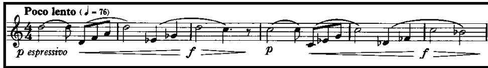
Örnek 5: Op. 88 Fantasy for Horn B Teması 50-56. Ölçüler Arası

A kesiti 50. ölçüde yerini, 4/4'lük Poco Lento temposunda olan B bölümüne bırakır. Bu kesit, A kesitinin şakacı, esprili anlatımının aksine, legato cümlelerden oluşan daha lirik ve daha karamsar bir temadan oluşmaktadır. Aynı zamanda besteci, bu kesitte çeşitli nüanslara yer vermiştir. Nüansları oluştururken entonasyon sıkıntılarının ortaya çıkması korno icracılarını zorlayan noktalardan biridir. Hangi nüans olursa olsun, entonasyon sıkıntısını ortadan kaldırmak için dudak hakimiyetinin sağlanması gerekmektedir.