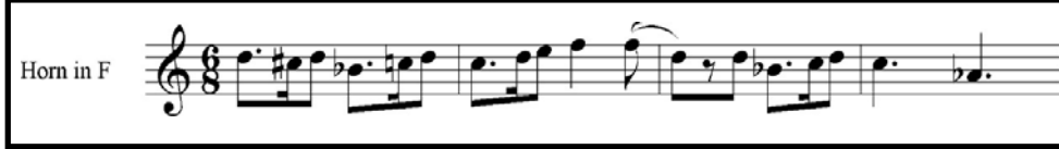
Örnek 2: Op. 88 Fantasy for Horn A Teması İçin Ritmik Çalışma Örnekleri