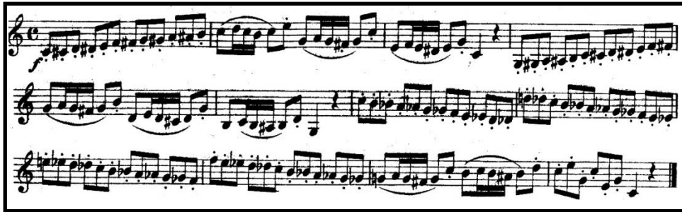
Örnek 10: Kling Etüd Kitabı No. 7 19

Aşağıdaki etüd çalışması bu eserin icrasında yardımcı olabilecek artikülasyon çalışmaları içermektedir. Artikülasyon, bağ ve dil tekniği olarak incelenebilir. Dil ( staccato ) ve bağ ( legato ) tekniklerini içeren bu etüde dikkat edilmesi gereken en önemli noktalardan biri staccato notaların olabildiğince kısa ve temiz bir şekilde icra edilmesidir. Etüdün tamamına Henri Kling 40 Studies kitabından ulaşılabilir.