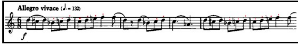
Örnek 1: Op. 88 Fantasy for Horn A Teması

6/8'lik ölçüde Allegro Vivace temposundaki esprili ve şakacı ana tema (A), av temalarını andırır. Eserin A teması, sürekli tekrar eden ritim kalıplarından oluşmuştur ve çeviklik gerektirmektedir.