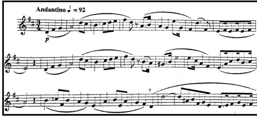
Örnek 6: Cantilena Etüd Kitabı, No:11 17

B kesitinin icrasında bağların kesintisiz ve pürüzsüz olmasına dikkat edilmelidir. Bağlı pasajlarda, özellikle piano nüansında ağızlık baskısının en aza indirilmesi gerekmektedir. Dudakları çok sıkmadan, orantılı ve kesintisiz hava göndermek, bu pasajın icrasını kolaylaştırmada etkili olacak yöntemlerdendir. Aşağıdaki etüd çalışması, piano nüansında çalınacak legato tekniğini geliştirmede etkili olabilecek bir örnektir. Etüdün tamamına Panseron 20 Cantilena kitabından ulaşılabilir.