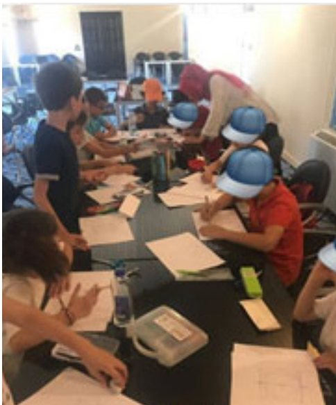
Figür 2. İstanbul Arkeoloji Müzeleri