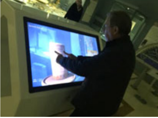
Figür 6. Ankara Etnoğrafya Müzesi İnteraktif Ekran