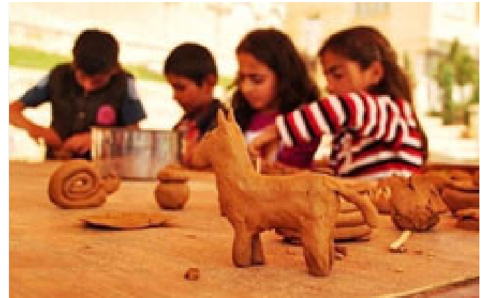
Figür 4. İstanbul Arkeoloji Müzeleri

Ankara Etnografya Müzesi’nde öğrenciler, seramik sergilerini gözlemledikten sonra, interaktif ekranlarda kendi müdahaleleri sonucunda seramik hamuru hazırlayarak, istedikleri formda seramik gereçler üretebilmektedirler. Daha sonra dijital ekranlarda kendi ürettikleri seramik kapların dış yüzeylerini süsleyerek fırına göndermektedirler. Fırından çıkan seramik kaplar öğrencilerin kendi deneyimlemeleri sonucu meydana getirildiği için edindikleri bu bilgiler kolay kolay unutamayacakları bir an olarak saklanacaktır. (Figür 5-6-7-8) Yine Ankara Anadolu Medeniyetleri Müzesi’nde de seramik sergilerini dolaşarak