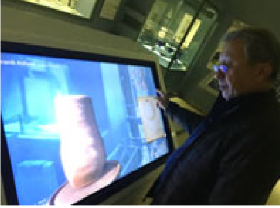
Figür 7. Ankara Etnoğrafya Müzesi İnteraktif Ekran