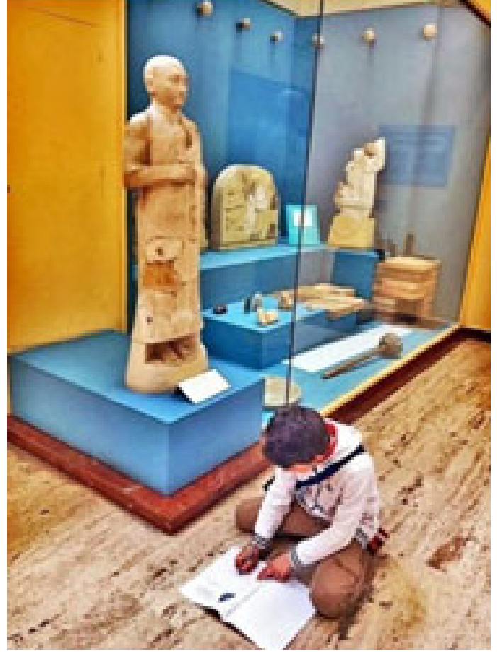
Figür 3. İstanbul Arkeoloji Müzeleri