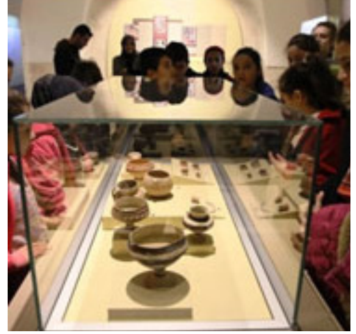
Figür 10. Mardin Müzesi