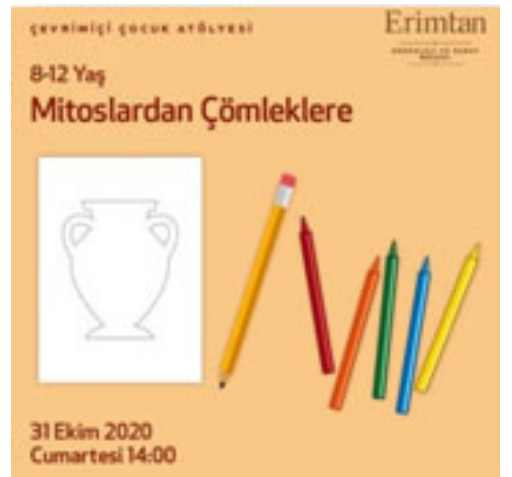
Figür 12. Erimtan Müzesi