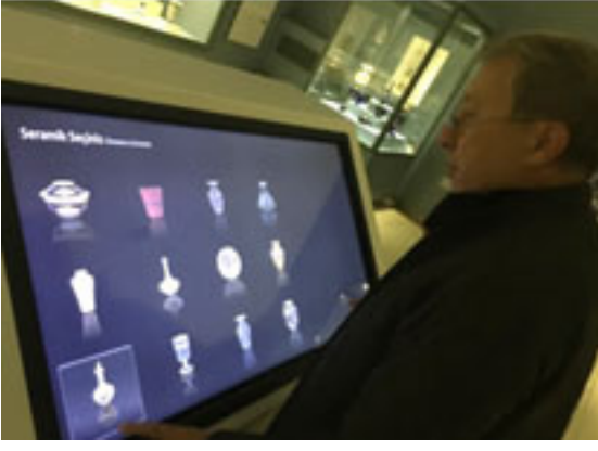
Figür 5. Ankara Etnoğrafya Müzesi İnteraktif Ekran