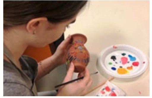
Figür 11. Erimtan Müzesi