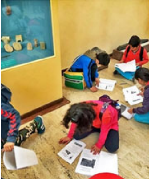
Figür 1. İstanbul Arkeoloji Müzeleri

Bu örneklere ek olarak; İstanbul Arkeoloji Müzelerinde gerçekleştirilen ilköğretim 5 ve 6. sınıf resim derslerinde “çizgi, doku ve çizgilerle grafiksel çalışmalar” konularında Türk mitolojisinin figür ve motiflerinden yararlanılabilmektedir. ( Figür 1- 2) Ayrıca 7. ve 8. sınıf “doku çalışmaları, iki boyutlu çalışmalar, üç boyutlu çalışmalar, (Figür 3-4) sanat eserlerinin korunmasının önemi gibi” konularda Selçuklu motiflerinden azami derecede faydalanabilmektedirler. Bu düşünce, Milli Eğitim Bakanlığı’nın İlköğretim Kurumları Resim-İş Dersi Öğretim Programı “Genel Amaçlar” 7 ve 8. sınıf amaçlarıyla da örtüşmektedir (Göncü, 2005:101).