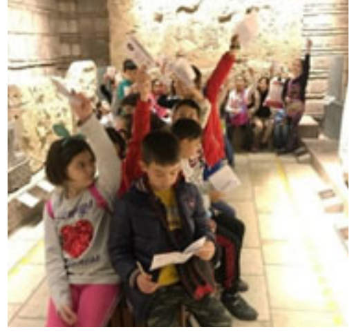
Figür 9. Ankara Anadolu Medeniyetleri Müzesi