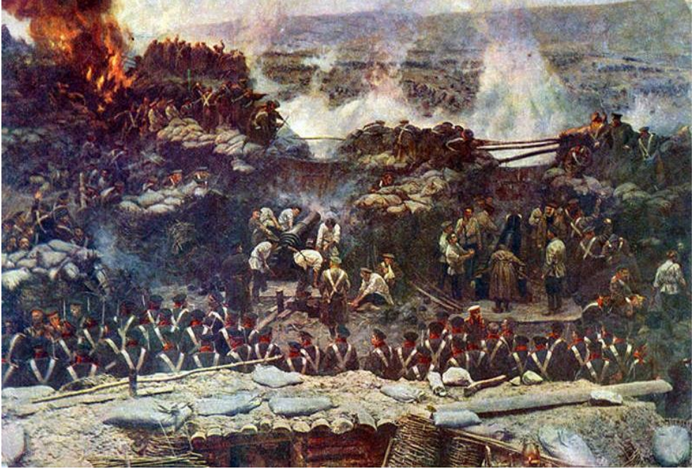
Resim-1 Sivastopol Kuşatması ( http://wikipedia.org/wiki/ Kırım Savaşı )