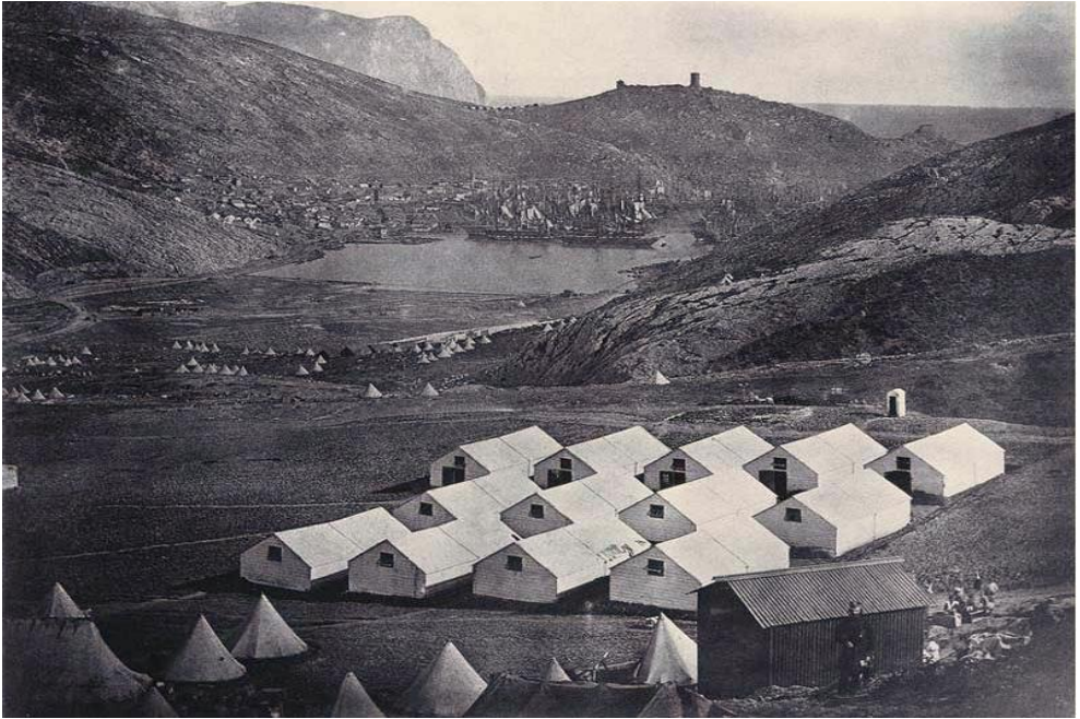
Resim-2 Balaklava'nın Görünüşü 1853-1856