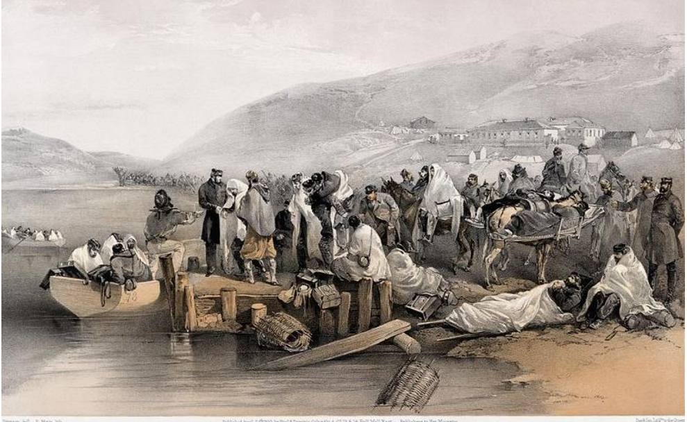
EMBARCATION OF THE SICK AT BALAKLAVA.

Resim-3 Balaklava Limanı'ndan tekneye bindirilen hastalar ( http://wikipedia.org/wiki/ Kırım Savaşı )