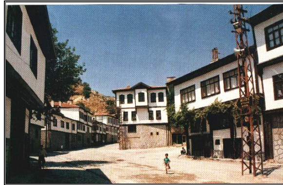
Şekil 3. Tarihi konutlar (Anonim 2001b) Figure 3. Historical buildings (Anonymous 2001b).