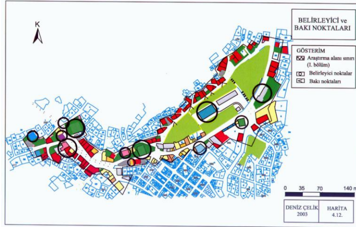
Şekil 2. Araştırma alanındaki belirleyici noktalar (Anonim, 2001a’den geliştirilmiştir). Figure 2. Marking points in the research area (Developed from the anonymous 2001).

Tarihi Yapılar: Tarihi doku içinde yer alan ahşap konutlar, XIX. yüzyılın özelliklerini taşımaktadır. Konutlar; genellikle üç katlı, temel duvarları taş, üst katlar ahşap, çatılar alaturka kiremitle kaplıdır (Şekil. 3) (Anonim, 2001b). Genellikle iç sofalıdır ve avluları bulunmaktadır. Dükkânlar ise, bir ya da iki katlıdır. Üst katlar genellikle depo olarak kullanılmaktadır. Günümüzde 150 yıllık tarihi olan bu çarşıda; yöresel zanaatlardan bakırcılık, gümüş işlemeciliği, deri imalatları, ayakkabıcılık, semercilik ve terzilik devam etmektedir.