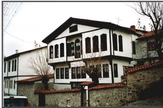
Şekil 4. Yenice Sokaktaki Türkoğlu Konağı (Orijinal, 2003). Figure 4. Turkoglu House in Yenice Street (Original, 2003).

SWOT Analizi: Bu analiz ile araştırma alanındaki fiziki ve sosyo-kültürel durum saptanıp, tarihi çevre koruma ve yenileme işlemleri sırasında güçlü yönler ve fırsatların nasıl değerlendirileceği, zayıf yönlerin güçlü yönler durumuna nasıl çevrileceği ve kısıtlamaların ortadan kaldırılması için nelerin yapılabileceği araştırılmıştır.