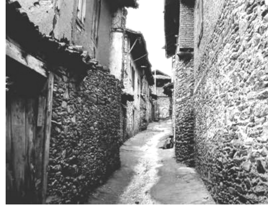
Şekil 7. Osmanlı Dönemi Sokak Dokusu – Cumalıkızık (Anonim, 2005e).

Dolaşım ağının bir parçası olan ve batıdaki örneklerinden farklı olan Osmanlı kenti meydanları da temelde iki farklı şekilde biçimlenmiştir: