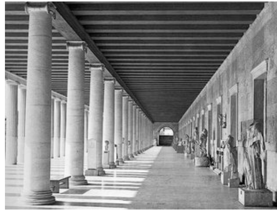
Şekil 6. Attalos Stoası (Anonim, 2005b).

Özellikle agoralarda çeşitli amaçlarla kullanılan, bu bir tarafı duvarla kaplı diğer tarafı sütunlu yapılar Yunan ve Roma şehirciliğinin önemli öğeleri olmuştur.