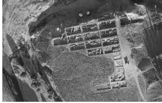
Şekil 2. Aşıklı Höyük -Aksaray (Anonim, 2005a).

Konya Ovasının en verimli yerine kurulmuş olan Çatalhöyük, tüm Ön Asya Bölgesi'nde bugüne kadar rastlanılan en eski ve en büyük Neolitik yerleşim merkezidir.