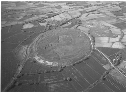
Şekil 3. Kültepe - Kanis (Ünal, 2003).

Tunç Çağı'nda genel olarak sokak-avlu-yapı ilişkisi sağlanmış, Geçiş Dönemi olarak değerlendirilen yıllarda açık alan sistemine ana ve tali yol sisteminin yanı sıra meydanlar da katılmış, avlular yapısal öğeler ve mekansal geçişler ile zenginleştirilmeye çalışılmıştır (Erdoğan, 1996).