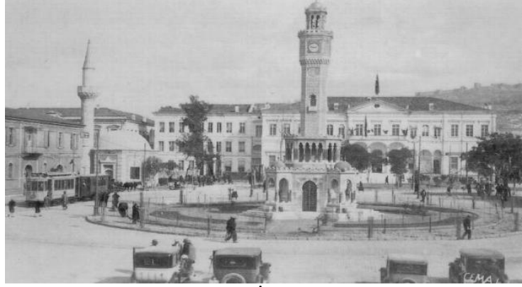
Şekil 8. Konak Meydanı- İzmir (Anonim, 2005f).

gözlenmiş, aynı devirde Avrupa'yı etkisi altına alan Rönesans ve Barok üslubunun formal düşüncelerinin aksine, serbest/informal bir düşünce hakim olmuştur. Bu devrin en karakteristik eserleri Topkapı Saray bahçeleri ve Üsküdar Saray larının bahçeleri olarak karşımıza çıkmıştır (Tanrıverdi, 1987).