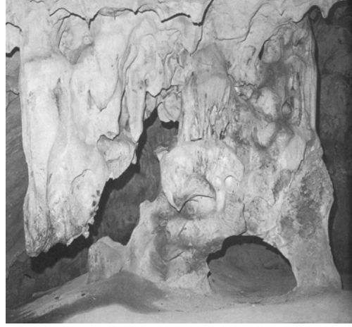
Şekil 1. Karain Mağarası-Antalya (Keskin, -).

Bu dönemin en planlı gelişen yerleşimlerinden bir olan Aşıklı Höyük'te evler gruplar halinde tek, iki veya üç gözlü olarak inşa edilmiş aralarında sokaklara rastlanmıştır (Anonim, 2005a) (Şekil 2).