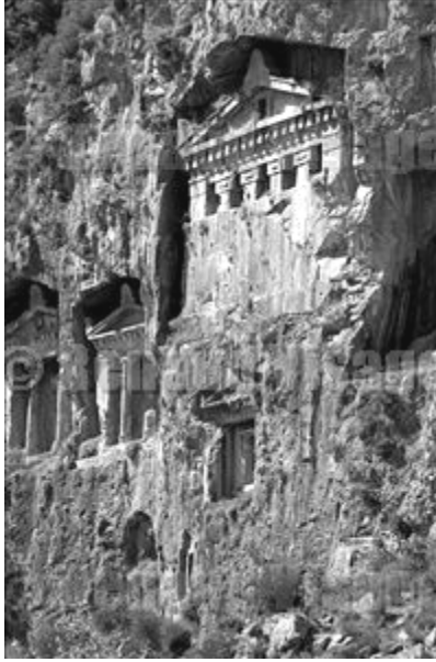
Şekil 4. Kaya Mezarları – Dalyan (Anonim, 2005c).

Hitit devletini yıktıktan sonra birleşik bir krallık kurmuş olan Friglerde (M.Ö. 750–300) mezar mimarisinde gelişme kaydedildiği, evlerin ise Hititlerinkine benzediği görülmüştür (Cezar, 1977).