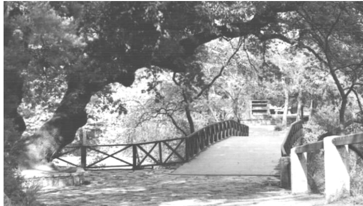
Şekil 9. Osmanlı Bahçesi (Anonim, 2005g).

Sonuç olarak sayısız uygarlığın yüz yıllar süren çabalarıyla oluşmuş ve zengin değerler içeren açık mekan olgusunun tarihsel sürecine bakıldığında, açık mekanların toplumların gelişmesine paralel olarak geliştiğini ve bu oranda çeşitli misyonlar üstlendiğini görmekteyiz. Dışa dönük yaşamın daha da hız kazandığı günümüzde artan nüfusa oranla her metrekaare açık mekan daha da değer kazanmış ve toplumsal yaşamdaki önemi artmıştır. Yine tarihsel süreçte Anadolu'daki açık mekanlara baktığımızda bu mekanların günümüze kadar ulaştığını ve geçmişin kültürel yapısıyla günümüz toplumlarını kaynaştırdığını ve bizleri kültürel anlamda bir adım daha öne götürecektir bilgiyi kazandırdığını görmekteyiz. Oysa ki günümüz açık mekanlarını değerlendirdiğimizde teknolojiyi temel alan büyük çaplı gelişmelere karşın, bu mekanların çoğunlukla günöbirlik çözümler ürettiğini ve kültürel anlamda gelecek nesillere ip ucu verebilecek bir kimlik içermediğini gözlemlemekteyiz. Bu bağlamda açık mekan olgusunun tarihsel süreçteki şekillenışı günümüz plancıları ve tasarımcıları tarafından özümsemeli ve kültürel altyapıyı içeren bu bakış açısı çağdaş kent mekanlarına taşınmalıdır.