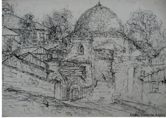
Görsel 6. Abduş Hüseyin, Türbe, Tarihsiz, Karakalem.