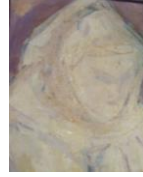
Görsel 2. Abduş Hüseyin, Üsküp Karadağ'ından bir Kadın Portresi, Tarihsiz, Sulu Boya.