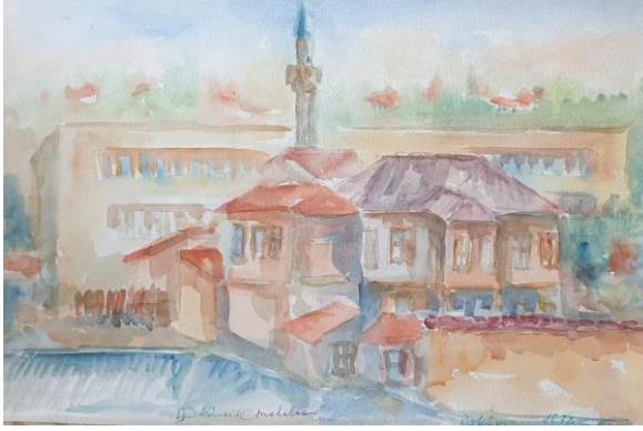
Görsel 11. Şerafettin Nebi, Dükkâncık Mahallesi, 1978, Sulu Boya