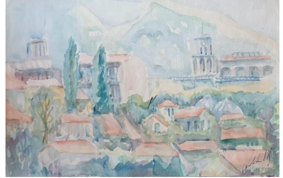
Görsel 10. Şerafettin Nebi, Üsküp, 1939, Sulu Boya