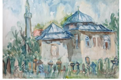
Görsel 8. Şerafettin Nebi, Alaca Camii, 1965, Sulu Boya