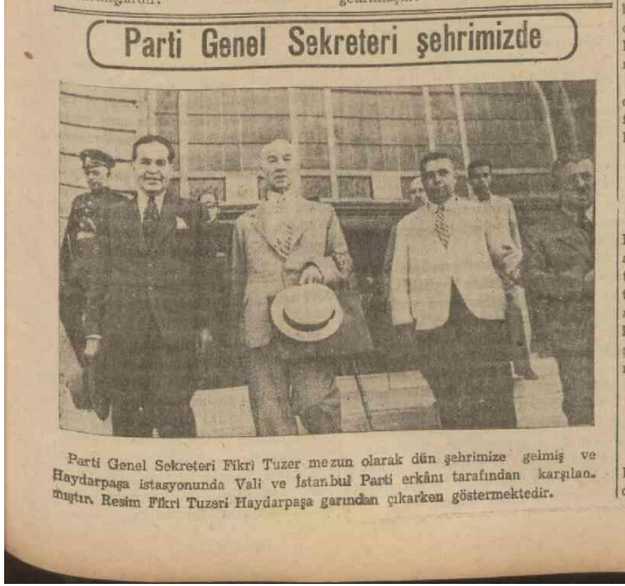
Ek 3: Son Posta, 11.07.1942.