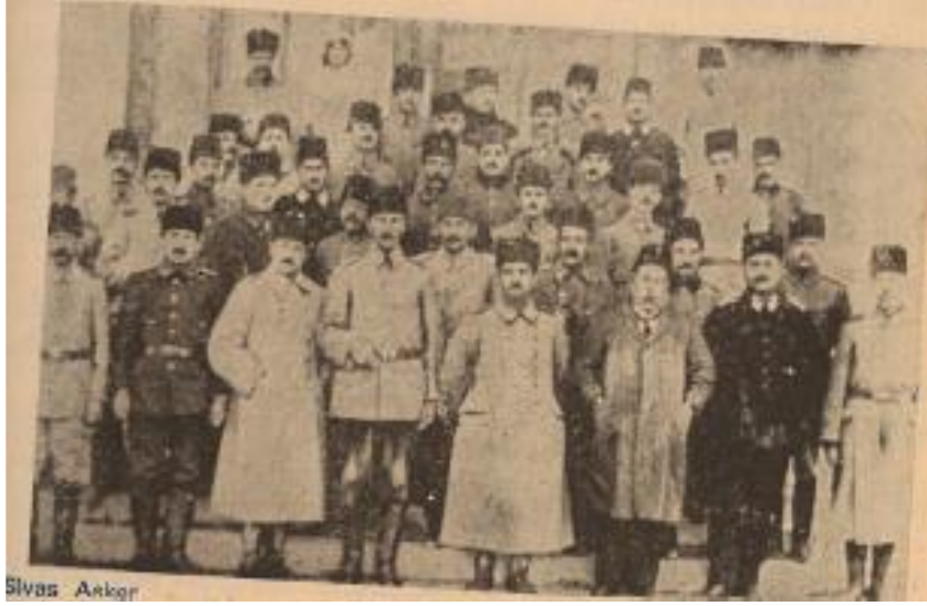
Ek 2: Vatan Gazetesi, 26.02.1942.