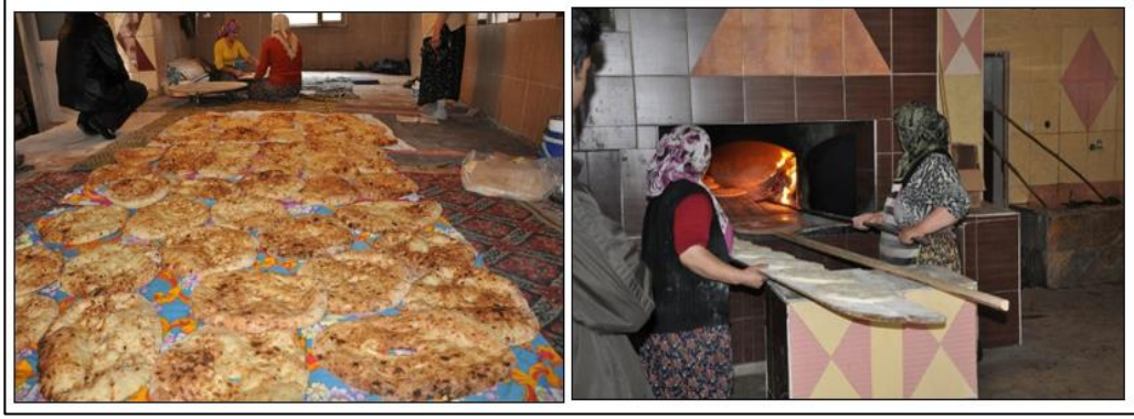
Şekil 4. Yeni inşa edilen mahalle fırınlarında örnekler (Yalvaç Belediyesi, Destek Hizmetleri Müdürlüğü, Kültür ve Sosyal İşler Bürosu Arşivi, 2018).

Mahalle fırıncılığı geleneğinin kaybolmasının önüne geçmek için, 90'lı yıllarda tarihi mahallelere, Yalvaç Belediyesi tarafından mahalle fırınları yapılmış (Şekil 4) ve bu fırınların kullanımı mahalle sakinlerine bırakılmıştır. Mahalle muhtarları gözetiminde kullanılan fırınlardan belediye hiçbir ücret almamaktadır (E. Kafafçı, kişisel iletişim, 22 Haziran 2018).