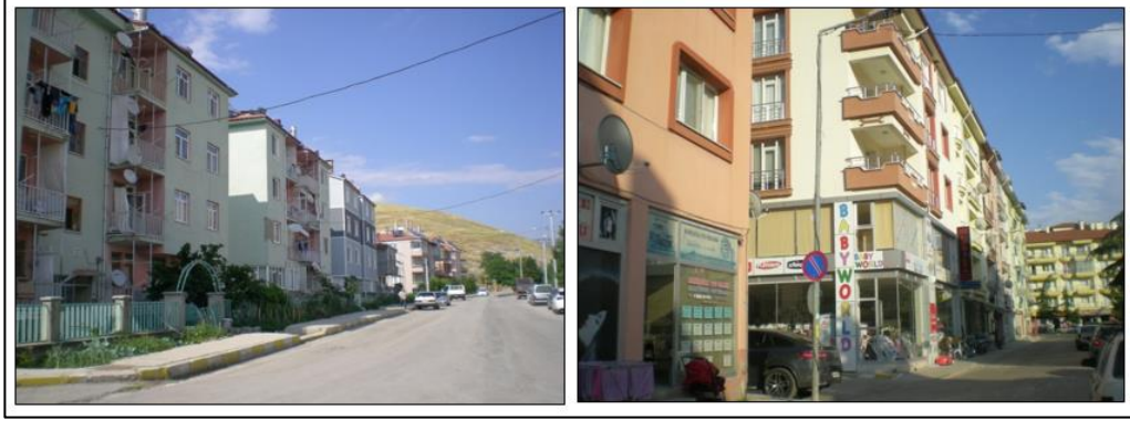
Şekil 2. Yalvaç yeni konut dokusundan örnekler (Arazi çalışması, 17-21 Temmuz 2017)

bağlanabilir. Bir hanede birden fazla ailenin yaşadığı büyük aile yapısı, yerini çekirdek ailelere bırakırken; kentsel doku bu taleplere cevap verecek yönde değişmektedir. Büyük ailelerin yaşadığı geleneksel konutlar terkedilirken, çekirdek ailenin yaşadığı apartman tipi konutlar artmıştır. Günümüzde geleneksel dokudaki konutları genellikle yaşların kullandığı görülmektedir.