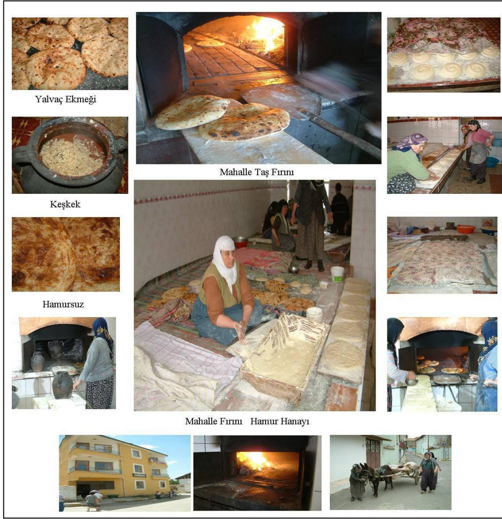
Şekil 5. “Yalvaç Kültürel-Doğal Değerlerin Korunması, Geliştirilmesi ve Turizmin Çeşitlendirilmesi Projesi” kapsamında hazırlanmış görsel

Piyasada geleneksel hamur işlerine olan talebin artması ile kadınlar mahalle fırınlarında ürettikleri ürünleri satmaya başlamıştır. Fırınlara kira ve vergiden muaf olması sebebiyle bu fırınlarda ticari satışlar yasaklanmıştır. Piyasadaki talebi değerlendirmek isteyen girişimciler, merkez mahallelerde, geleneksel ekmekleri üreten ticari fırınlar açmışlardır. İlki 2011 yılında açılan bu kategorideki fırınların günümüzde sayısı 12’dir (Yalvaç Kunderacılar, Bakkallar, Berberler, Esnaf Sanatkarlar Odası Başkanlığı, kişisel iletişim, 20 Eylül 2018). Bu durum, halihazırda 18 mahallede bulunan belediyeye ait 20 geleneksel mahalle fırınının kullanım oranları ciddi oranda düşürmüştür (Tablo 1).