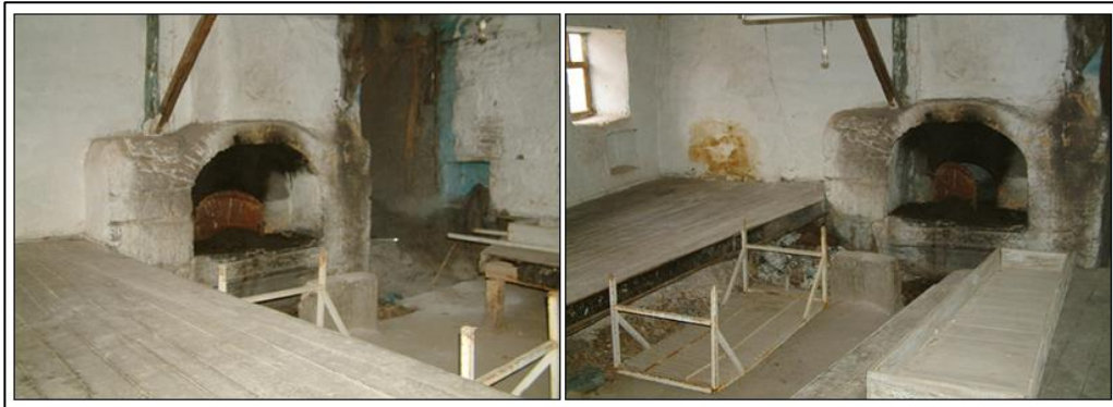
Şekil 3. Leblebiciler Mahallesi'ndeki tarihi fırın binası.

50 yıl öncesine kadar fırıncılık, Yalvaç'ta bir sanat olarak kadınlar tarafından mahalle taş fırınlarında yürütülmekteydi. Büyük ailelerin haftalık ekmek ihtiyacını karşılamak için kullandığı fırınlar, sosyo-ekonomik yapıda süregelen değişimler sonucu, toplum hayatı içerisindeki önemini giderek kaybetmiştir. Her mahallede yer alan ve kadınların üretim yaptığı geleneksel mahalle fırınlarından günümüze birkaç tarihi fırın binası kalabilmiştir (E. Kafafçı, kişisel iletişim, 22 Haziran 2018) (Şekil 3).