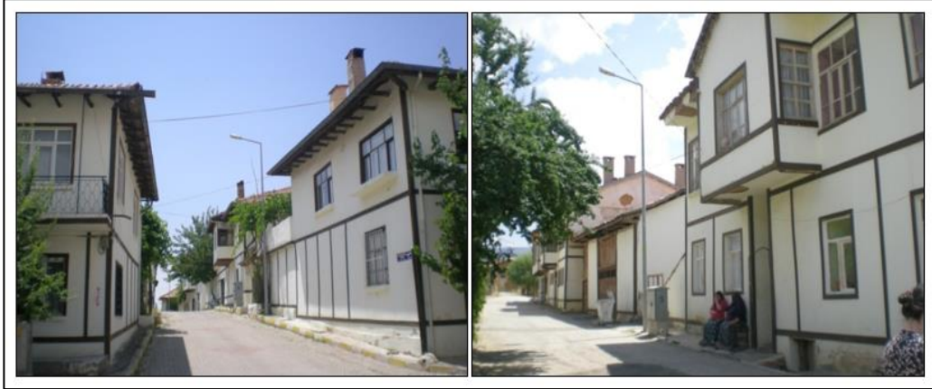
Şekil 1. Yalvaç geleneksel konut dokusundan örnekler (Arazi çalışması, 17-21 Temmuz 2017)

Anadolu Türk tarihinde Yalvaç adı, ilk kez, 14.yy.'da Hamidoğulları Beyliği'nin önemli bir şehri olarak karşımıza çıkmaktadır. Yalvaç ilçe merkezi, bir cami etrafında kurulan çarşısı ve çarşı etrafında gelişen mahalleleri ile tipik bir Türk kentinin tüm karakteristik özelliklerini göstermektedir (Karaman, 1991, s.71).