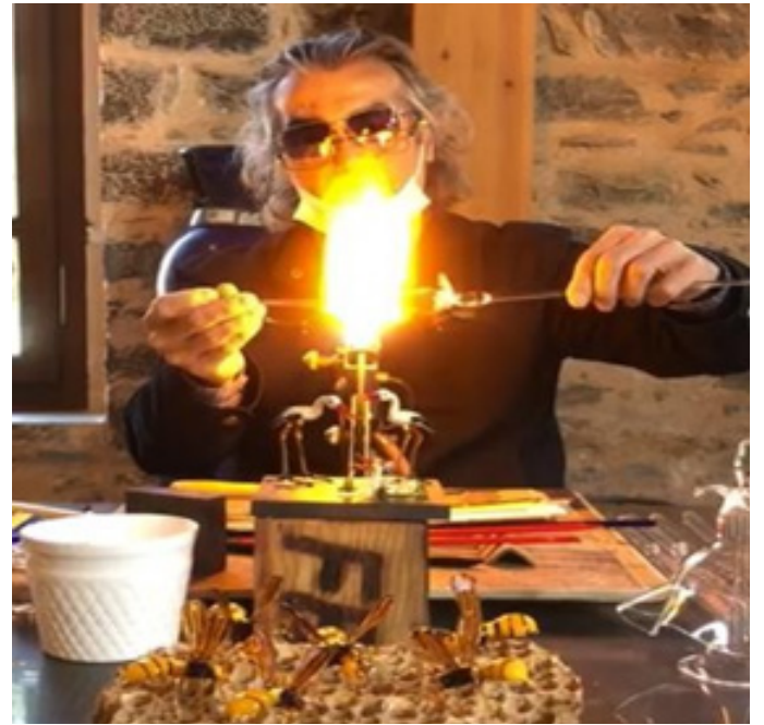
Figür 6. Uygulamalı Cam Atölyesi

Sergi alanında ziyaretçilerin uygulamalı olarak katılabildiği, cam üfleme tekniğinin gösterildiği bir cam atölyesi de kurulmuştur (Figür 6). Ziyaretçilerin cam üfleme aşamalarını deneyimleyebilmesi, gezi güzergâhı üzerindeki ışık, görüntü ve ses enstalasyonları ile de müzenin görülür/duyulur/hissedilir hale getirilmesi amaçlanmıştır (Figür 7).