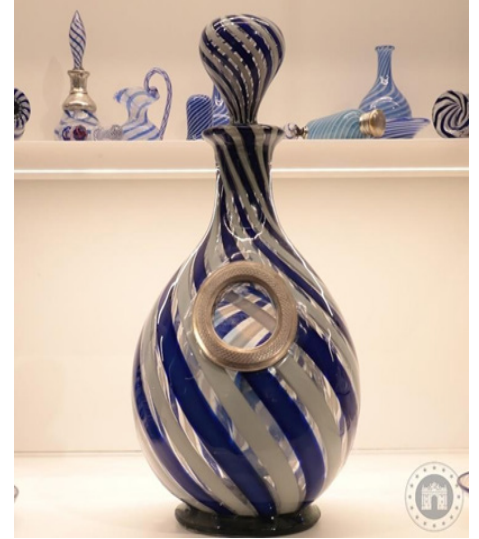
Figür 17. Çeşm-i Bülbül Karlık