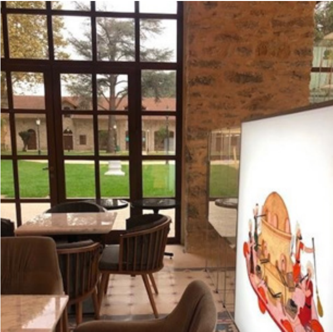
Figür 4. Beykoz Cam ve Billur Müzesi Kafe Bölümü

Gezi alanının bitiminde ziyaretçileri dinlenebilecekleri bir kafe ve hediyelik eşya bölümü karşılamaktadır (Figür 4,5). Beykoz işi çeşm-i bülbüller ve el üretimi çeşitli cam ürünler ziyaretçiler için satışa sunulmaktadır.