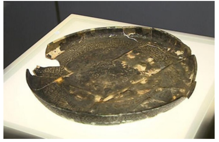
Figür 8. Kubadabad Tabakı, Konya Karatay Medresesi Çini Eserler Müzesi

Milli Saraylar'a ait cam eserler koleksiyonu, tematik olarak düzenlenmiş 12 bölümde sergilenmektedir.