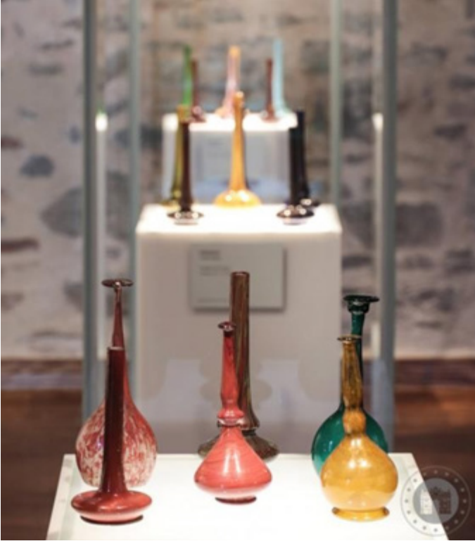
Figür 15. Lâledanlar Venedik, 16-17. yüzyıl Milli Saraylar Koleksiyonu

Türk camı ile Venedik sanatının buluşması III. Selim tarafından (1807) cam sanatını öğrenmek ve bilgisini geliştirmek üzere Derviş Mehmet Dede'nin İtalya'ya gönderilmesi ile başlamaktadır. Mehmet Dede cam tekniğini öğrendiği Venedik'ten dönüşünde Beykoz'da bir atölye açmış ve öğrendiği tekniği geliştirmesi sonucu Çeşm-i Bülbül ortaya çıkmıştır. Üretimi esnasında dönerek burulan çizgilerin ortaya çıkardığı desen bülbül gözüne benzetilmektedir. Bu nedenle bu tekniğe bülbül gözü anlamına gelen Çeşm-i Bülbül ismi verilmiştir.