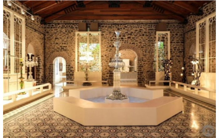
Figür 21. Beykoz Cam ve Billur Müzesi Cam Bahçe

Dolmabahçe Sarayı'nda bulunan, Sultan Abdülmecid döneminde (1839-1862), saray mimarı İngiliz William James Smith tarafından tasarlanan, cam ve kristal eserleri ile cam sanatının mimaride ve iç dekorasyondaki kullanımının gösterildiği Camlı Köşk'ün (Figür 21) bir tasviri olan 'Cam Bahçe' Beykoz Cam ve Billur Müzesi'nde de oluşturulmuştur. Avrupa'da 19.yüzyıl sonu ve 20.yüzyıl başında etkili olan, zarif dekoratif süslemelerin ön plana çıktığı Art Nouveau sanatından örnekler 'Cam Bahçe' bölümünde sergilenmektedir (Figür 22).