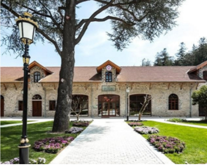
Figür 3. Beykoz Cam ve Billur Müzesi

Koru alanında Abraham Paşa'nın özel ilgisi ile Osmanlı Devleti'nde bulunmayan bitkiler ve ağaçlar getirilerek ekilmesi sonucu çok çeşitli bir bahçe florası oluşturulmuştur. Bu tarihi çeşitlilik Beykoz Cam ve Billur Müzesi'ne botanik müzesi özelliği de kazandırmaktadır. 117 farklı bitki türünün sergilendiği müze, organik malzemelerle üretilmiş park ve oyun alanı ile de çocukların müze farkındalığını arttırmayı hedeflenmiştir.