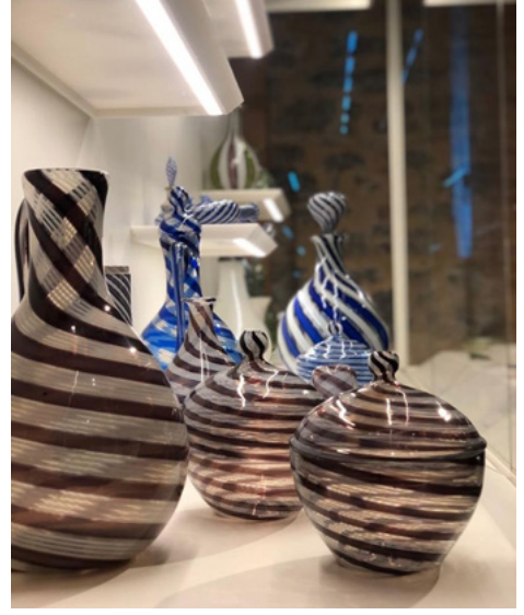
Figür 16. Beykoz İşi Çeşm-i Bülbüller, 19. yüzyıl Milli Saraylar Koleksiyonu

Müzenin kurulduğu semte ait zahmetli bir sanat tekniği olan ve Beykoz'un simgesi haline gelmiş "çeşm-i bülbüller" (Figür 16,17); çeşm-i bübüllere ilham olan, "retortoli" ve "filigrano" tekniği ile üretilmiş Venedik işi camlar ve opalinler de müze koleksiyonunda geniş yer kaplamaktadır (Figür18).