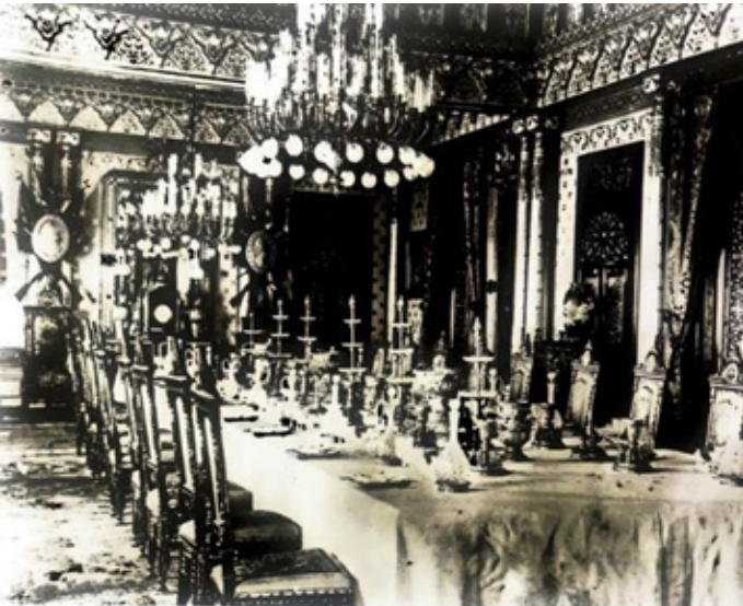
Figür 19. Ziyafet sofrası, Yıldız Fotoğraf Albümü

19.yüzyıl sonunda 'Kralların Kristali' ünvanını kazanan Baccarat kristallerinin en güzel örneklerinde de örnekler ziyafet sofrasında sergilenmektedir (M.S., 2011, s.136-137).