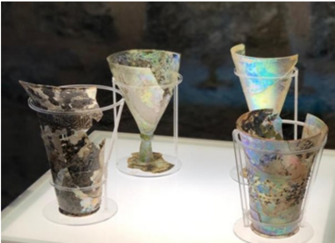
Figür 11. Anadolu Selçuklu, 13. yüzyıl Adıyaman Müzesi.

13.yüzyıla ait Anadolu Selçuklu Devri cam bardaklar ve kadeh erken dönem Türk camları örnekleri olarak sergilenmektedir (Figür 11).