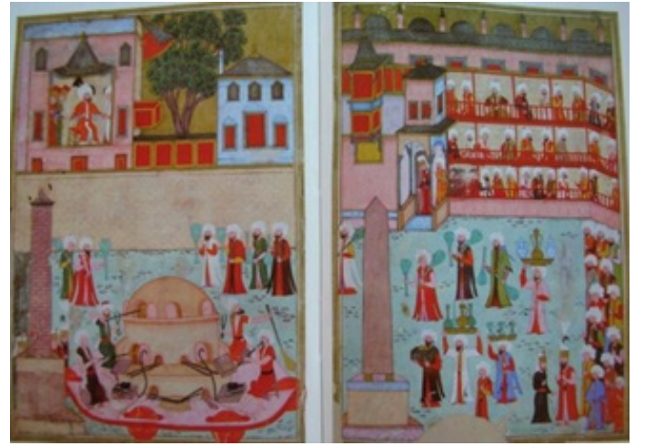
Figür 13. Surnâme-i Hümayun-Camcılarının Geçişi (wikipedia.org)

Geleneksel Selçuklu ve Osmanlı mimarisinde kullanılan renkli camlarla süslü 'revzenler'(Figür 14), 16-17.yüzyıla tarihlenen "lâledanlar" (Figür 15), dönem padişahlarının tuğraları bulunan, kesme dekorlu, mineli veya yaldızlı renkli/renksiz; vazo, şişe, ibrik, tabak gibi camlar günlük yaşam kullanımına ait tasarımlar olarak müze koleksiyonunda sergilenmektedir.