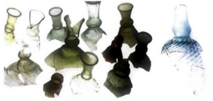
Figür 12. Marmaray- Sirkeci kazı buluntusu Surnâme camları, İstanbul Arkeoloji Müzeleri

İstanbul'da Marmaray-Sirkeci istasyonu inşası sırasında İstanbul Arkeoloji Müzeleri denetiminde yapılan arkeolojik kazılarda (2004-2011) çok miktarda Osmanlı camı gün ışığına çıkarılmıştır. Osmanlı camcılığı tarihi açısından çok büyük önem taşıyan bu cam buluntuların, sahip oldukları özellikler, renk ve formların yakın benzerleri III. Murad'ın oğlu Şehzade Mehmed'in 1582 yılında yapılan sünnet düğününün anlatıldığı Surnâme -i Humayun'daki minyatürlerde görülmektedir (M.S., 2021, s. 43). Surnâme'deki biçimlerin gerçek örnekleri olmaları dolayısı ile 'Surnâme Camları' olarak Beykoz Cam ve Billur Müzesi'nde sergilenmektedir (Figür 12,13).