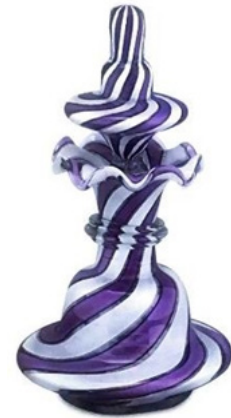
Figür 18. Vetro a fili şişe, Venedik 16. yüzyıl