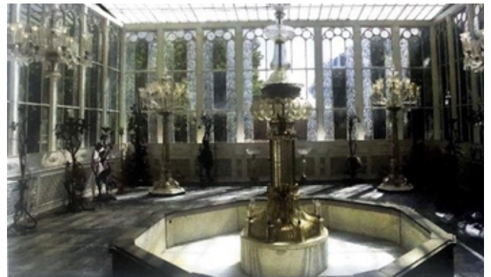
Figür 22. Dolmabahçe Sarayı, Camlı Köşk