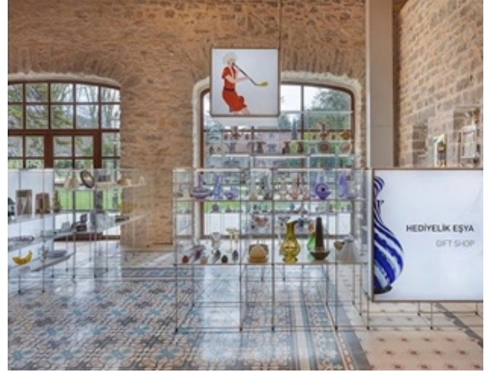
Figür 5. Beykoz Cam ve Billur Müzesi Hediyelik Eşya Bölümü

600 yerli ve yabancı kitabın bulunduğu cam eserler kütüphanesi de olan Beykoz Cam ve Billur Müzesi, bu alanda daha detaylı araştırma yapmak isteyen tüm ziyaretçilerine kaynak niteliğindedir.