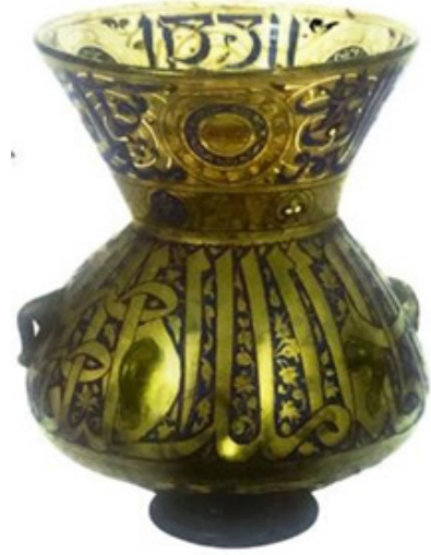
Figür 9. Memluk, 14. yüzyıl Milli Saraylar Koleksiyonu

Kubadabad tabağının yanı sıra cam üfleme tekniğiyle yapılmış, mine işi ve yaldızlama yöntemi ile süslenmiş, döneminin tipik özelliklerini ve yüksek zevkini yansıtan 14. yüzyıl Memluk kandili (Figür 9).