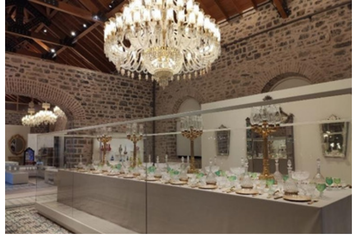
Figür 20. Beykoz Cam ve Billur Müzesi, 19. yüzyıl ziyafet sofrası teşhiri

Dolmabahçe Sarayı'nda bulunan, Sultan Abdülmecid döneminde (1839-1862), saray mimarı İngiliz William James Smith tarafından tasarlanan, cam ve kristal eserleri ile cam sanatının mimaride ve iç dekorasyondaki kullanımının gösterildiği Camlı Köşk'ün (Figür 21) bir tasviri olan 'Cam Bahçe' Beykoz Cam ve Billur Müzesi'nde de oluşturulmuştur. Avrupa'da 19.yüzyıl sonu ve 20.yüzyıl başında etkili olan, zarif dekoratif süslemelerin ön plana çıktığı Art Nouveau sanatından örnekler 'Cam Bahçe' bölümünde sergilenmektedir (Figür 22).