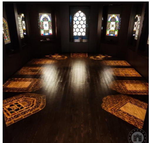
Figür 14. Revzenler Osmanlı, 18-19. yüzyıl Milli Saraylar Koleskiyonu

Geleneksel Selçuklu ve Osmanlı mimarisinde kullanılan renkli camlarla süslü 'revzenler'(Figür 14), 16-17.yüzyıla tarihlenen "lâledanlar" (Figür 15), dönem padişahlarının tuğraları bulunan, kesme dekorlu, mineli veya yaldızlı renkli/renksiz; vazo, şişe, ibrik, tabak gibi camlar günlük yaşam kullanımına ait tasarımlar olarak müze koleksiyonunda sergilenmektedir.