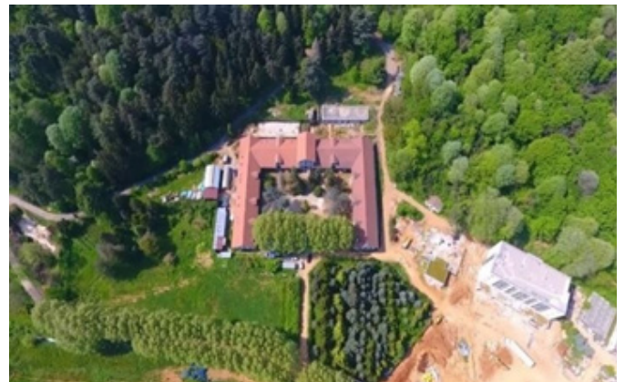
Figür 2. Beykoz Cam ve Billur Müzesi

Müzenin arazisi yaklaşık 360 dönümdür. Abraham Paşa'nın yaptırdığı yapılardan günümüze kalan ahır binası Milli Saraylar tarafından restore edilerek müzeye dönüştürülmüştür. 19. yüzyıl mimari özelliklerini taşıyan bina, U planlı bir düzenleme içinde avluyu kuşatan benzer mekânların çoğaltılmasına dayanan modüler bir yapı olup cepheleri alt katta yuvarlak kemer açıklıklarıyla hareketlendirilmiştir. Taş örgüsü ve Batı etkili görkemli yapısıyla özgün müze mekânları sunmaktadır (Figür 2,3).