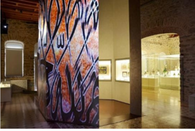
Figür 7. Işık, görüntü ve ses enstalasyonu