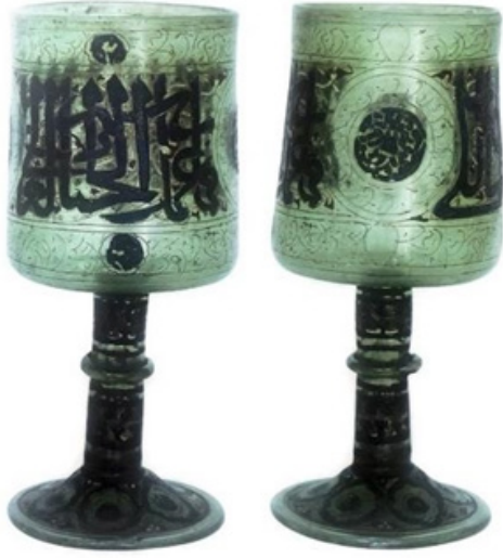
Figür 10. Kadeh biçimli Memluk kandili, Milli Saraylar Koleksiyonu, T.S.M., 2/2099

13.yüzyıla ait Anadolu Selçuklu Devri cam bardaklar ve kadeh erken dönem Türk camları örnekleri olarak sergilenmektedir (Figür 11).