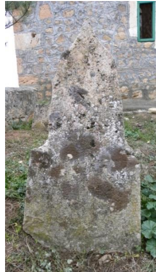
Görsel 14a: Ali Paşa'nın baş taşı Görsel 14b: Ali Paşa'nın ayak taşı