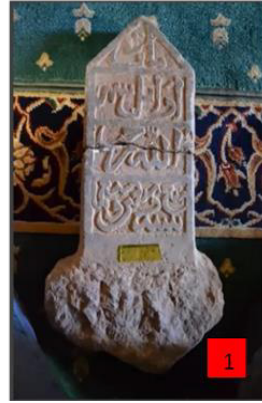
Görsel 8: Cami İinde Muhafaza Edilen Mezar TaŐı 15