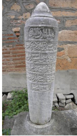
Görsel 11a: Â'îşe Hanım'ın baş taşı