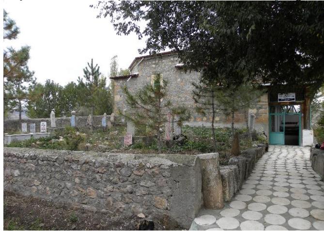
Gűrsel 4: Hazire Alanı