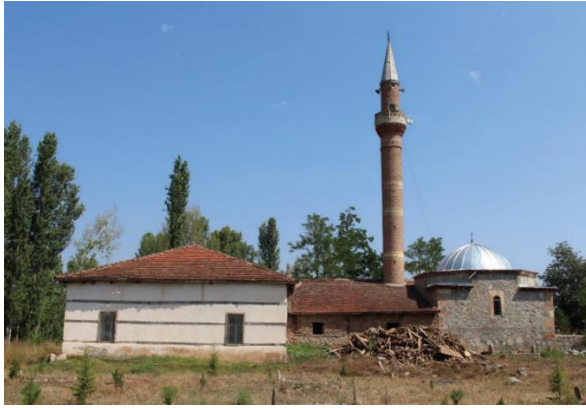
Gűrsel 2: Gűney Cephe Genel GűrűnűŐ