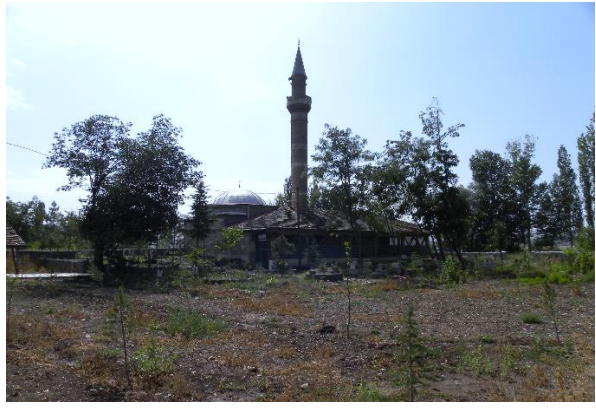
Gűrsel 3: Kuzeydođu'dan Genel GűrűnűŐ