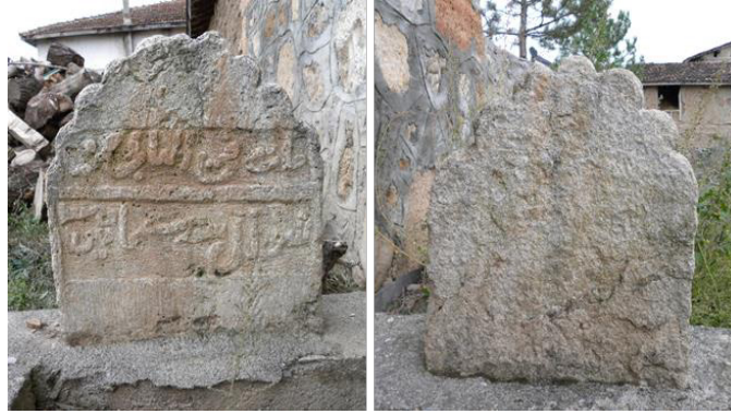
Grsel 10a: 2 no.lu baŐ taŐı