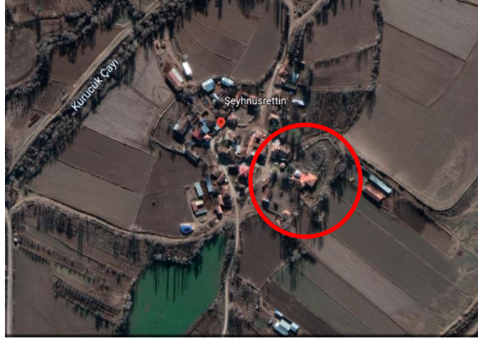
Gűrsel 1: Őeyh Nusrettin Yapı Topluluđu Uydu Gűrűntűsű 13

kronolojik olarak listelenmiŐtir. Deđerlendirmeye alınan baŐ ve ayak taŐlarının űn yűzlerinin izimleri de yapılmıŐtır (Gűrsel 17).