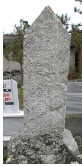
Görsel 15a: Hacı Ali(?)Ağa'nın baş taşı Görsel 15b: Hacı Ali(?)Ağa'nın ayak taşı