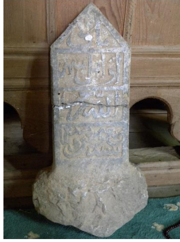
Görsel 9: 1 no.'lu baş taşı