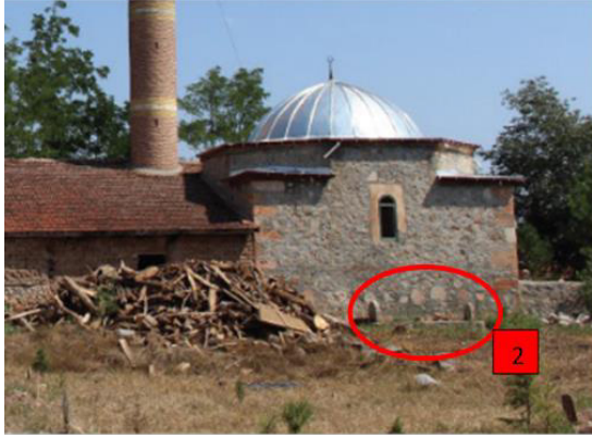
Görsel 7: Tűrbenin Gűneyinde Yer Alan Mezar