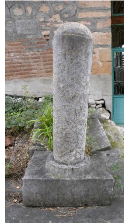
Görsel 11b: Â'îşe Hanım'ın ayak taşı