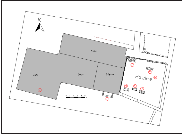
Görsel 5: Şeyh Nusrettin Haziresi Vaziyet Planı 14

Çalışmamızda türbenin doğu yönünde bulunan 6 (altı) adet mezar, güney yönde türbe duvarına bitişik 1 (bir) adet mezar ve cami içinde muhafaza edilen 1 (bir) adet baş taşı ile birlikte toplamda 8 (sekiz) örnek her yönüyle incelenip, değerlendirilmeye çalışılmıştır (Görsel 5, 6, 7, 8). Şeyh Nusrettin Türbesi haziresinde tarihi değer taşıyan mezar örneklerinin yanında yakın tarihli yeni mezarlar da bulunmaktadır. Günümüzde, yapı topluluğunun çevresi mezarlık alanı durumdadır ve bu alanlarda yakın tarihli mezarlar mevcuttur.