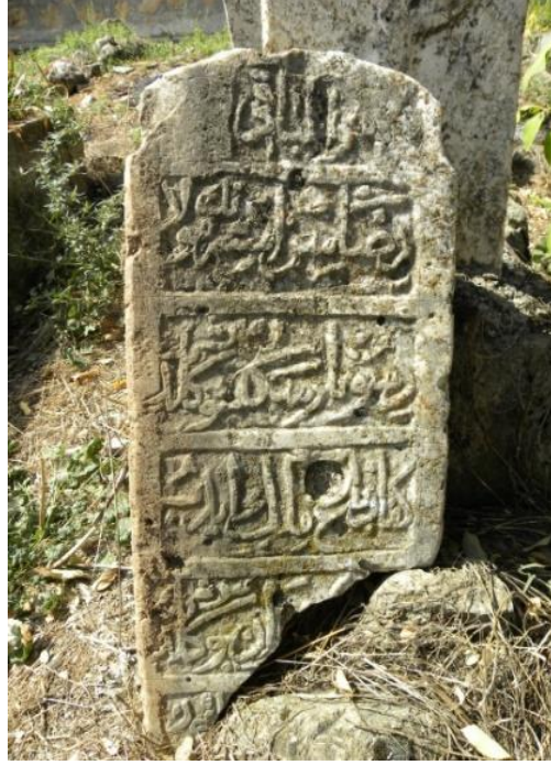
Grsel 16: 8 no.'lu baş taşı