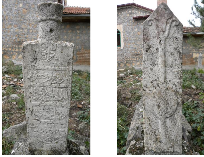
Görsel 13a: Servâr Hatun'un baŐ taŐı Görsel 13b: Servâr Hatun'un ayak taŐı