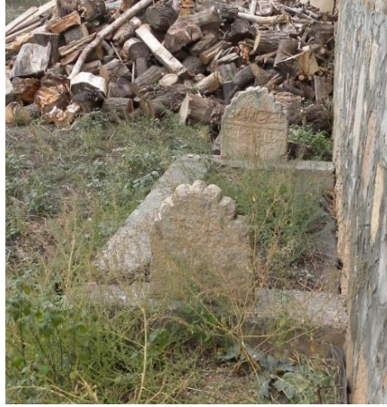
Grsel 10: 2 no.lu mezarın genel grnts