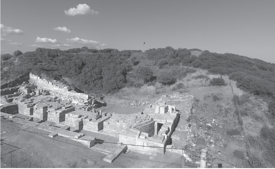
Fig. 2 Parion Tiyatrosu.