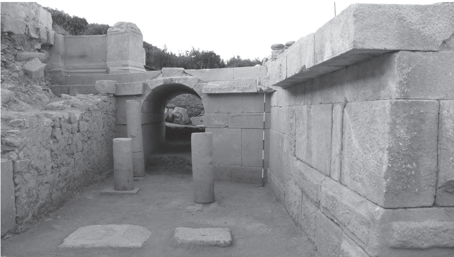
Fig. 3 Sikkelerin Bulunduğu Hyposcaeniumun Bölümü.