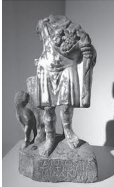
Fig. 5 (Perea Yébenes 2015, 313 Fig. 1)