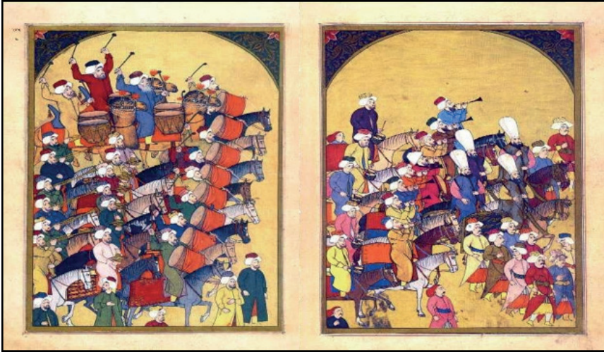
Resim 3. Mehter birliğini tasvir eden bir minyatur 3

Mehter, Osmanlı'nın güçlü olduğu, yayıldığı dönemde ordunun bir parçasıydı. Savaşta askerin moralini yükseltmek, düşman güçlerinin de moralini bozmak için, gücünü katlayarak büyüten birkaç bin kişilik moral kuvveti olurdu. Ordunun yanında ve önünde yürüyerek, at, katır, ve develerle taşınan dev vurmali ve yüksek nefeslileriyle neredeyse top etkisi yapardı. (Kaygısız, 2000, s.143) (bkz. Resim 3)