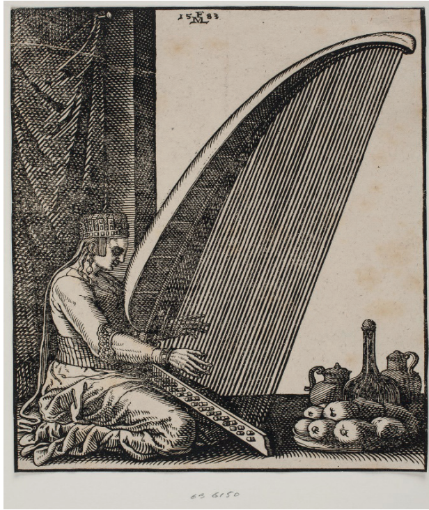
Resim 1. Melchior Lorichs'un "Türk çengi" enstrümanı çalan kadın temalı çizimi 1

yazdığı XVI ıncı Asır Sonuna Kadar Türk Sazşairleri isimli kitabında, Bertrandon de la Broquiere isimli diplomatın bu düşünceye zıt olarak Sultan 2. Murad'ın musikiye olan düşkünlüğünü ve 1433 yılında Edirne Sarayında katıldığı bir davette 12-14 kişiden oluşan müzisyen topluluğun kahramanlık şarkıları ve şiirleri dinlediği yer almaktadır (Köprülü, 1930, s.27). Aynı dönemde Danimarkalı ressam Melchior Lorichs bu anlatılanlara paralel olarak sarayda "Türk çengi" enstrümanı çalan kadın temalı bir resim yapmıştır. (bkz. Resim 1)