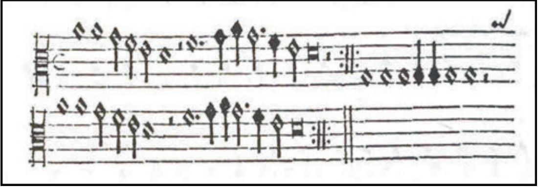
Resim 2. Schweigger'ın notaya aldığı Mehter Havası 2

literatüre geçen ilk nota örneği olması açısından büyük önem teşkil etmektedir (bkz. Resim 2). Schweigger notanın yanına marş hakkında şunları not almıştır; “Hep aynı ezgiyi çalıp dururlar, bir türlü değişmez ezgi. Bir üçlemenin yahut bir fügün başlaması gereken noktada bütün sazlar yine aynı ezgiyi üflerler” (Reindl-Kiel, 2019, s.478).