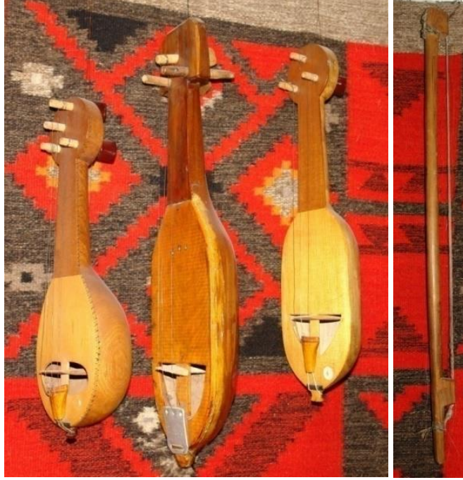
Fotoğraf 1. Kauş çalgıları ve yayı (Komrat Müzesi- Gagauz Özerk Bölgesi, Moldova).

Kauş, Balkanlarda yaşayan ve Türk topluluklarından biri olan Gagauzlar 2 tarafından icra edilen yaylı ve üç telli bir çalgıdır. Küçük ebatlı ve armudi formlu olan kauş (Fotoğraf 1) genellikle düğün ve şenliklerde davul, kaval ve çırtma (çığırtma) gibi çalgılarla beraber icra edilmiştir. Ayrıca vaftiz ve ad koyma törenlerinde de kullanılmıştır 3 .