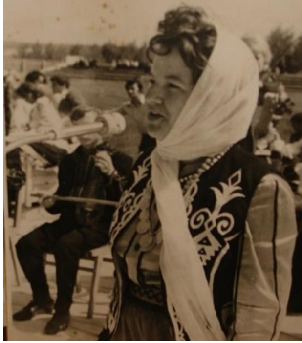
Fotoğraf 7. Kauşunun diz üzerindeki icrası (Komrat Müzesi, Gagauz Özerk Yeri).

Çalgıda tellerinin akordu dörtlü veya beşli aralıkta yapılabilmektedir. Teller, Sol- Re- Sol veya La- Mi-La notalarına akort edilmektedir 8 .