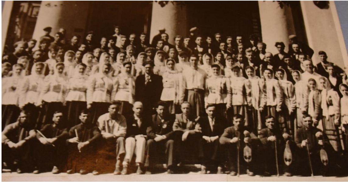
Fotoğraf 5. Farklı formlardaki kauşlar (Sağ alt köşede)- (1958 Yılı – Komrat Müzesi).