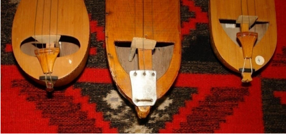
Fotoğraf6. Kauşların ses delikleri, kıyruk ve eşik detayları (Komrat Müzesi, Gagauz Özerk Yeri).

Çalgının sap bölümü oldukça kısadır. Bunun ön yüzü, icrada parmakların ucunun dayandığı tuşe kısmını da oluşturmaktadır. Sapın üst bölümünde akort burgularının yer aldığı burguluk bölümü bulunmaktadır. Kauş'un burguluğu değişik formlarda yapılmaktadır. Bu formlar kimi zaman çokgen, kimi zamanda daire biçiminde olabilmektedir (Fotoğraf 1, 3, 4). Burguluk üzerinde yer alan akort burguları, burguluğun arka tarafından geçirilip, ön yüzünden çıkartılmaktadır. Burguların uçları yaklaşık 1-3 cm. kadar burguluğun üzerine taşmaktadır (Fotoğraf 4). Öndeki bu çıkıntıya teller sarılmaktadır.