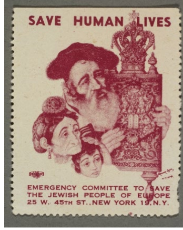
Şekil 2. İkinci Pul