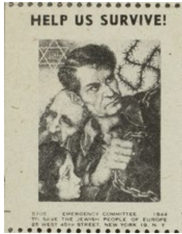
Şekil 6. Altıncı Pul

Görüntüsel gösterge açısından incelendiğinde altıncı pulda üç insanın resmedildiği görülmektedir. Pulun sağında elinde zincir olan bir adam görseline yer verilmektedir. Elinde zincir olan adamın yanında sakallı yaşlı bir adam bulunmaktadır. Pulun sol alt köşesinde ise kipa giyen genç bir çocuğun yüzüne yer verilmektedir. Diğer yandan pulun sağ üst köşesinde dikenli telden oluşturulmuş gamalı haç bulunmaktadır. Pulun sol üst köşesinde ise altıgen yıldız resmedilmektedir. Hayatta kalmamıza yardım edin! (Help us survive!) sloganı üst kısma yerleştirilmiş ve dağıtım yapan kuruluş ve adresleri alt kısma basılmıştır.