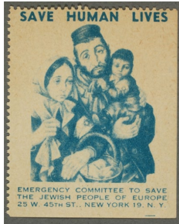
Şekil 5. Beşinci Pul