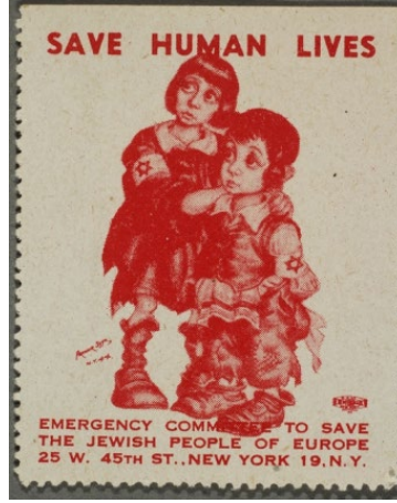
Şekil 4. Dördüncü Pul

köşesinde sanatçının imzası ve tarih bulunmaktadır. İnsan hayatını kurtarın (Save Human Lives) sloganı üst kısma yerleştirilmiş ve dağıtım yapan kuruluş ve adresleri alt kısma basılmıştır.