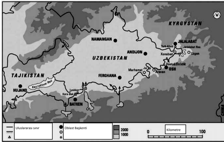
Şekil 3. Fergana Vadisinde Bulunan Anklavlar

sorunu ve bu sorunun değişik bir tezahürü olan iki ülke içinde bulunan anklavlar olduğu görülür (Sultanov: 2001 akt. Baycaun, 2003: 67). 1924 yılındaki sınır düzenlemeleri, bazı köylerde Kırgız ve Özbeklerin karışık yaşamasına, bazı Kırgız köylerinin Özbekistan sınırı içinde ve bazı Özbek köylerinin de Kırgız sınırı içinde kalmasına neden olmuştur. Bunun en temel nedeni, Fergana Vadisi'nden geçen Sir-i Derya'nın ve yolların bir tarafının Kırgızlara diğer tarafının da Özbeklere verilmesidir (Ulu, 2006: 69). Özbekistan ile Kırgızistan arasında 2002 yılında başlayan sınır belirleme çalışmaları neticesinde, iki ülke mevcut 1099 kilometrelik ortak sınırın yaklaşık 780 kilometresi üzerinde anlaşılabilmiştir. Sınırın geri kalan 320 kilometrelik bölümü ile ilgili belirsizlik ise netleştirilememiştir. Bugün itibarıyla, Kırgızistan ile Özbekistan arasındaki ortak sınırdaki yaklaşık 50 tartışmalı nokta çözüm beklemektedir (Zaman Gazetesi, 2012).