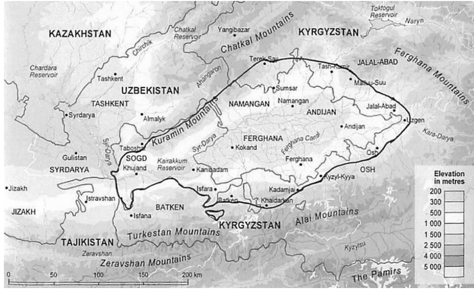
Şekil 2. Fergana Vadisi