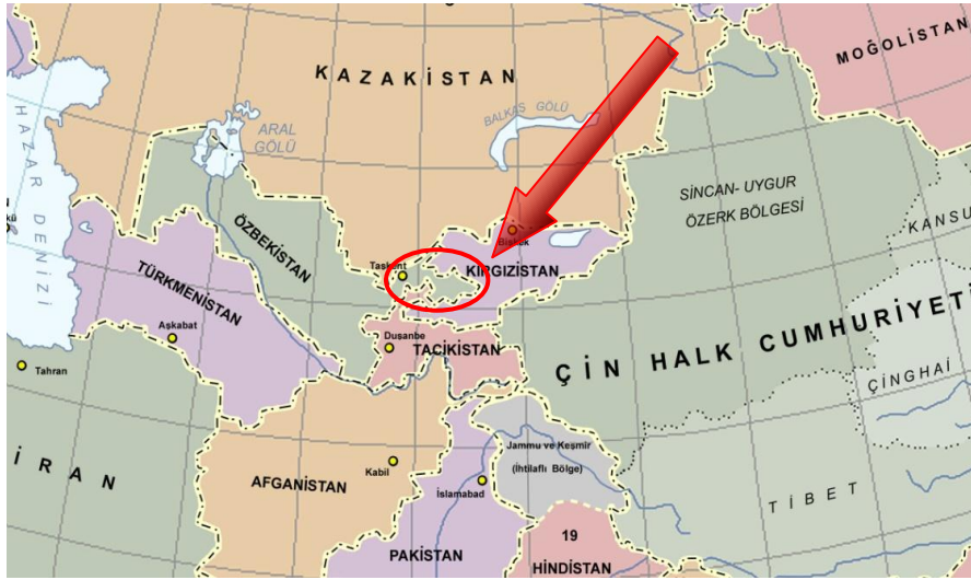
Şekil 1. Avrasya Siyasi Haritası

Özbekistan, Kırgızistan ve Tacikistan devletlerinin ortasında, Tanrı ve Pamir Dağları'nın arasında bulunan Fergana Vadisinde yerleşim ve uygarlık, tarihin ilk sayfalarına kadar uzanmaktadır. Fergana'da kent ve pazarların kurulması ise geçmişte İpek Yolu'nun bu vadiden geçmesi ile birlikte olmuştur (Ulu, 2006: 67). Günümüzde 10 milyon kişinin yaşadığı Fergana Vadisi, Orta Asya'da nüfusun en yoğun olduğu bölgelerden biridir: Coğrafik olarak Orta Asya'nın % 5'ini teşkil etmesine rağmen, Orta Asya nüfusunun % 25'i bu bölgede yaşamaktadır (Shozimov, 2008).