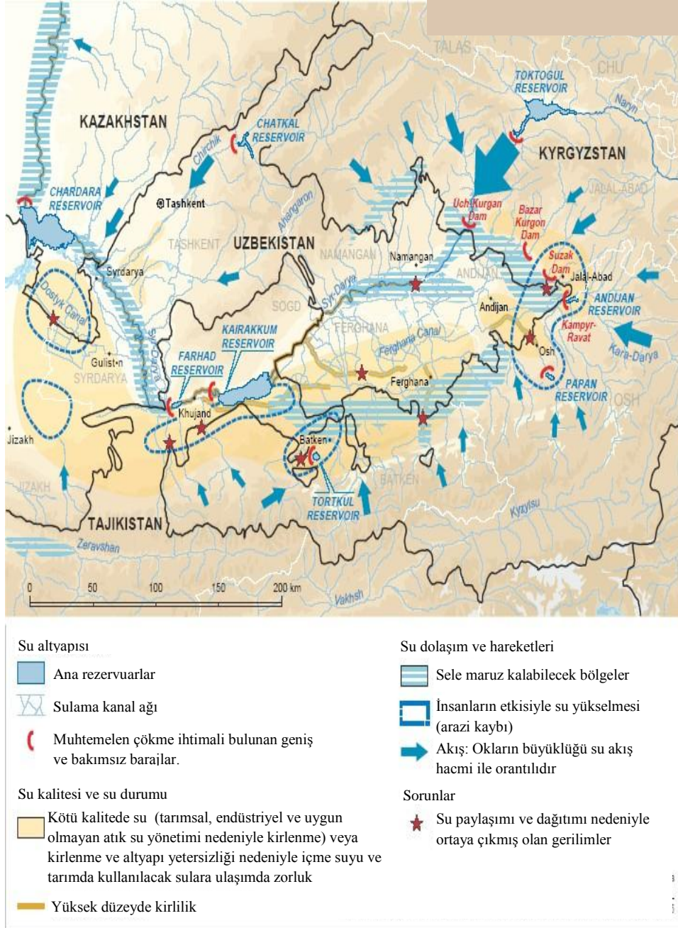
Şekil 5. Orta Asya'da Su Kaynaklı Konular