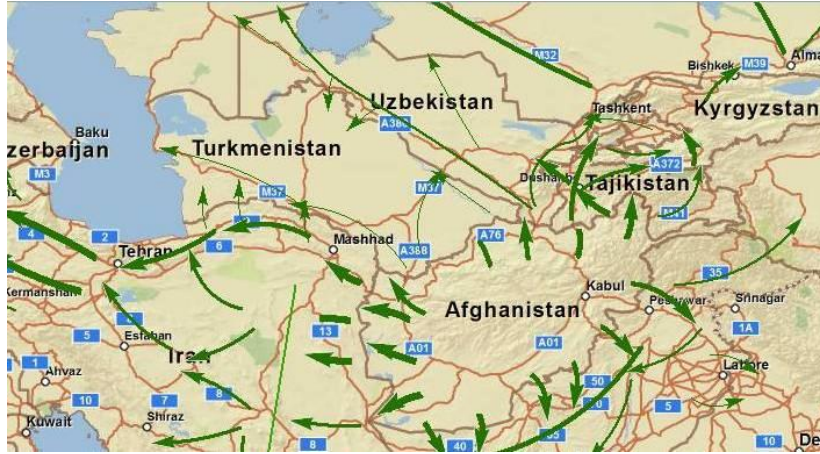
Şekil 6. Afganistan’da Üretilen Uyuşturucu Maddelerin Pazarlara Ulaştırılmasında Kullanılan Güzergâhlar