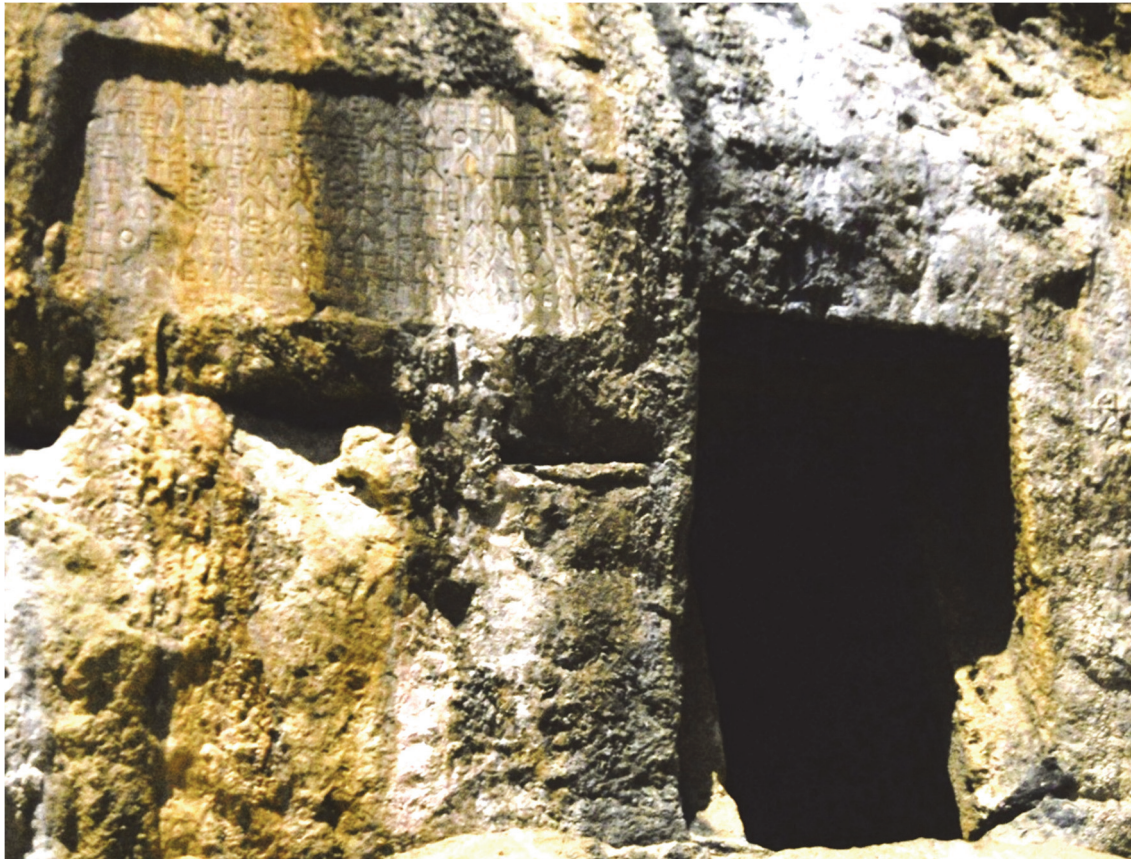
Abb. 1) Grabeingang und Inschrift

TL 150 1 steht neben dem Eingang zu einem Felsgrab ohne Fassade in einem Tal nördlich von Rhodiapolis.