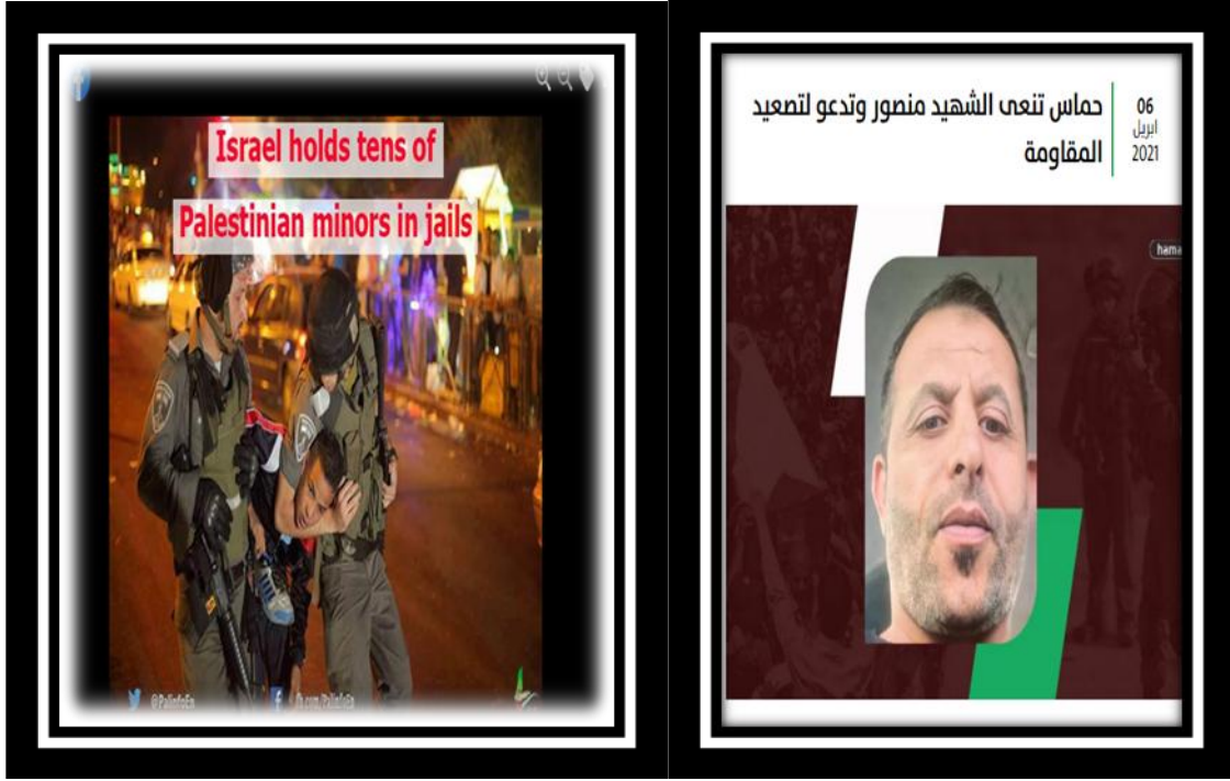
Filistin Enformasyon Merkezi Facebook Hesabı (2016). Hamas Medya Ofisi Sitesi: (06.04. 2021). https://hamas.ps/ar/post/13102

Filistin Enformasyon Merkezi: Filistin Enformasyon Merkezi Filistin sorununa yönelik içerikler üreten önemli sitelerinden biri olup yedi dil’de yayın yapmaktadır. Site’de İsrail- Filistin sorununa yönelik makale ve akademik çalışmalarda yayınlanmaktadır. Ayrıca site Tarih ve Kültür, Kudüs ve Mescidi Aksa, Esir ve Şehit, Video, Röportaj içerikleri ile zenginleştirilmiştir. Site’de işkenceye uğrayanlarla ilgili haber içerikleri de yoğun bir şekilde görülmektedir. ( https://turkish.palinfo.com/ ). FEM’in Twitter hesabında faal olmakla birlikte 11.04.2021 tarihi ile 267,700 takipçisi bulunmaktadır. Twitter hesabında İslami Direnişe yönelik seslendirmeler yüksek olmakla birlikte bu direnişe yönelik fotoğraf ve içerikler yoğun olarak dolaşıma sokulmaktadır. Direniş mahkûmları, İsrail’in gerçekleştirdiği şiddet içerikleri ve direniş aktörlerine ilişkin içerikler viral dolaşıma sokulmaktadır. ( https://twitter.com/PalinfoAr ). FEM’in Facebook sayfasına araştırma esnasında erişilememiştir. Telegram hesabında ise 11.04.2021 tarihi itibarı ile 658 abonesi bulunmaktadır ( https://telegram.me/Palestina ). Telegram sayfasının ön sözünde ise; “Dünya İçin Filistin’in Sesi, Filistin için Dünyanın Sesi” dikkat çekicidir. Telegram ve Twitter gibi sosyal medya platformlarında hedef kitleye yönelik oluşturulan içeriklerin amaçları;