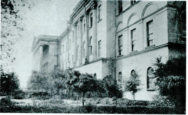
Res. 3 – Birinci Darülfünûn Binasının Denize Bakan Cephesi