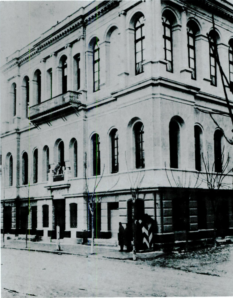
Res 4 – İkinci Darülfünûn Binasının Umumi Görünüşü