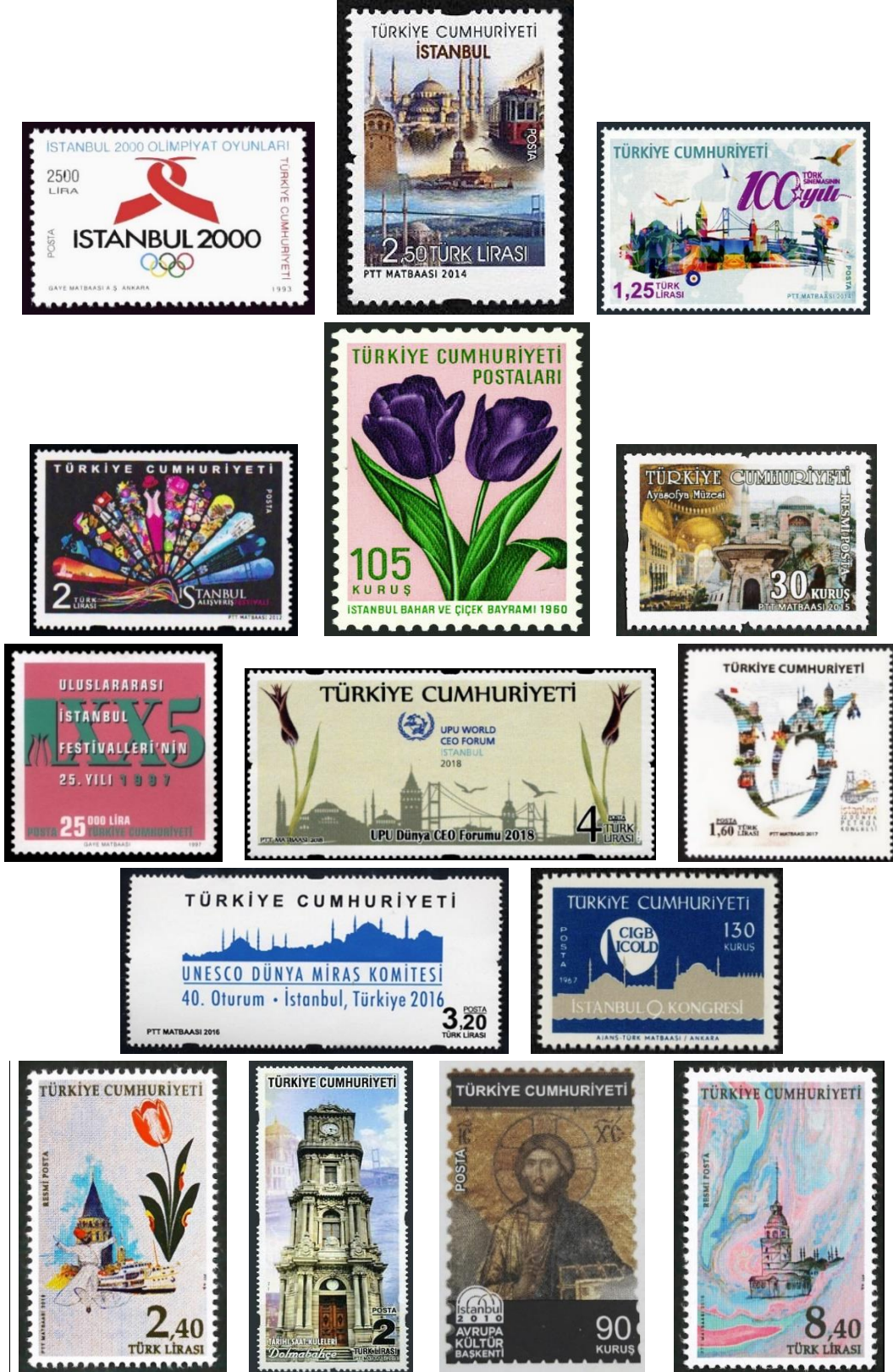
Şekil 19. İstanbul Temalı Tasarım Örnekleri