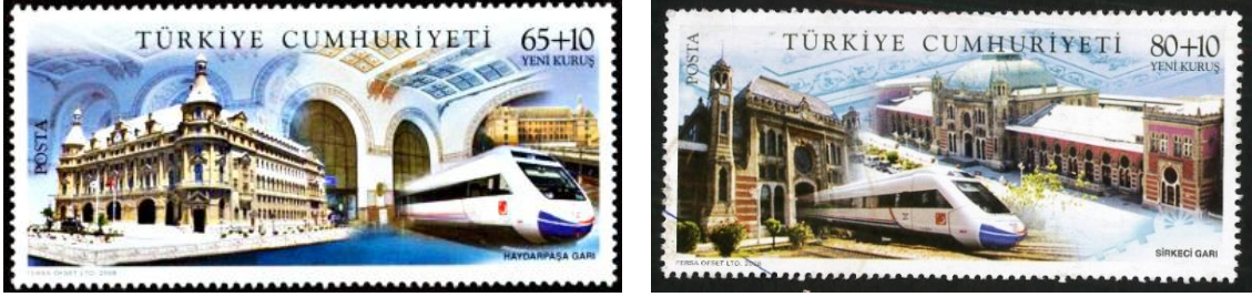
Şekil 6. Haydarpaşa ve Sirkeci Tren Gari