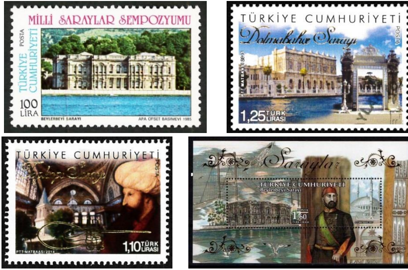
Şekil 14. Beylerbeyi, Dolmabahçe ve Topkapı Sarayı

Kaynak: (Acıgöz, 2020, s. 89; Geçmişten Günümüze Posta, 2007, s. 406).