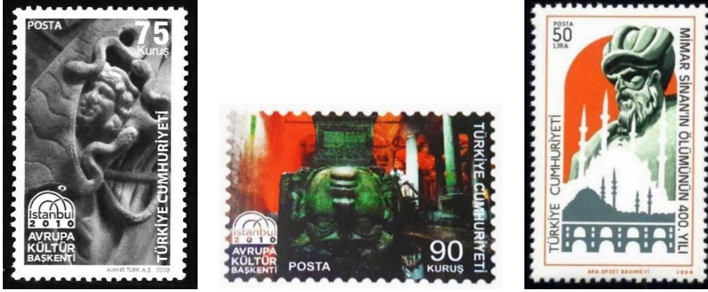
Şekil 15. Sarnıç, Medusa Baş ve Su Kemerli