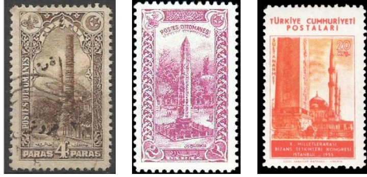
Şekil 3. Çemberlitaş ve Dikilitaş (Obelisk)