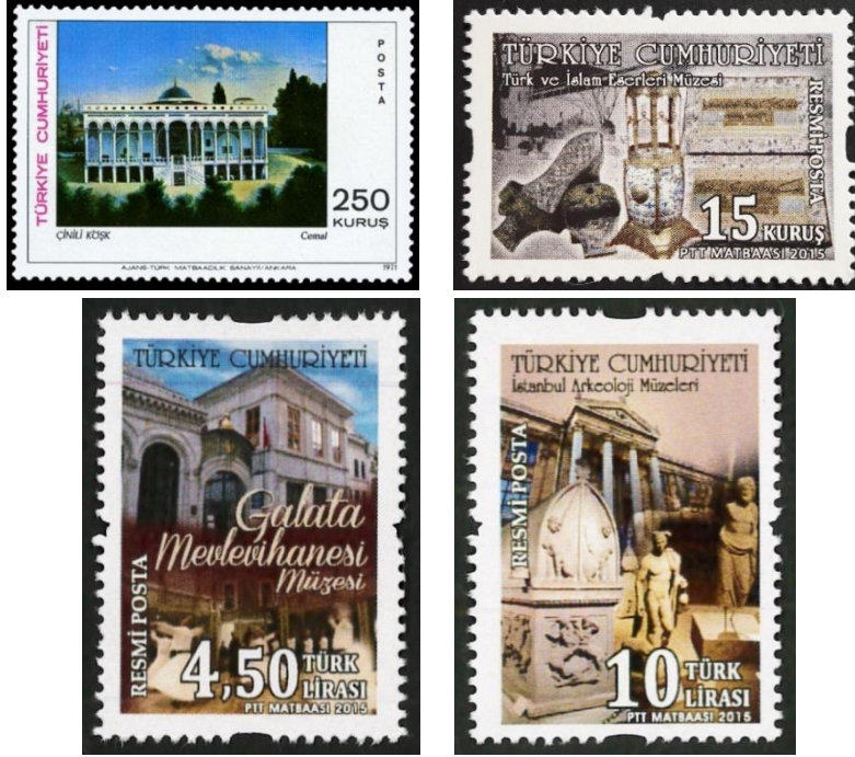
Şekil 11. Çinili Köşk, Türk ve İslâm Eserleri Müzesi, Galata Mevlevihane'si ve İstanbul Arkeoloji Müzesi

Kaynak: (Aktan, 2018, s. 21; Şensoy, 2018a, s. 23).