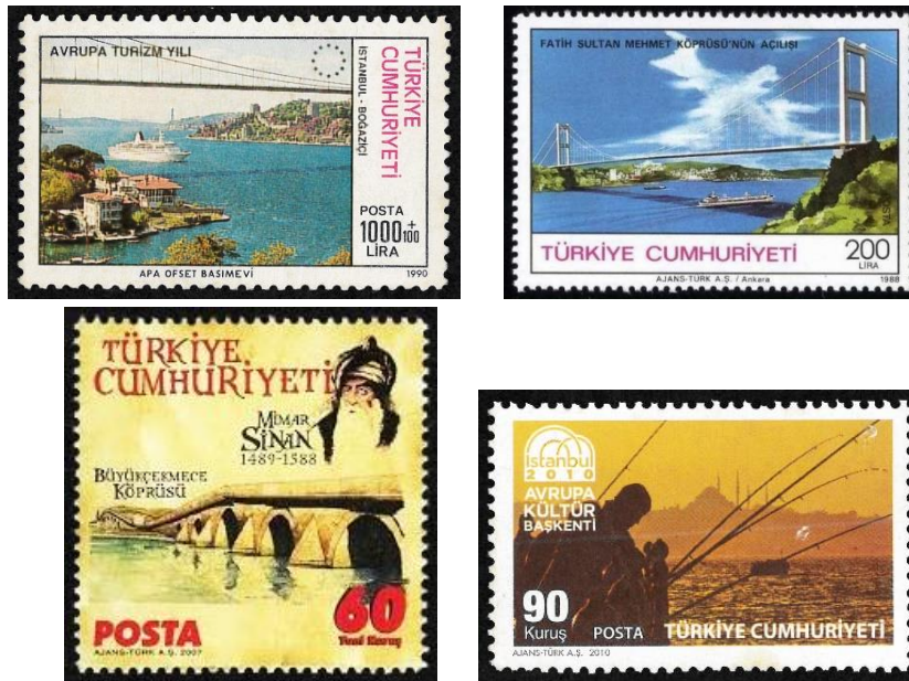
Şekil 10. Boğaziçi, Fatih Sultan Mehmet, Büyükçekmece ve Galata Köprüsü