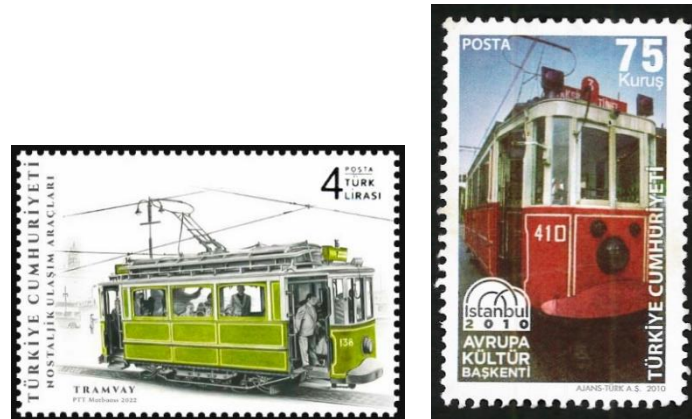
Şekil 16. Finüküler ve Nostaljik Tramvay