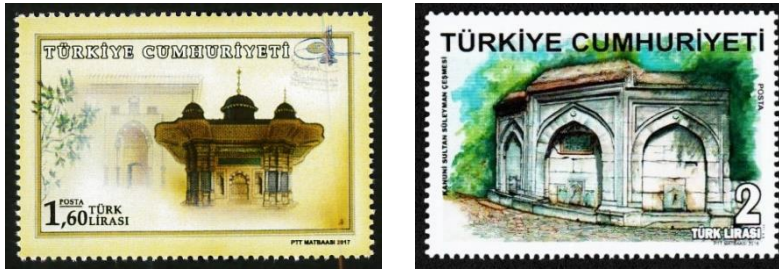
Şekil 13. III. Ahmet ve Kanuni Sultan Süleyman Çeşmesi