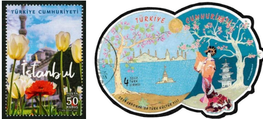
Şekil 17. Lale Motifi ve Erguvan Ağacı