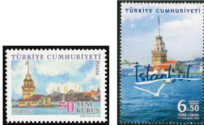
Şekil 9. Kız Kulesi