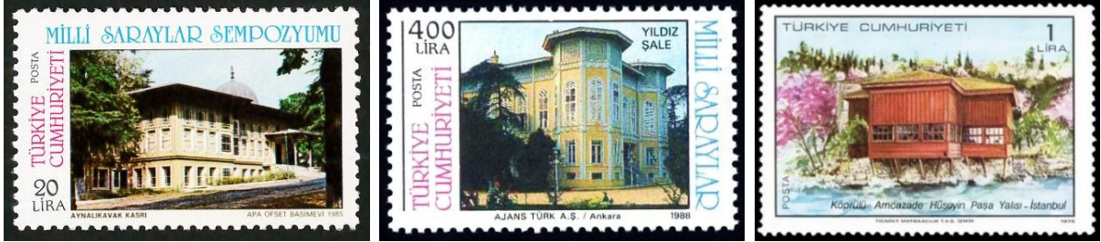
Şekil 8. Kasırlar, Köşkler ve Yalılar