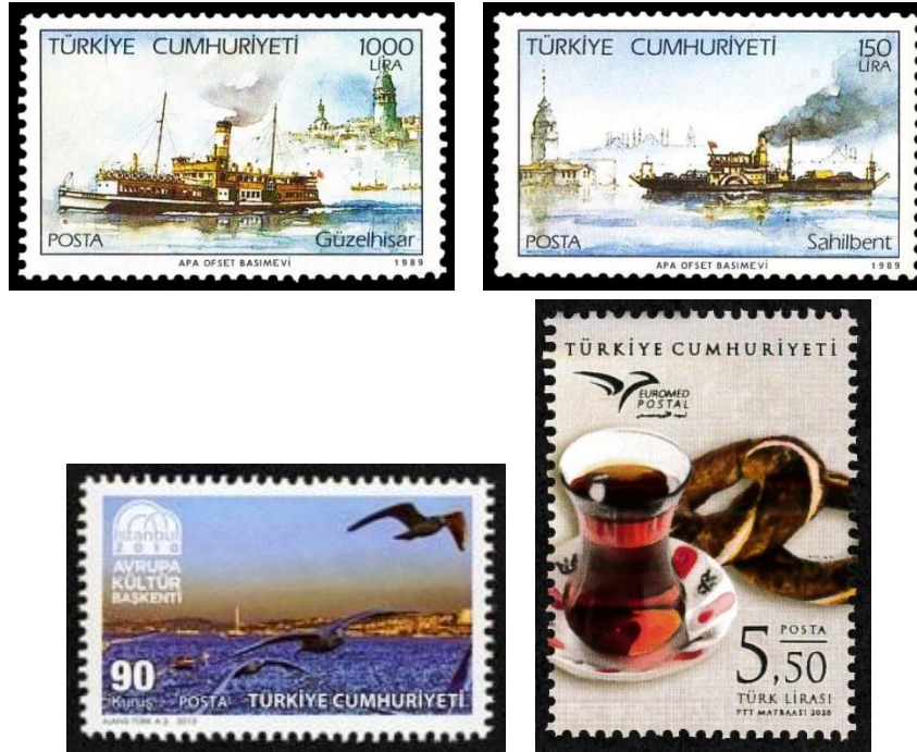
Şekil 18. Vapur, Martı, Çay ve Simit