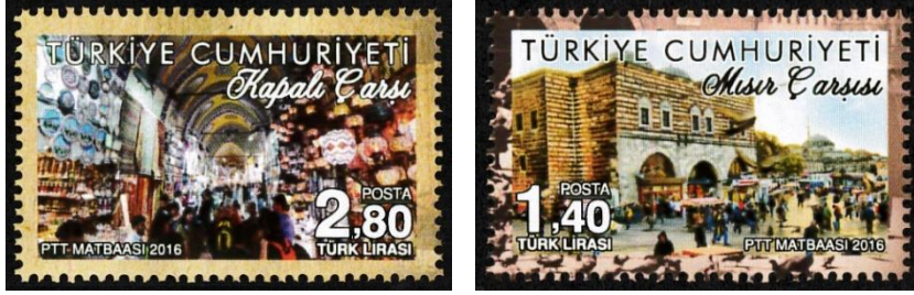
Şekil 12. Kapalı Çarşı ve Mısır Çarşısı