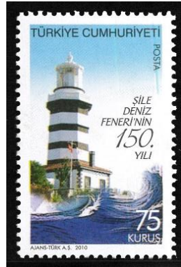
Şekil 4. Şile Deniz Feneri

İlk örneklerini Yunan ve Roma dönemlerinde gördüğümüz fenerler, deniz seferleri açısından oldukça önemli yapılarıdır. 1562’de Kanun-i Sultan Süleyman tarafından yaptırılan ilk deniz feneri örneği Fenerbahçe Feneri olarak karşımıza çıkmaktadır. Zamanla, deniz ticareti gelişmiş ve fenerlere duyulan ihtiyaç da artmıştır. İstanbul’daki fener ve liman ihtiyacı ise 1856’da toplanan Paris Kongresinde görüşülmüştür. Özellikle Karadeniz’e geçişlerde, boğaz geçişini kolaylaştırmak ve güvenliği sağlamak adına bu tür yapıların gerekliliği tartışılmıştır. Aynı yıl, boğazın her iki yakasına toplam 36 fener yapılması yönünde karar alınmıştır. Fener yapıları arasında bulunan ve 60 metre yüksekliğe sahip olan Şile Deniz Feneri ise Türkiye’nin en büyük feneridir (Özlü ve Çay, 2020, s. 85-91). Boğazın Karadeniz çıkışında bulunan ve doğal bir görünüme sahip olan Anadolu ve Rumeli Fenerleri de sıklıkla ziyaret edilen yapılarıdır. Rumeli Feneri’nin içerisinde diğer fenerlerden farklı olarak Saltuk Dede Türbesi bulunmaktadır. Bu alanın yakınında dizi ve film çekimleri için tercih edilen Rumeli Feneri Kalesi yer almaktadır.