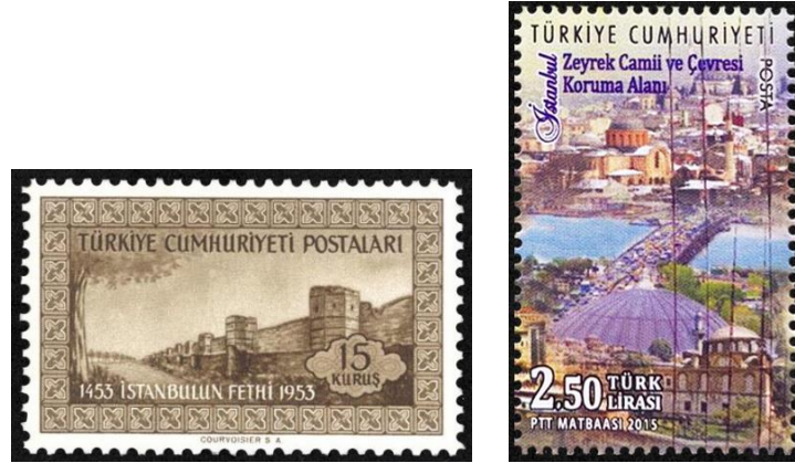
Şekil 7. Kara Surları ve Tarihi Yarımada