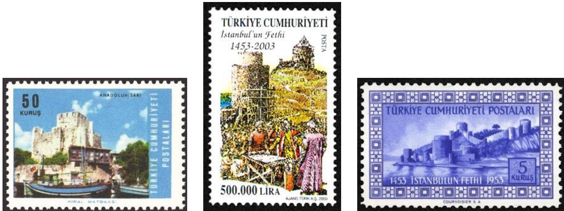
Şekil 1. Anadolu ve Rumeli Hisarı