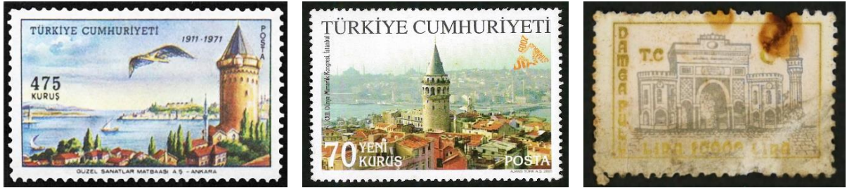
Şekil 5. Galata ve Bayezid Kulesi