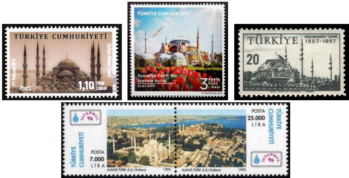
Şekil 2. Sultanahmet, Ayasofya ve Süleymaniye Camii