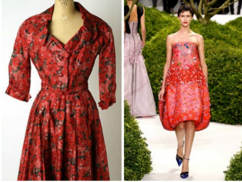
Görsel 6. Monet'in Poppies adlı eserinden uyarlanmış Dior ve Raf Simons gece elbisesi tasarımları

Raf Simons'un 2012-2013 defilesinde gösterinin yapıldığı alanda şekil ve görsel düzenleme ile ilgili neo-formalist (yeni biçimcilik) yaklaşım ile hazırlanan dekorlar ve kış bahçesi görüntüsü yansıtan aynalar ile kaplanmıştır (Roberts, 2015: 11). Defileyi izlemeye gelen misafirlere defile alanı tıpkı çiçek bahçesinde gibi izlenim verilmiştir. Tüm alanlar yapay çiçekler ile süslenmiştir. Monet'in eserlerinde görülen izlenimcilik sanatı, Dior'un elbise tasarımlarında izlenimcilik sanatı etkileri görülürken, Raf Simons sayesinde sadece elbiselerde kalmayıp defilenin yapılacağı alanlarında da bu çiçek bahçelerinin etkileri de görülmektedir. Görsellerden de anlaşılacağı gibi defilenin yapılacağı alanında kostüm tasarımında olduğu gibi en ince ayrıntısına kadar düzenlenmesi kıyafetlerin yanı sıra markaların imajı üzerinde de olumlu etkisi olmuştur (Görsel 7). Bu sayede imajı güçlenmiş ve tasarımlara estetik bir bakış açısı katmaktadır.