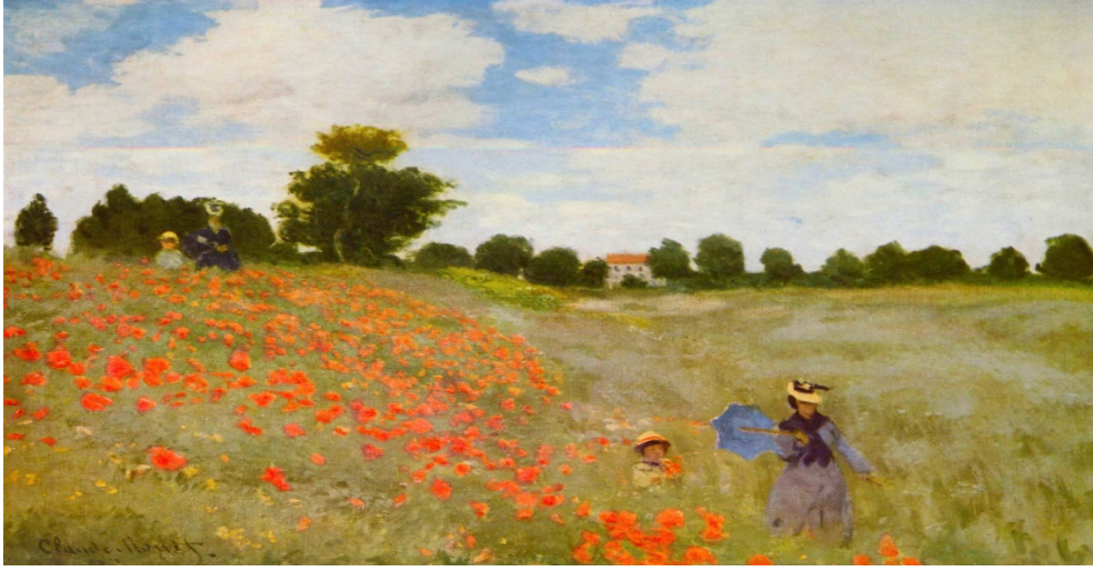
Görsel 5. Monet, The path through the irises, 1873, Paris, Musee d'Orsay

Christian Dior'un tasarımcısı Raf Simons kendi tasarımlarında eril idealleri ve tematik kavramlara odaklanan soyut bir entelektüel üzerine inşa etmiştir. Bunun için Granvilledeki tasarımcının aile evinde Dior'un iki tutkusu olan çiçekler ve mimariyi bir araya getirmiştir. Dior on dokuzuncu yüzyılda Claude Monet tarafından hazırlanan Gelincik Tarlası (Poppies) adlı eserinden etkilenecek bir kostüm tasarımı oluşturmuştur.(Görsel 6). Simons 2012-2013 sonbahar kış koleksiyonu ve 2012-2013 ilkbahar – yaz gece elbisesi koleksiyonunda Dior'un mirasına sahip çıkarak tasarlamış olduğu çiçeklerinden ilham almıştır. Defilede hazırlanan koleksiyonlardaki elbiselerden bir tanesi Monet'in gelincikler tarlasında tasarlamış olduğu eseri çağrıştırmıştır. Dior için tasarlanan kostümlerin tasarımlarında çiçek görünümlerini kendi üslubu ile tasarlayarak feminen görüntüyü ortaya çıkardığı görülmektedir.