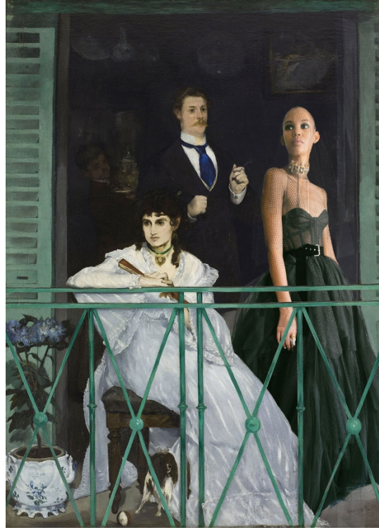
Görsel 10. Christian Dior 2019 sonbahar kış gece kıyafeti katalog çekiminde Edouard Manet tablosu esinlemesi

Görsel 8, 9 ve 10'da da görüleceği ve Kapferer'in de desteklediği üzere, lüks hazır giyim ürünlerinin tanıtımında görsel sanat eserlerinin kullanımı gittikçe moda sektöründe yaygınlaşmaya başlamıştır (Kapferer, 2014: 372). Bu bağlamda tasarlanan ürünler, evrensel olarak kabul edilen eserlerin yanında sergilemeye başlamıştır (Pesulo vd., 2017: 2193). İzlenimcilik sanatının etkileri Christian Dior markasının sadece elbise tasarımında değil yapmış olduğu reklam kampanyalarında da görülmektedir. 2013 sonbahar kış kampanyasında kullanılan ressam Edouard Manet'nin 1863 yılında "çimlerin üzerinde öğle yemeği" adlı eseri güçlü bir bağlantı sağlar. Özellikle reklam kampanyalarında izlenimcilik eserlerinin kullanılması kendi yaratımlarının oluşturmada etkili olmaktadır.