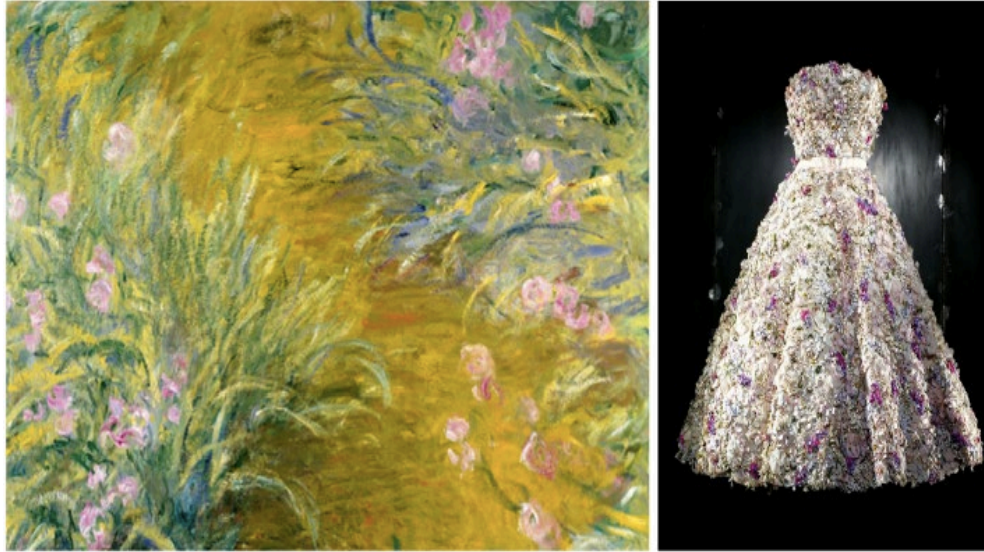
Görsel 4. Monet'in The path through the irises isimli eseri ve Raf Simons yorumlaması gece elbisesi

Görsel 4 ile gösterilen elbisenin üzerindeki işlemler; Dior'un yasemin, beyaz güller ve yeşil notalardan oluşan çiçek kompozisyonunu göstermektedir. İzlenimlerle boyanmış bahçelerde renklerin ve ışıkların canlı oyununu çağrıştırmaktadır.