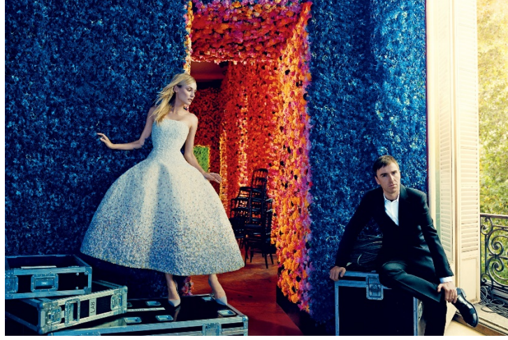
Görsel 8. Vogue dergisi, Eylül 2012

Yazılı basın iletişim araçları ile moda tüketicilerinin dikkatini çekmeyi başarmış ve markanın hazırlamış olduğu koleksiyonun moda tüketicileri tarafından bilinirliği artmıştır.