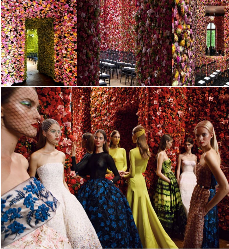
Görsel 7. Raf Simons defile alanı görseli

Defilede kullanılan öğelerin sadece defile alanında değil tüm sosyal mecralarda ve yazılı basında paylaşımı yapılmıştır. Dönemin ünlü dergisi Vouge, Raf Simons'un ilham aldığı Dior elbise ile defile alanının bulunduğu yeri kendi sayfalarında yayımlamıştır (Görsel 8).