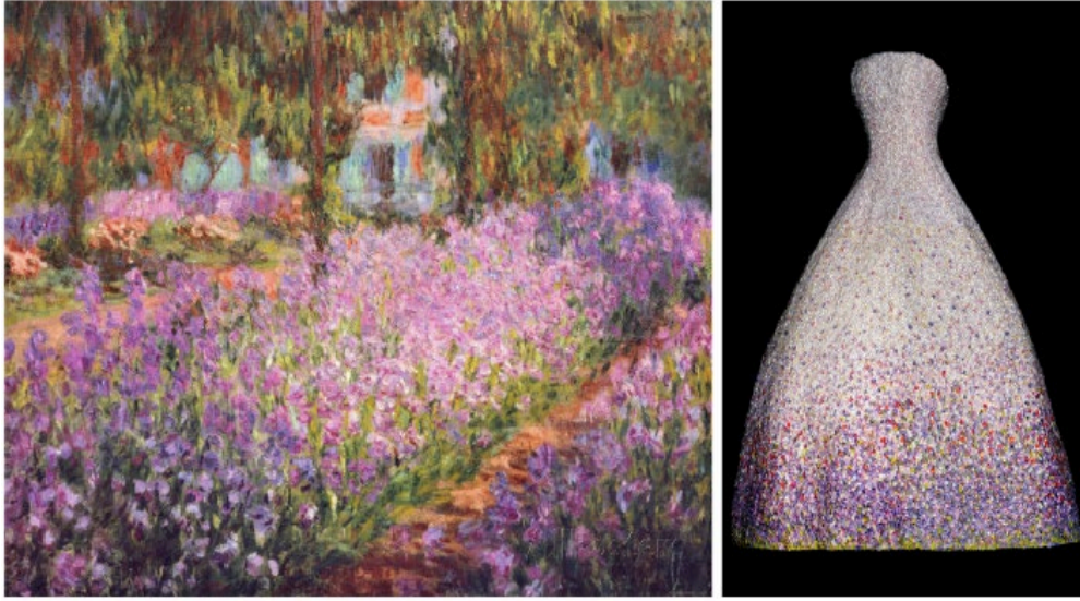
Görsel 2. Monet'in The Artist's Garden at Giverny isimli eseri ve Christian Dior tarafından 1949'da tasarlanan elbise

omuzları yuvarlatılmış ve geniş etekleri olan çiçek bahçelerini anımsatan elbiseler tasarlamıştır. Tasarımları yaptıktan sonra o andan itibaren çiçekleri ve kadınları aynı varoluş alanına yerleştirmiştir. Dior kendi silüetlerini ortaya çıkarmak için botanik metaforlar kullanmıştır. Bu metaforlar Corolle, Lale ve çizgili olan Maquet çiçeklerinin yapısı, oluşturmuş olduğu silüetin matrisini oluşturmaktadır. Tasarlanan elbisenin yüzeyine işlenecek olan veya basılacak olan çiçek motiflerini yerleştirdiği görülmüştür. Claude Monet resimlerinde bahçedeki kadın figürlerini ışıpta hacimli elbiselerde canlandırmaya çalışmıştır. Georges Seurat tarafından hazırlanan Bir Pazar günü öğleden sonra La grande Jatte adasında tablosunda metal teller kullanılarak oluşturulan kostümlerde elbiselerin dik açıları ile oynamıştır. Dior daha sonra hazırlanan bu silüetlerin büyüsunü çağdaş ve sade bir dokunuş ile yeniden canlandırmıştır. Eteği daha kabarık hale getirmek için içine hacimli organze kumaş yerleştirdiği görülmektedir (Müller, 2013: 30).