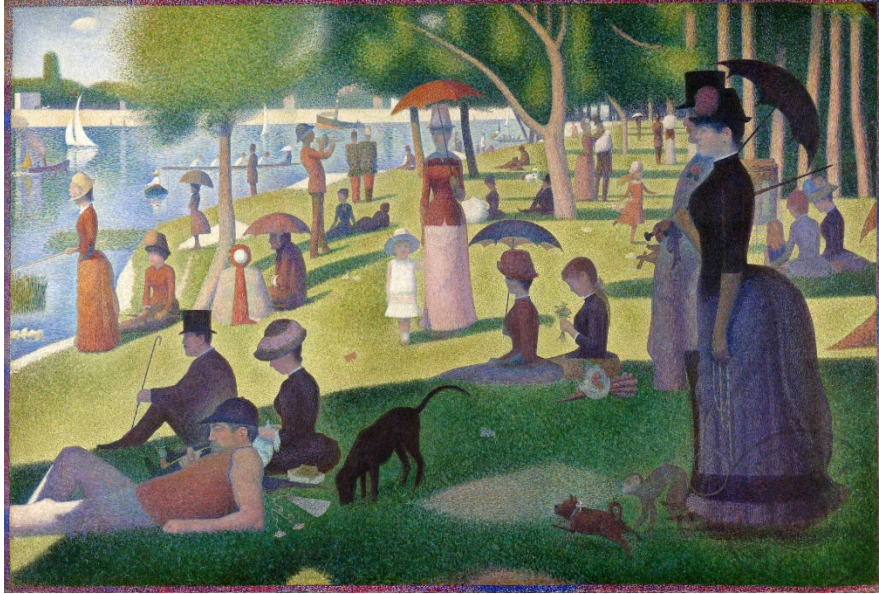
Görsel 1. Georges Seurat, Grande Jatte Adası'nda Bir Pazar Öğleden Sonrası , 1886, Şikago Sanat Enstitüsü, Chicago, ABD

İzlenimci ressamlar sadece Monet ile sınırlı kalmayıp farklı ressamalarda gündelik hayatı ve doğal yaşamı konu almışlardır. Bu ressamlardan Georges Seurat'ın tasarlamış olduğu aşağıdaki tablo incelendiğinde, resimlerin arka planlarında kentli insanların tüketim ve boş zaman aktivitelerini görebildikleri açık hava parkları, kafeler, tekneler ve yeşillik alanlar görülmektedir. Resimlerdeki kadın modasının özelliklerine genel olarak baktığımızda yapay silüet değişikliklerinin geliştirildiğini görülmektedir. Tasarımcıların hazırlamış oldukları elbiselerde firfir ve büzgü detayları görülmekte olup, kadın silüetinde kıvrımlar hâkimdir. Gündelik şehir hayatında, kadınların giyimlerinde koyu rengi tercih etmesi ve şapka ve şemsiye gibi aksesuarların kullanıldığı dikkat çekmektedir (Hyewon, 2018: 76).