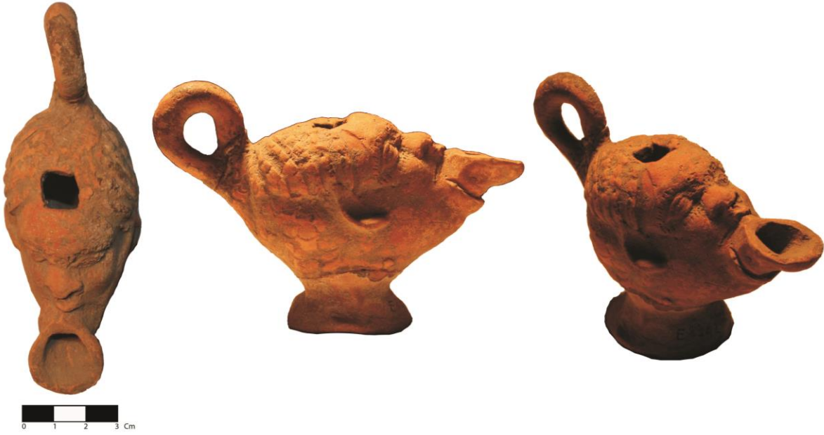
Resim 2: Burdur Müzesi E.8842 No'lu Plastik Kandil