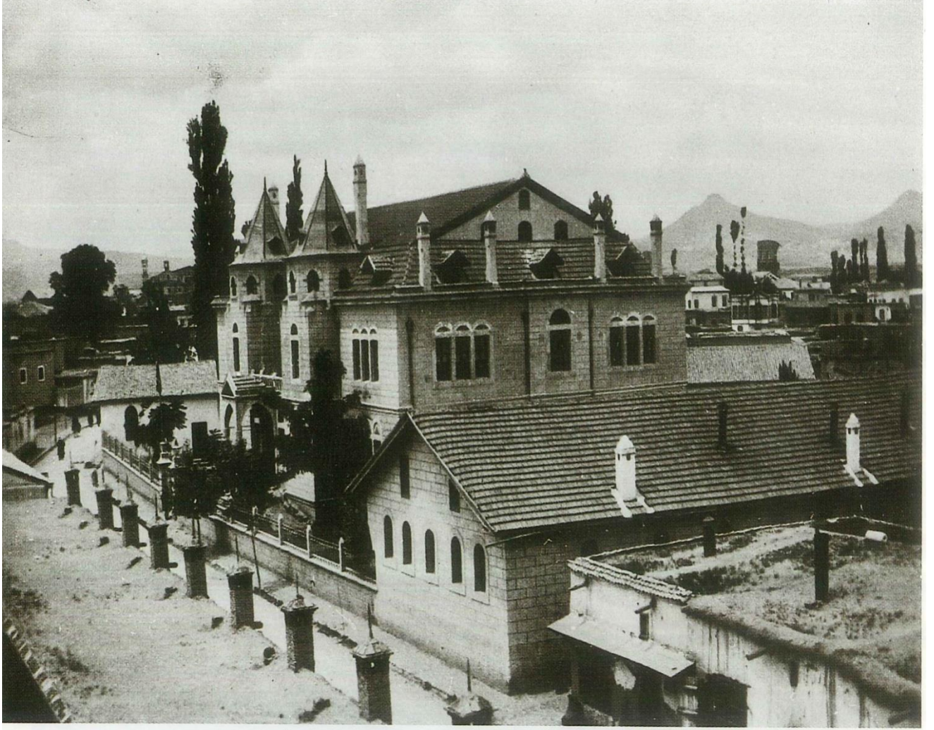
Ek 1: Konya Sanayi Mektebi'nin Bir fotođrafı