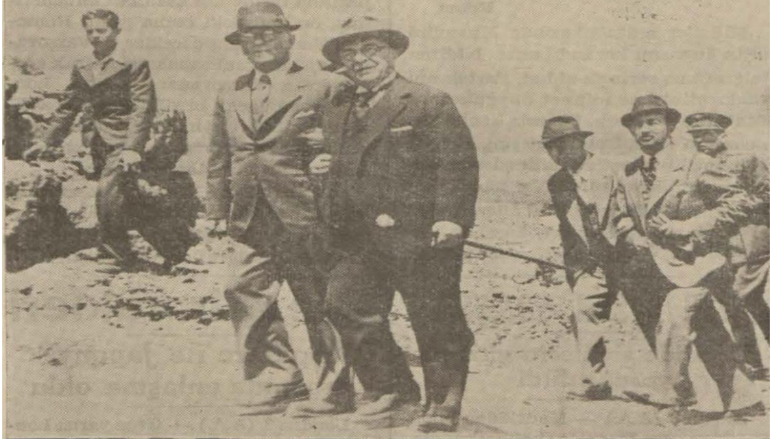
Celal Bayar ve İoannis Metaksas Sunion Burnu'nda (Akşam, 4 Mayıs 1938)

Ertesi günün, yani 29 Nisan'ın ilk etkinliği Sunion Burnu'nda organize edilen öğle yemeğiydi. Celal Bayar, Tevfik Rüştü Aras ve diğerleri Sunion'a geçerek Yunan Hükümeti'nin organize ettiği öğle yemeğinde hazır bulundu. Heyet, yemeği müteakiben Akropol harabelerini, müzeleri ve diğer tarihi mekânları gezdikten sonra Kral Tiyatrosu'ndaki temsile katılarak günü tamamlıyordu (Cumhuriyet, 30.04. 1938).