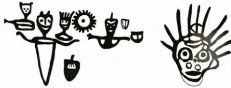
Şekil 1: Güneş sembolü maskeler (Hoppal, 2015).