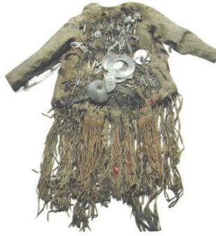
Şekil 3: Yakut Şaman elbisesi (Gürcan, 2018).

Şamanizmin baş aktörü olan Şamanlar, görev tanımları içerisinde yer alan ayin ve törenleri yönetirken pek çok aksesuar, malzeme ve materyal kullanırlar. Şaman maddi kültür ürünleri olarak da adlandırılan bu malzemeler ve bu malzemeler üzerinde yer alan çizimler, Şaman sembollerinin somutlaştığı, biçime dönüştüğü önemli verilerdir. Şamanlar, görevleri gereği farklı ritüellerde kullanılmak üzere özel giysiler ve külahlar giyerler. Bu giysilere Şaman köstümü denilir. Bu kostümlerin hem kendileri hem de üzerinde bulunan materyal ya da resimler Şamanın ayinleri sırasında yapması gereken görevlerin işlevlerine ait semboliklerdir. Bu işlevlerdeki öncelik sırası Şamanın yaptığı ayine göre farklılık gösterebilmektedir.