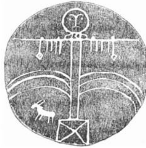
Şekil 4: Şaman davulu (Anohin, 2006).

Öyleyse Şaman kıyafetlerinin hem kendileri hem de kıyafetler üzerinde yer alan semboller, Şamanı yolculuğu esnasında koruyan koruyucu ve hayvan analarla, Şamanın şekil değiştirme işlemi sırasında şekil değiştireceği hayvanlarla, yükselmek için merdiven görevi gören ağaçlarla, kötü ruhları korkutacak gereçlerle donatılmıştır. Böylece bu sembollerin her biri artık bir biçim-anlam olmaktan çıkarak bir işlev alanına girerler.