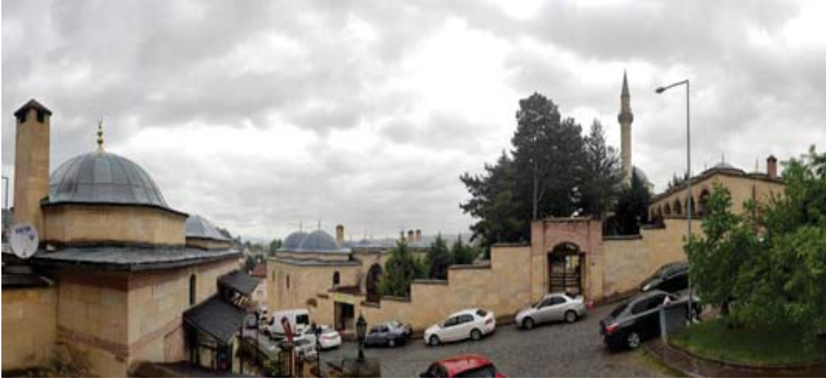
Resim 2: Yakub Ağa Külliyesi (2021)

965 (1558) tarihli vakfiyeye göre külliye cami, medrese ve mektepten oluşmaktadır. Cami ve medresenin bir arada yer aldığı külliye, sıbyan mektebi Kefeli yokuşunda külliyein karşısında (fotoğrafta solda) yer almaktadır. Medresede okutulmak üzere talebelere vakfedilen kitaplar da bulunmaktadır. Mevlana Muhammed Çelebi ibn Hasan Çelebi de vakfın ilk mütevellisi olarak tayin edilmiştir. (TS.MA.d. 6993: 23b).