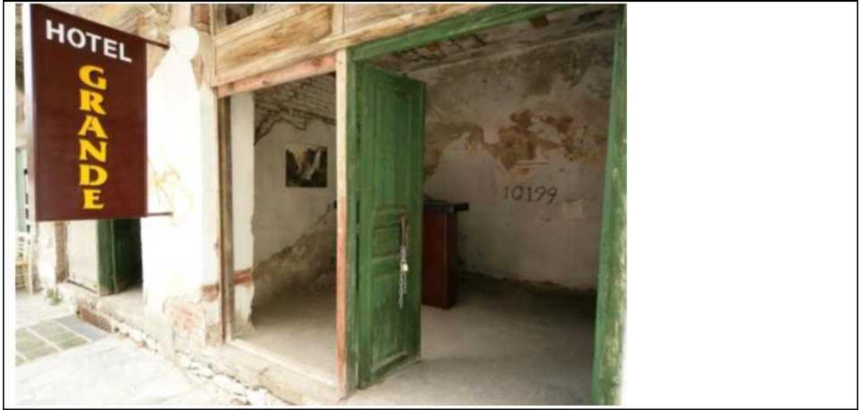
Hotel Grande, Larissa 2005

sadelik ve asgari bir konfor ile ya da ğrenciler tarafından ekilen binlerce fotoęraftan oluřan ve řehre ait grsel bir tur olarak derlemiřtir (Carras, 2005).