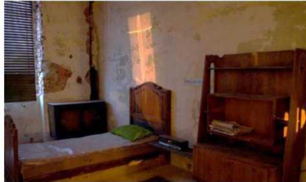
Hotel Isola, İtalya 2012

Papadimitriou, M. 2012. "Hotel Isola" Isolacenter.org. Erişim Tarihi: Mayıs 2021 http://www.isolartcenter.org/index_eng.php?p=n31987204&i=n59788601&z=n96664119