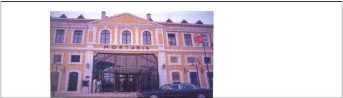
Montania Otel, Bursa

Kamusal alanda sanat yapılarının insanlarla iç içe olması, sanat eserinin toplumsallaşmasını da anlatmaktadır. Bu durum bizlere aynı zamanda çağdaş bir kent tasarımında kent yöneticilerinin sanata desteğini ve sanatçılarla işbirliğinin son derece önemli ve gerekli olduğunu da göstermektedir. Geleceğin kentini bir sanatla şekillendirmek, hem bireylerin refahına önemli katkı sağlayacak hem de toplumsal barış ve dinginlik açısından önemli katkılar sunacaktır. Bu katkı, kamusal alanın sosyal, psikolojik ve estetik değerler de dahil olmak üzere insan ihtiyaçlarını karşılaması durumunda mümkündür. Kent dokusuyla uyumlu, doğayla bütünleşen sanat eserleri, mekanları daha yaşanabilir hale getirirken aynı zamanda insanların duyarlılıklarını, algılarını ve farkındalıklarını geliştirmektedir. Çevreye duyarlılığı gelişmiş olan bireyler, toplumsal duyarlılığının da temel yapı taşlarıdır. Kamusal sanat, kamusal konuları içeren bir sanatsal yaklaşım olması nedeniyle çevre kültürüne eleştirel bakışı da içinde bulundurmaktadır. Eleştirel yaklaşımlar, ortak değerleri paylaşabilmemiz için kendimizi ve çevremizi yeni ve etkileşimli yollarla algılamamızı sağlar. Farklı kültürlerle ve onların var olma haklarına saygı duyan bir diyalog ve ağ oluşturma ortamını teşvik eder.