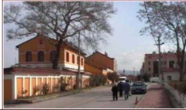
Montania Oteli ve çevresi, Bursa

( http://www.mudanyaonline.net ) 11.05.2021