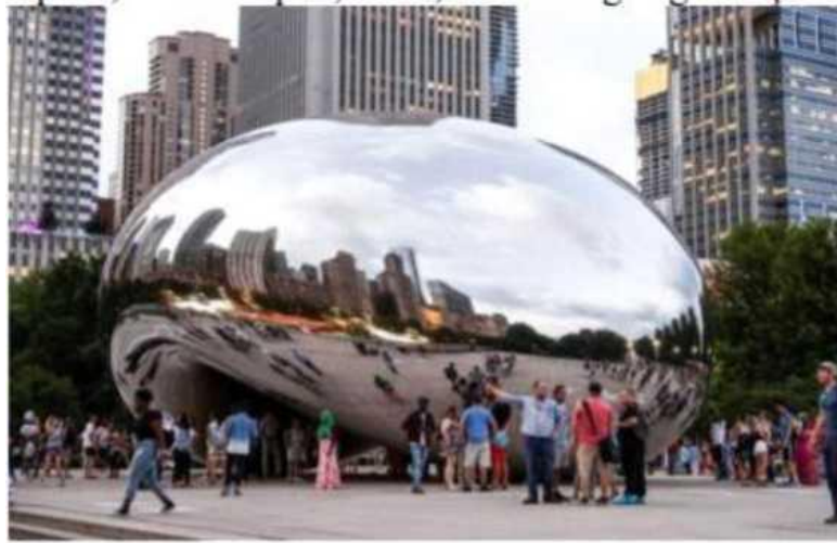
Anish Kapoor, Bulut Kapısı, 2004, 100 ton ağırlığında çelik, Chicago, ABD

Kamusal alanda sanat eserleri ve sanatsal etkinlikler, doğayı sanat aracılığıyla insana yaklaştırmakta ve kenti çelik ve cam kütesi haline gelmiş olan mekanların soğukluğundan kurtarmaktadırlar. Orayı görsel düzenlerle daha etkileyici hale getirmektedir. Buda insanları oraya sürüklemekte olup onları kentin günlük yaşam tarzından farklı olarak onlara zihinsel rahatlama noktaları yaratmaktadır, zıtlıklar ve algısal yanılsamalar ile bireylere şaşırtıcı, merak uyandıran sürprizlerle karşılaşma imkanları sunmaktadır. İşte bu şekilde yapılan sanat faaliyetleri insanları fantastik dünyalarla karşılaştırıp sanatla hiçbir ilgisi olmayan insanların bile günlük hayatta sanatla yada bir sanat eseriyle iletişimini sağlamaktadır.