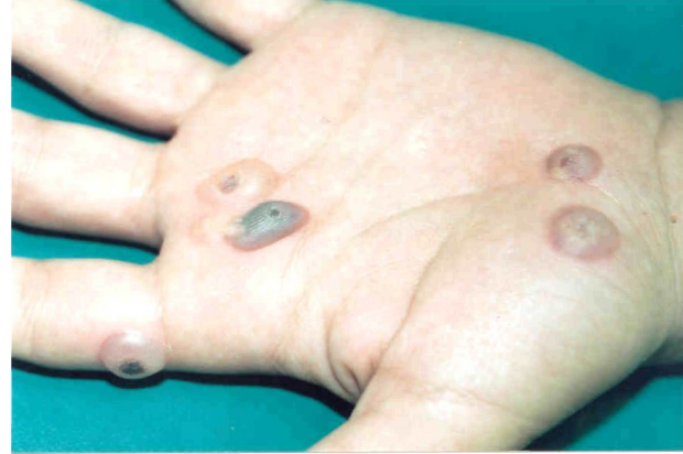
Şekil 2. Kriyoterapiden 24 saat sonra hemorajik büllerin görünümü.

Tedavi sonunda çalışma grubunda üç hastada enfeksiyon gelişti. Bir hastada oral antibiyotik tedavisi gerekli görülürken, diğerleri povidon iyot pansuman ve fusidik asit krem tedavisi ile iyileşti.