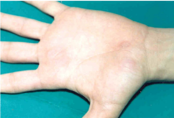
Şekil 3. Kriyoterapiden 4 hafta sonraki görünüm.