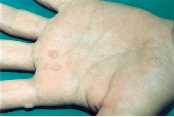
Şekil 1. Kriyoterapi öncesi verrukaların görünümü.

Çalışmamız boyunca, kontrol grubunda 2 hasta, çalışma grubunda 3 hasta ardışık iki tedavi seansına gelmedikleri için çalışma dışında bırakıldı. Çalışma 55 hasta ile tamamlandı. Maksimum beş kez uygulanan tedavi seanslarının sonunda çalışma grubunda 27 hastadan 22 hastada tam tedavi gözlemlendi (%81.5) (Şekil 1-3). Buna karşılık kontrol grubunda bu sayı 11 (%39.3) olarak tespit edildi. Çalışma grubunda iyileşme oranı kontrol grubuna göre istatistiksel olarak anlamlı düzeyde daha yüksek bulundu ( p<0.001 ) (Şekil 4).