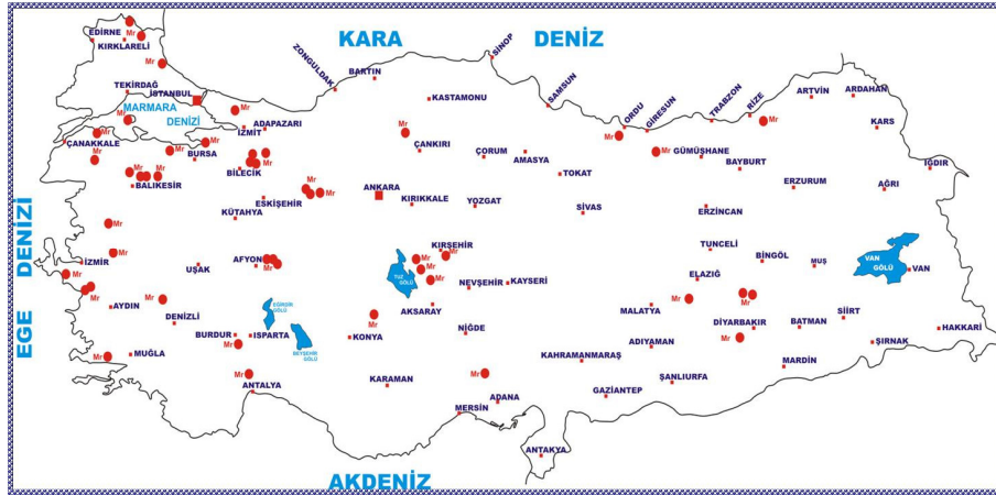
Şekil 1: Türkiye'nin Önemli Mermer Yatakları Haritası (TÜMMER, 2006b)

Aşağıdaki Şekil 1'de de görüldüğü gibi, Marmara ve Ege Bölgeleri başta olmak üzere, Trakya'dan Doğu Anadolu'ya kadar hemen tüm coğrafi bölgelerde, kaliteli ve ekonomik değeri yüksek nitelikte mermer rezervlerine rastlanmaktadır. Son yıllarda ülkemizde üretilen mermer renk ve türlerinde de artışlar meydana gelmiş ve daha önce birkaç bölgemizle sınırlı olan mermer ocak işletmeciliği Türkiye'nin birçok yöresine yayılmıştır. Yeni açılan mermer ocaklarının Batı Anadolu'da yer alan büyük sayıda olanları antik ocakların kapatılmasıyla ve işletilmesiyle faaliyete geçirilmiştir. Bu ocaklardan bir bölümü ekonomik yönden değerli hale girmiş, diğer yandan, birçok ocak ise belirli bir yatırımın ardından ekonomik olmamaları veya üretilen taşın kalitesinin uygun olmaması yönünden terk edilmiştir. Aynı dönem içerisinde Doğu ve Güneydoğu Anadolu Bölgelerinde yeni birçok mermer ocağı ilk kez bulunmuş ve faaliyete geçmiştir (Erdoğan ve Yavuz, 2002: 54; 2003).