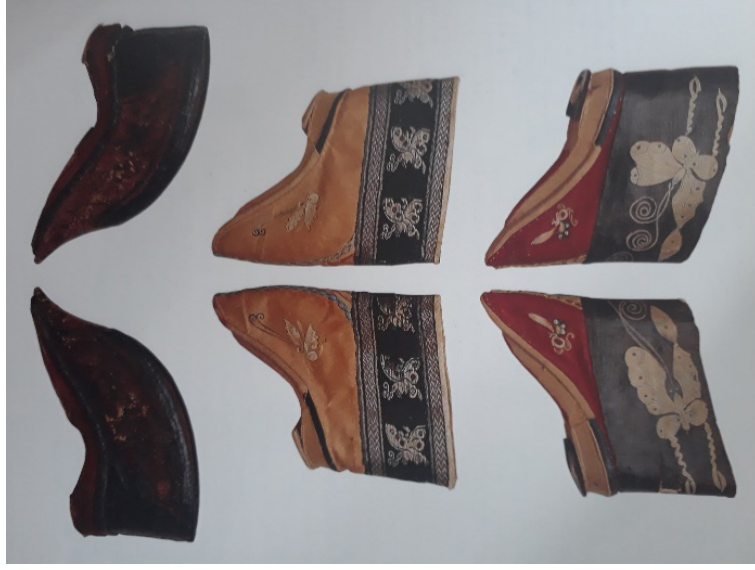
Resim 10: Yağmurlu havada kullanılan Lotus ayakkabı