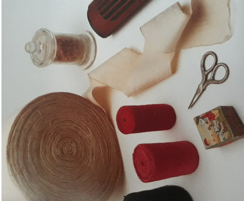
Resim 3: Ayak bağlamada kullanılan aletler