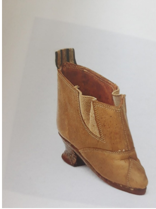
Resim 18: Deri Lotus bot 20.yüzyıl

Çağın ve teknolojinin gelişimi ile ayak bağlama uygulaması kültürel bir öge olarak kalırken, 2005 yılında Jo Farrel isimli fotoğrafçı bir proje ile Çin’de Lotus ayaklı kadınların hayatta olanları ile görüşerek fotoğraflamış ve röportaj yapmıştır (Resim 18). 50 kadın ile yaptığı görüşmede bazı kadınların ayak bağlama işlemi sonucunda engelli oldukları, yürüyemediklerini görmüştür. Bazı kadınların ise ayaklarının istenilen ölçüye erişemediği durumlarda yeniden ayak kemiklerini kırdıklarını bunun sonucunda ise hayatını kaybeden çok kadın olduğunu belirtmişlerdir ( https://www.theguardian.com ). Shandong ve Yunnan eyaletlerinde yaşayan ve ayak bağlama geleneğinin yaşayan son örnekleri olan kadınlar genel olarak bu acıya sosyal statülerinde olacak değişim için katlandıklarını ifade etmişlerdir. Tarlada veya tekstil atölyelerinde çalışmak istemeyen Çinli genç kızlar lotus ayak için bu işlemi yapmış ve sonucunda istenilen ölçüye gelmeyen ve deforme olan ayakları ile tarlalarda çalışmak zorunda kalmışlardır (Farrel,2018,s.15).