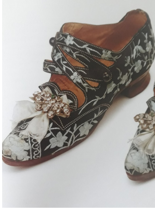
Resim 17: Batı tarzı “Mary Jane” ayakkabının Lotus formu

Bu değişim ile beraber, Lotus ayakkabı formunda, işçiliğinde, kullanılan malzemelerde ve dikim tekniklerinde gelişmeler ortaya çıkmıştır. Lotus ayakkabıda moda anlayışı kadınlar arasında yerleşmeye başlamıştır. Geleneksel ayakkabı formunu batı tarzı ayakkabılardan etkilenerek geliştirmişlerdir. Birçok kadının bozuk ayak formu olmasına rağmen ayaklarında batılı anlamda yeni tip Lotus ayakkabı görülmüştür. Sadece kumaş üzeri işleme yapılarak elde yapılan Lotus ayakkabıda artık deri ve ökçe kullanılmaya başlanmıştır. Bu yeni formdaki ayakkabılar yapılırken geleneksel ayakkabının formuna sadık kalınmış ama batılı anlamda form verilmiştir. En çok kullanılan model ise “Mary Jane” adı verilen ayakkabının üst kısmında bantları olan Lotus ayakkabıdır (Resim 17). Lotus ayakkabı formu modernize edilmiş deri Lotus bot, ökçeli olarak üretilmiştir ve form Chelsea bota benzemektedir (Resim18). Ayakkabılarda dikkat çeken en büyük yenilik ise geleneksel ayakkabıda olan işlemlerin artık azalmış olduğu ve tasarım yönünden güçlenmesidir. Lotus ayakkabının geleneksel yapısını bozmadan, fizyolojik olarak normal ayak formuna sahip kadınların ve ayak bağı olan kadınların modernize edilerek yeniden tasarlanmış Lotus ayakkabıyı giyebilmeleri Çinli kadınlar arasında yeni bir çağın başlangıcı olarak tarihe geçmiştir.