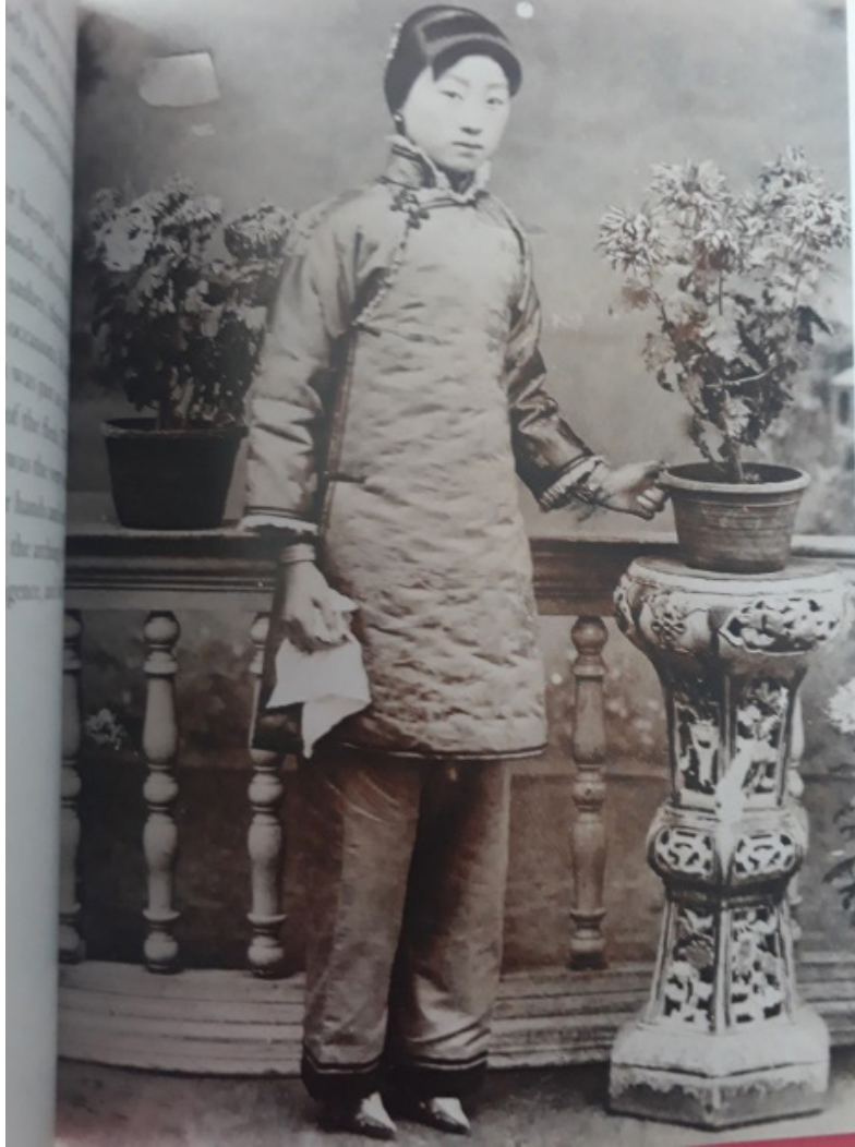
Resim 1: Geç Qing Dönemi (1909-1911), Lotus giyen genç kız.

nilüfer çiçeklerinin görüntüsü ile özdeşleşmiştir (Al-Akl, 1932, s.545). Kadının söz hakkının olmadığı, kadının ezilmişliğinin ve erkek hâkimiyetinin göstergesi haline gelen bu uygulama Çin toplumunun tarihsel olarak ataerkil güç ilkesi üzerine yapılandığını da göstermektedir. Bu nedenle Çin toplumunda, kadın bedeni, ideolojinin, gücün, sosyal yapıların ve kültürel sistemin içerisinde ahlakın, aileye saygının ve sosyal konumun en önemli belirteci olmuştur (Hong, 1997, s.47). İnsan bedenine acı veren ve anatomik yapısını bozan bu uygulama, Konfüçyus'un ahlaki değerlerin olgunlaşmasının bedensel acı ile oluşacağı felsefesinin etkisi altında gelişmiştir (Blake, 1994, s. 31).