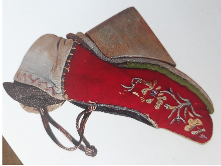
Resim 7: Ahşap ökçeli Lotus ayakkabı