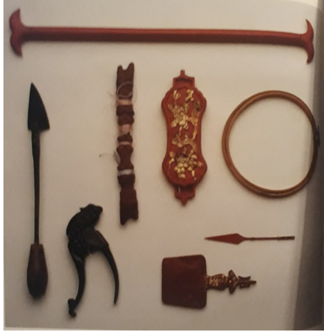
Resim 12: Lotus Ayakkabı için kullanılan aletler

Lotus ayakkabı başlangıçta ayak tabanına uyum sağlaması için tabanı düz olarak yapılmıştır. Zaman içerisinde farklı modeller yapılmış, ökçe ilave edildiğinde ise ayağı kavraması ve duruşunu dengede tutabilmesi için, ayakkabının sağ ve solunun ayırt edilmesine kolaylık sağlayacak tahta kalıplar kullanılmıştır (Resim 13). Ökçe ilave edilen ilk modeller yetişkin kadınların ve Lotus ayakkabı giyme konusunda deneyim sahibi olup ayakta dengede durabilmeleri için kullanılmıştır (Resim 14).