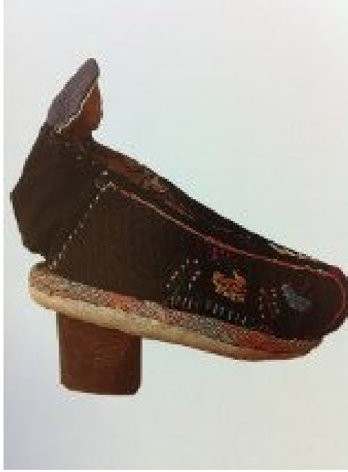
Resim 14: Ayak bağlama sonrasında kullanılan ilk Lotus Ayakkabı

Ökçenin ayakkabıya ilave edilmesiyle Lotus ayakkabıda değişim başlamış ökçeye uyumlu formlar oluşmaya başlamıştır. Shaoxing bölgesine ait ayakkabının ökçesi saya kumaşı ile kaplanmış ve işleme yapılmıştır. Böylece kumaş kaplı olan ökçeler sayadaki desenleri kullanarak bütünlük oluşturmuştur (Resim 15). Taiwan stili ayakkabıların özelliği ise pamuk kumaş kullanılarak elde yapılıp, ökçenin alt kısmının işlemeli olmasıdır (Resim 16). Lotus ayakkabın formlarında, kullanılan kumaş kalitelerinde gelişim ve değişimler olurken dünyada sosyal, kültürel ve gelenekler konusunda da değişimler başlamıştır.