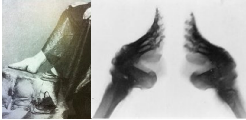
Resim 4: Ayak bağlama sonrası görünüm ve kemik yapısındaki değişim