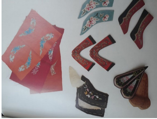
Resim 8: Lotus ayakkabı için nakışlı saya

Ayrıca, karda, yağmurda veya doğada yürümek için yapılmış Lotus ayakkabılarda üretilmiş ve dayanıklılığı arttıracak özellikler eklenmiştir. Lotus ayakkabıya su geçirmesini önlemek için balık yağı sürülmüştür (Resim 10). Karda yürümek için tasarlanmış taban kısmına yürümeyi kolaylaştırmak ve ayakkabının yıpranmasını önlemek için takılıp çıkabilen koruyucu parça yapılmıştır (Resim 11). Tüm bu ayakkabıların yapımında basit ve fonksiyonel aletler kullanılmıştır. Bu aletlere tarihsel açıdan bakıldığında ilk dönemlerden itibaren kullanılan aletlerde değişiklik olmadığı görülmüştür (Resim 12).