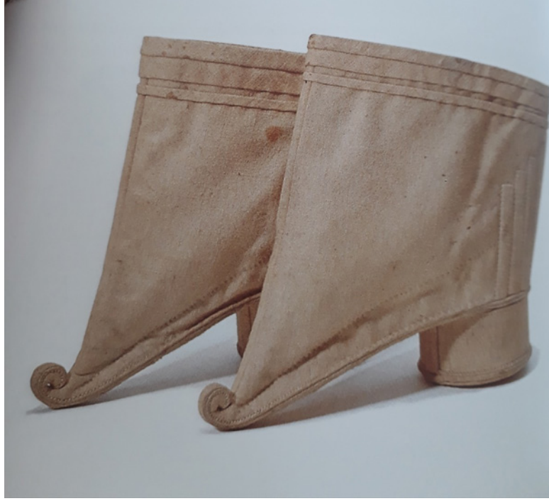
Resim 6: Yas döneminde kullanılan Lotus bot

Gelişen süreç içerisinde toplumun tüm katmanlarındaki kadınlar için vazgeçilmez olan ayak bağlama artık saygınlık, zenginlik, bedensel güzellik ve duygusallığın sembolü haline gelen, küçük ayaklı olmak evlilik ve eş bulmak için toplumun temel taşı olmuştur. Ayak bağlama uygulaması ile kadınların sosyal yaşam içerisinde hareketleri kısıtlanmış, eve bağımlı kalmışlardır. Erkekler için kadının evde olması ise sadakatin ve güzel görünmenin özelliği olarak benimsenmiştir (Levy, 1978, s.75). Küçük ayak ölçüsü kadının evlilik zamanı geldiğinde önemli bir durum olduğundan, istenilen ölçüde olmayan ayakların parmaklarını tekrar kırarak küçülmesini sağlamaya çalışan genç kızların bazılarının ömür boyu yürüyemez durumda kaldıkları veya yaşamlarını kaybettikleri görülmüştür. Ayak taban uzunluğu üç inçten fazla olan kadınlar, ayakları daha küçük görünsün diye Lotus ayakkabıya ökçe ilave etmişlerdir. Ökçeli Lotus ayakkabı daha çok Mançu'lu kadınlar arasında yaygın kullanılmıştır (Resim 7). Bu ayakkabı ayak lotus formunu aldığı anda ayağı alıştırmak için giyilen ilk ayakkabı modelidir.