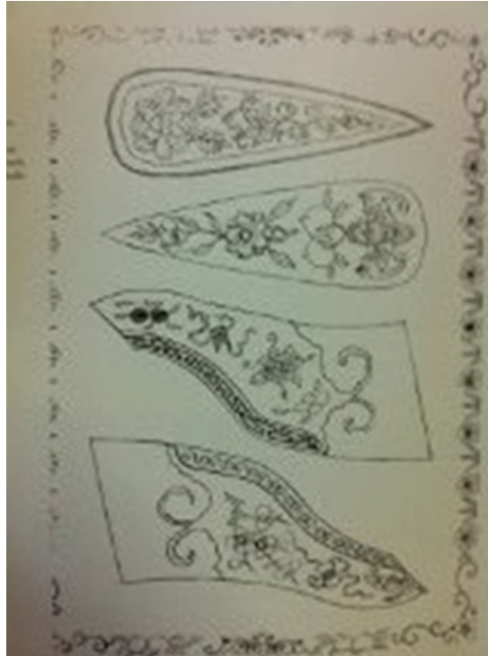
Resim 9: Lotus Ayakkabıda kullanılan örnek desen ve kesilmiş kumaşlar

Ayrıca, karda, yağmurda veya doğada yürümek için yapılmış Lotus ayakkabılarda üretilmiş ve dayanıklılığı arttıracak özellikler eklenmiştir. Lotus ayakkabıya su geçirmesini önlemek için balık yağı sürülmüştür (Resim 10). Karda yürümek için tasarlanmış taban kısmına yürümeyi kolaylaştırmak ve ayakkabının yıpranmasını önlemek için takılıp çıkabilen koruyucu parça yapılmıştır (Resim 11). Tüm bu ayakkabıların yapımında basit ve fonksiyonel aletler kullanılmıştır. Bu aletlere tarihsel açıdan bakıldığında ilk dönemlerden itibaren kullanılan aletlerde değişiklik olmadığı görülmüştür (Resim 12).