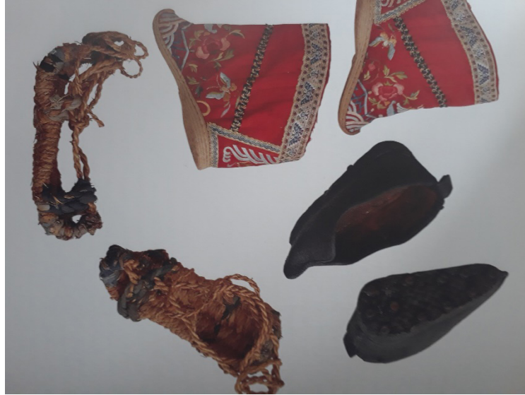
Resim 11: Karda yürümek için yapılan Lotus ayakkabı