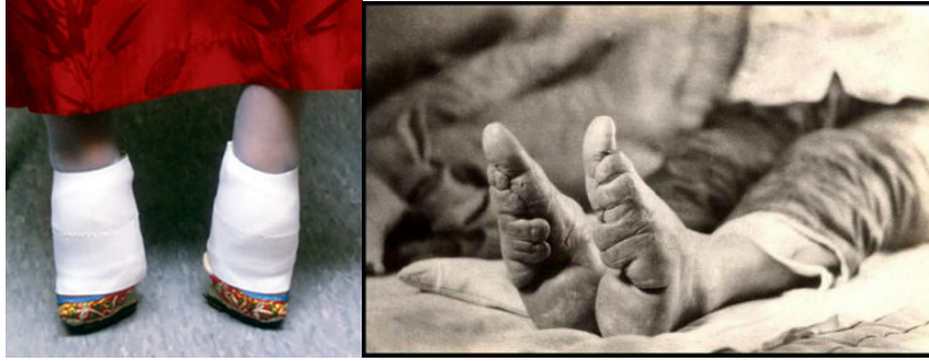
Resim 5: Lotus Ayak formu