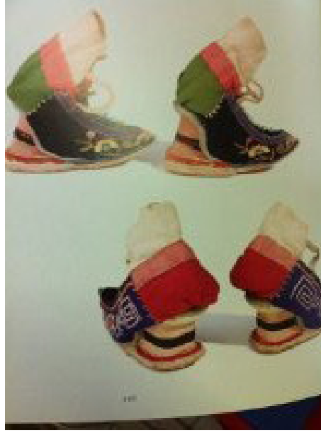
Resim 16: Taiwan stili Lotus Ayakkabı, pamuk