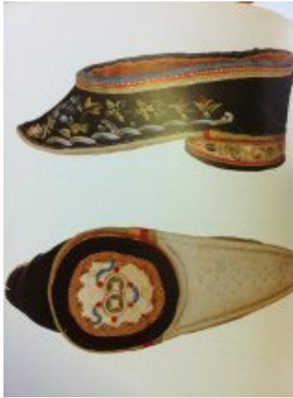
Resim 15: Shaoxing stili Lotus Ayakkabı, pamuk saten

Ökçenin ayakkabıya ilave edilmesiyle Lotus ayakkabıda değişim başlamış ökçeye uyumlu formlar oluşmaya başlamıştır. Shaoxing bölgesine ait ayakkabının ökçesi saya kumaşı ile kaplanmış ve işleme yapılmıştır. Böylece kumaş kaplı olan ökçeler sayadaki desenleri kullanarak bütünlük oluşturmuştur (Resim 15). Taiwan stili ayakkabıların özelliği ise pamuk kumaş kullanılarak elde yapılıp, ökçenin alt kısmının işlemeli olmasıdır (Resim 16). Lotus ayakkabın formlarında, kullanılan kumaş kalitelerinde gelişim ve değişimler olurken dünyada sosyal, kültürel ve gelenekler konusunda da değişimler başlamıştır.