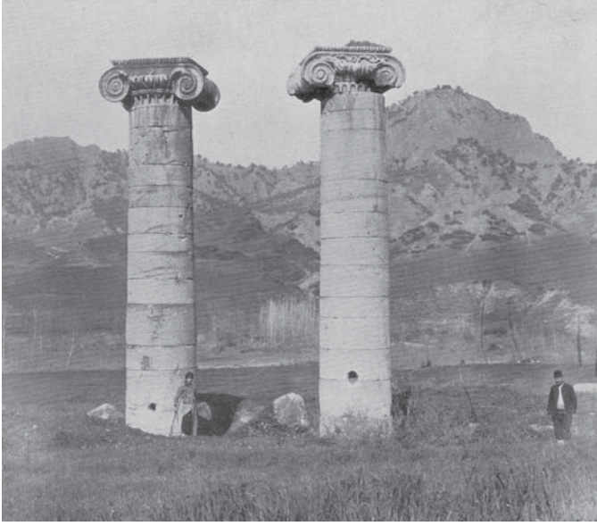
Levha 5: Sardes, Artemis Tapınağı, 7 ve 6 no'lu Sütunlar, 1909'da kazı başlamadan önceki durum, Batı'ya Bakış.