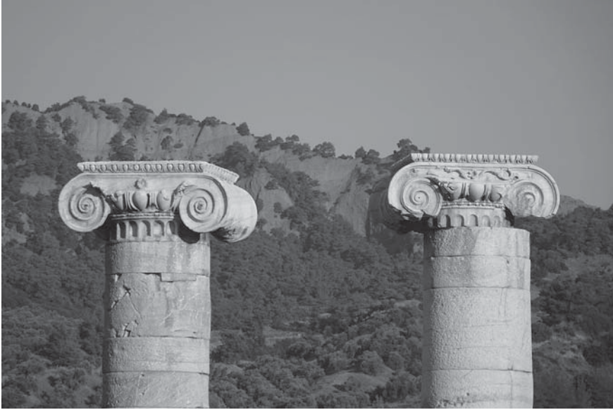
Levha 7: Sardes, Artemis Tapınađı, 7 (solda) ve 6 (sađda) no'u Sütunların Tařıdıđı İonik Başlıkların Detayı, Batı'ya Bakıř (Yegül).