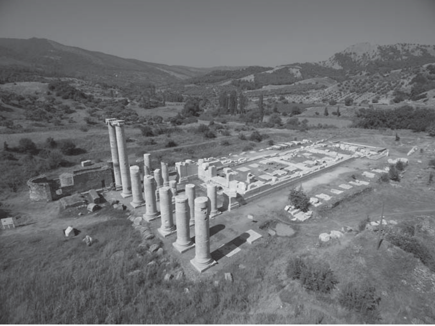
Levha 1: SGüneybatı'ya bakış, solda sütunların dibinde 'M' kilisesi görünüyor.