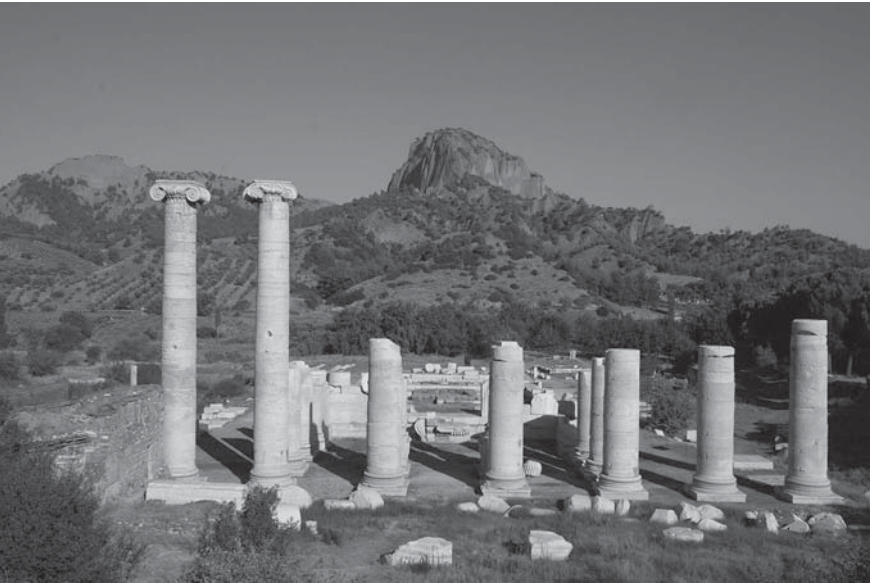
Levha 2: Sardes Artemis Tapınağı Doğu Peristili Genel Görünüşü, arkada "nekropol" denilen dağ, Batı'ya Bakış (Yegül).