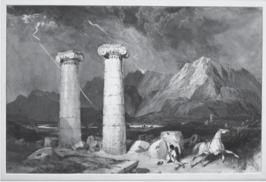
Levha 3: Clarkson F. Stanfield, "Sardes'de (Asya'nın) Yedi Kilisesinden Birisi" [Artemis Tapınađı, 7 ve 6 no'lu Sütunlar, Batı'ya Bakış], suluboya, ca. 1834-1835. Victoria ve Albert Müzesi, Londra, SD 1000.