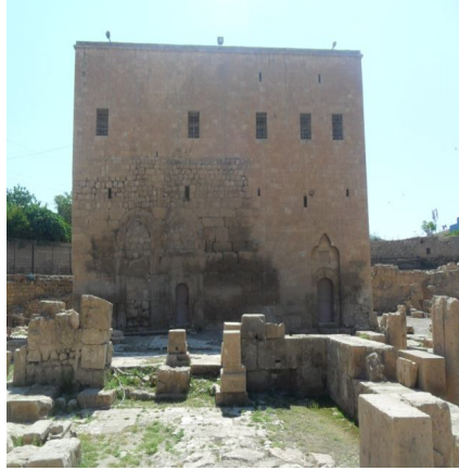
Resim 2: Aziz Yakub Kilisesi (Nusaybin)