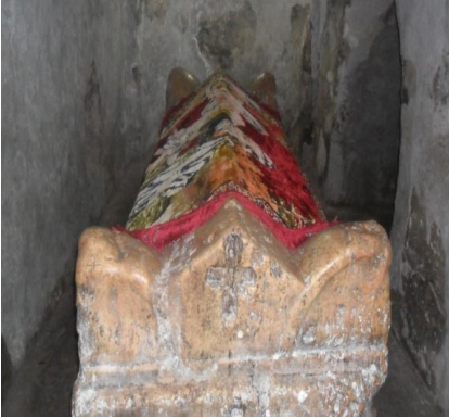
Resim 3: Aziz Yakub'un Mezarı (Kilise içi)