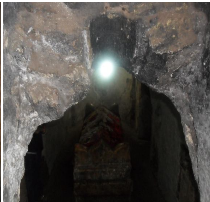
Resim 6: Aziz Yakub Mezarı (Kilise içi)