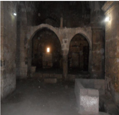
Resim 5: Aziz Yakub Kilisesi (iç Kısım)