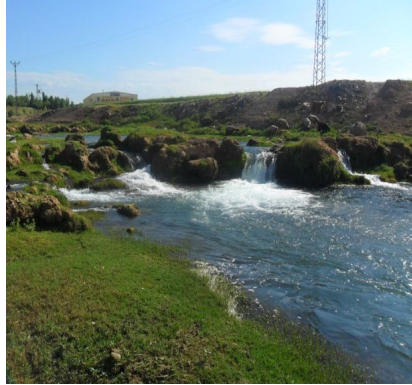
Resim 4: Mygdonius (Hirmas-Çağçağ) Nehri (Nusaybin)