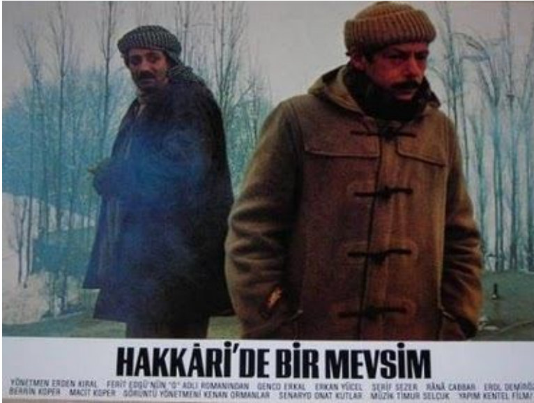
Wêneya 3. (afişê film)

Di destpêka film de, yek di rêçikeke di nav berfê de dixuye, weke ku ji xeybê bê. Di dest û ser mil de du çente hene. Leheng li aliyekî dinihêre, kamîra jî. Em gundekî dibînin ku di nav berfê de ye. Dengê bahozê her diçe bilind dibe. Bi dengê bahozê re dengê coniyekî jî tê ku monoton e. Leheng ber bi nav malan ve dimeşe. Gundî li ser banan li wî temaşe dikin. Kûçikek dide pêşiya wî û direyê. Di hin şibakan de hin serî dixuyîn û wenda dibin. Em têdigihên ku jiyaneke monoton e; leheng dikeve nav jiyaneke monoton. Lê bi xwe re, bi simbolîzasyona du çenteyî cîhana modern jî tîne. Ew ne ayîde vê deverê ye, lê dê vê deverê biguherîne. Keya tê pêşwaziya wî. Li hevûdu dinihêrin, leheng dikeve nav fikaran ka wê çi lê bike. Lê keya, ku em hêj nizanin keya ye, radije çenteyê wî yê mezin û bêyî gotinekê dide pêşiya wî.