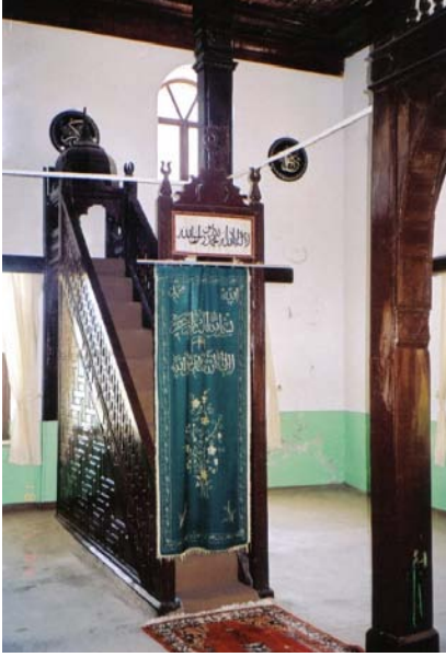
Resim 5- Mahmûd Seydî Câmii, Minber