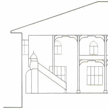
Çizim 2- Alanya Mahmud Seydi Köyü