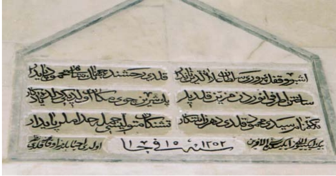
Resim 1- Mahmûd Seydî Câmii, Tamir Kitabesi