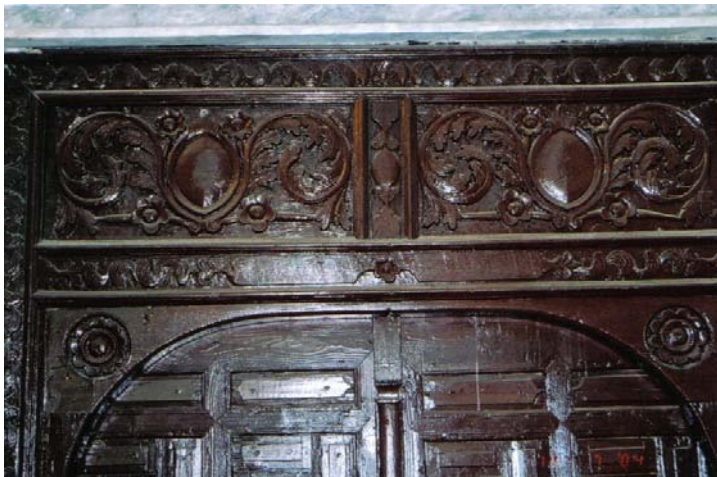
Resim 3- Mahmûd Seydî Câmii, Giriş Kapısından Detay