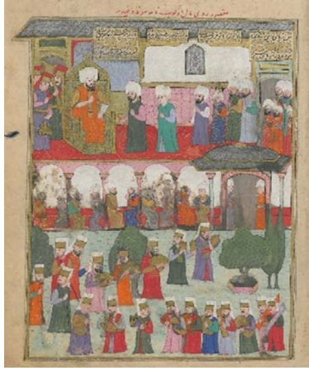
Resim 2: Safevi elçisi Maksud'un Sultan huzuruna kabulü - Şehinşâhnâme II , TSMK, B.200, 1001/1592-3, 29a.