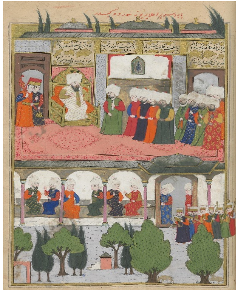
Resim 7: Fas elçisinin Sultan huzuruna kabulü - Şehinşâhnâme II , TSMK, B.200, 1001/1592-3, 143a.