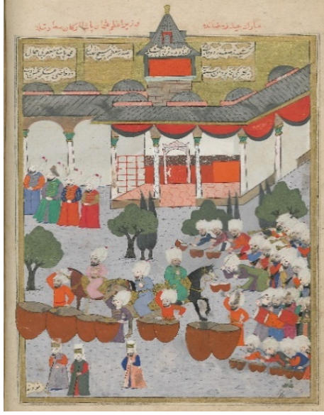
Resim 10: III. Murad ile erkân-ı saadetin bayramlaşması - Şehinşâhnâme II , TSMK, B.200, 1001/1592-3, 159b. (T.C. Cumhurbaşkanlığı, Milli Saraylar İdaresi Başkanlığına aittir).