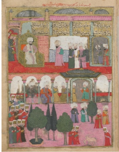
Resim 4: Acem seferinden dönen Serdar Paşa'nın Sultan huzuruna kabulü - Şehinşâhnâme II , TSMK, B.200, 1001/1592-3, 32a. (T.C. Cumhurbaşkanlığı, Milli Saraylar İdaresi Başkanlığına aittir).