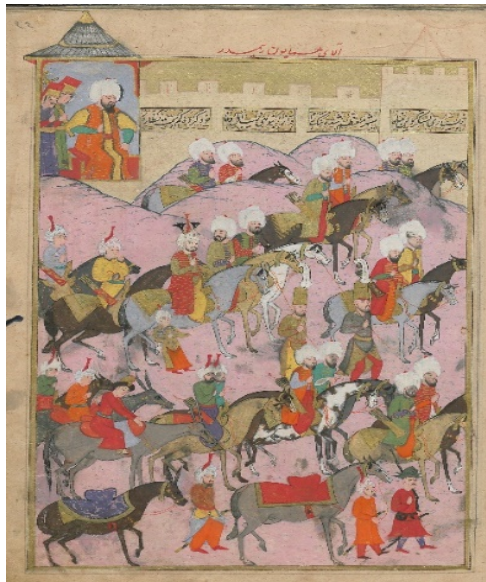
Resim 5: Acem elçisi ve erkânının Alay Köşkü'nden seyri - Şehinşâhnâme II , TSMK, B.200, 1001/1592-3, 34a.