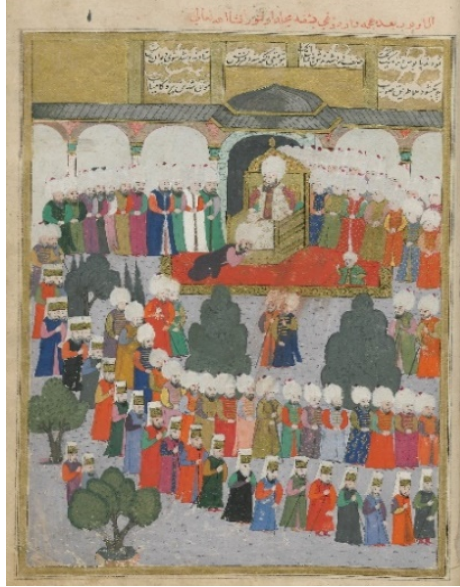
Resim 11: III. Murad ile erkân-ı saadetin bayramlaşması - Şehinşâhnâme II , TSMK, B.200, 1001/1592-3, 160a. (T.C. Cumhurbaşkanlığı, Milli Saraylar İdaresi Başkanlığına aittir).