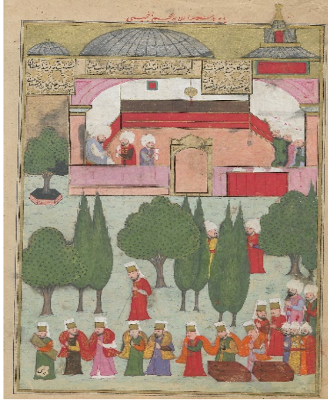
Resim 1: Safevi elçisi Maksud'un Sultan'inhuzuruna kabulü - Şehinşâhnâme II , TSMK, B.200, 1001/1592-3, 28b. (T.C. Cumhurbaşkanlığı, Milli Saraylar İdaresi Başkanlığına aittir).