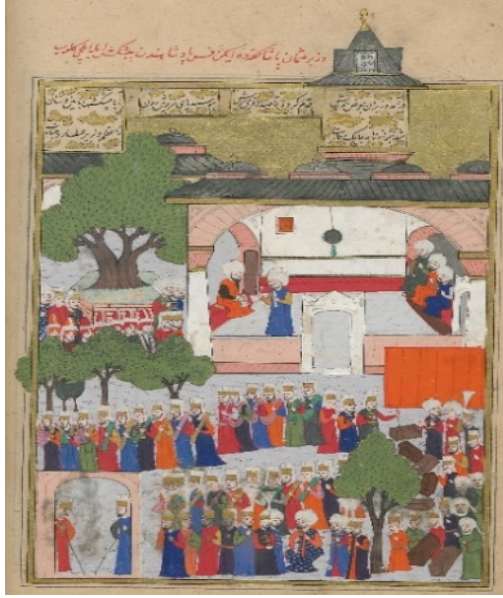
Resim 6: Fas elçisinin Sultan huzuruna kabulü - Şehinşâhnâme II , TSMK, B.200, 1001/1592-3, 142b. (T.C. Cumhurbaşkanlığı, Milli Saraylar İdaresi Başkanlığına aittir).