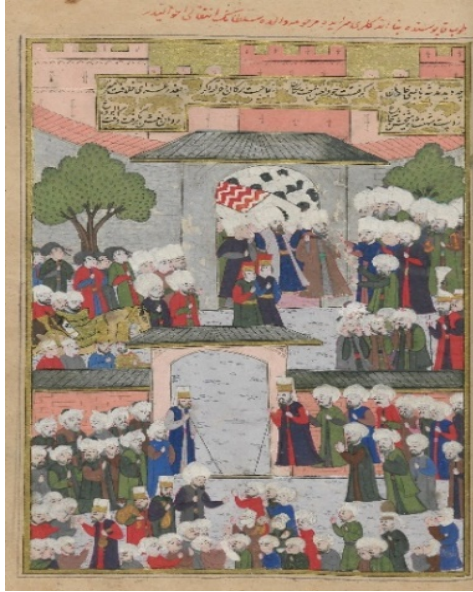
Resim 8: Nurbanu Sultan'ın naaşının Topkapı Sarayı'ndan çıkarılması - Şehinşâhnâme II, TSMK, B.200, 1001/1592-3, 146a.