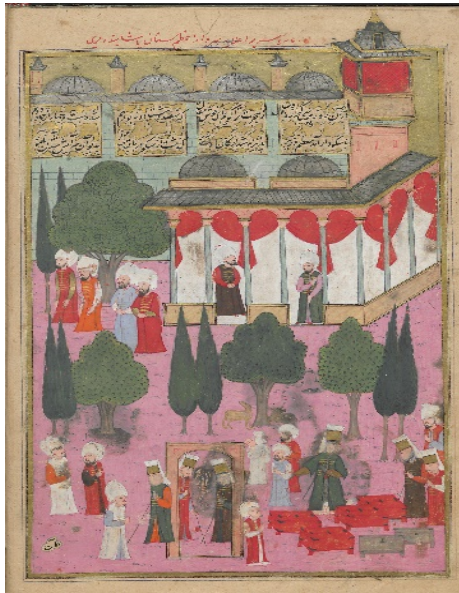
Resim 3: Acem seferinden dönen Serdar Paşa'nın Sultan huzuruna kabulü - Şehinşâhnâme II , TSMK, B.200, 1001/1592-3, 31b. (T.C. Cumhurbaşkanlığı, Milli Saraylar İdaresi Başkanlığına aittir).