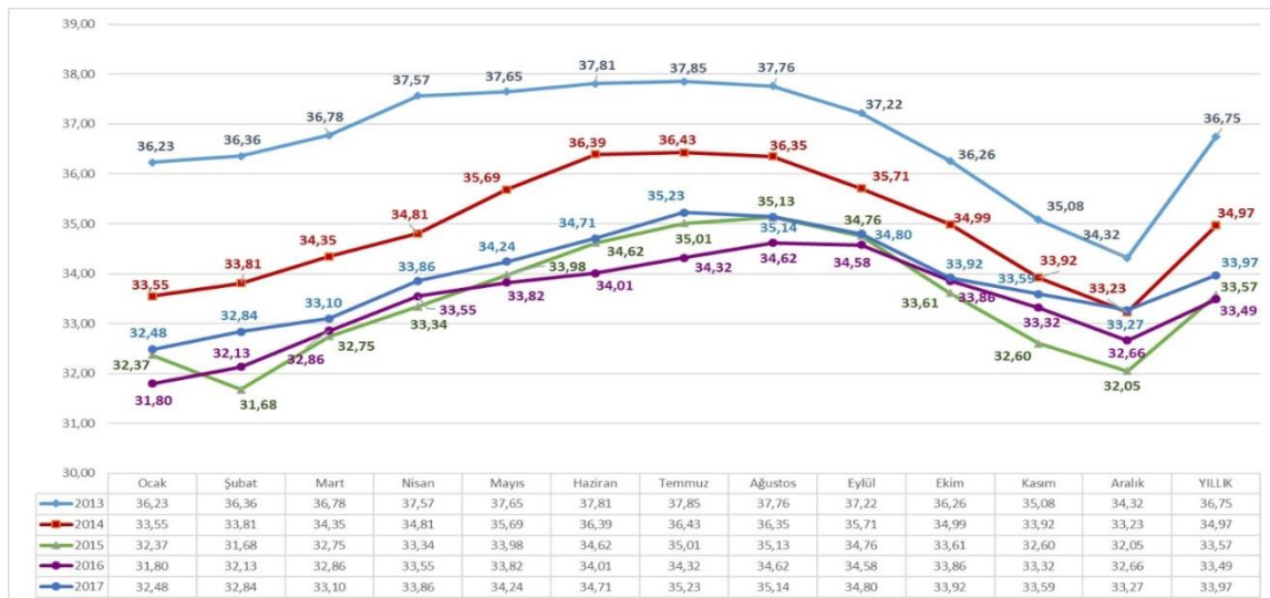
Şekil 2: Türkiye’de Yıllara ve Aylara Göre Kayıt Dışı İstihdam Oranları (2013-2017)