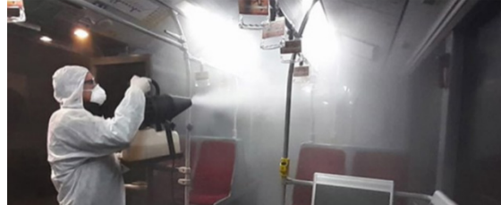
Şekil 2. 'Alınan Önlemler' Kategorisine Örnek ( birgun.net/ 29.02.2020)

'Dünyada son durum, karantina uygulaması, Türkiye'de mevcut durum' kategorilerinde yayımlanan haber sayısı toplam haber sayısının %5,27'sine denk olup eşit bir dağılım sergilediği görülmektedir. Haberlerin %3,16'sı 'DSÖ açıklamaları' kategorisinde, %2,74'ü 'Eğitim' kategorisinde paylaşılmıştır. 'Seyahat yasağı ve sokağa çıkma yasağı' kategorisinde yayımlanan haberlerin sayısı toplam haber sayısının %2,10'una denk olup eşit dağılım sergilediği görülmektedir. Haberlerin %1,89'u 'Uyulması gereken kurallar' kategorisinde, %1,68'inin 'TTB açıklamaları' kategorisinde, %1,47'sinin 'toplantı haberleri' başlığı altında yer aldığı incelenmiştir.