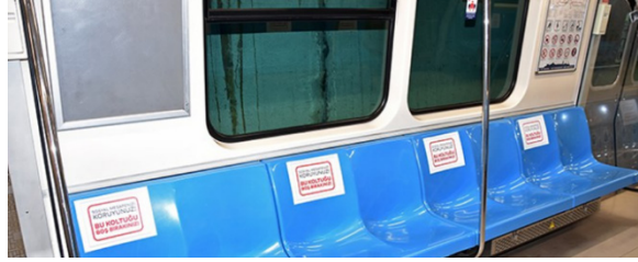
Şekil 6. 'Sosyal Mesafe' Kategorisine Örnek

Birgün gazetesinin yayımladığı haberlerin %0,76'sının 'mülteci, sığınmacı haberleri', %0,72'sinin 'DSÖ açıklamaları', %0,68'inin 'milli dayanışma kampanyası', %0,64'ünün 'kadın haberleri', %0,38'inin 'aşı gelişmeleri', %0,22'sinin 'turizm' kategorisinde yer aldığı gözlemlenmektedir.