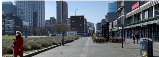
Şekil 5. 'İndirim, Destek, Yardım' Kategorisine Örnek (birgün.net/10.04.2020)

Birgün gazetesinin paylaştığı haberlerin %3,53'ünün 'çalışma hayatı', %3,46'sının 'sokağa çıkma yasağı', %2,96'sının 'eğitim', %2,69'unun 'seyahat yasağı', %2,54'ünün 'maske-dezenfektan-kolonya haberleri', %2,47'inin 'test uygulamaları' kategorisinde paylaşıldığı görülmektedir. Diğer haberlere bakıldığında ise %1,93'ünün 'sosyal mesafe kuralları', %1,44'ünün 'toplantı haberleri' kategorisinde yer aldığı görülmektedir. 'TTB açıklamaları ve infaz paketi haberleri' kategorisinde yer alan haberlerin oranı toplam haber oranının %0,98'ine denk olup eşit bir dağılım göstermektedir.