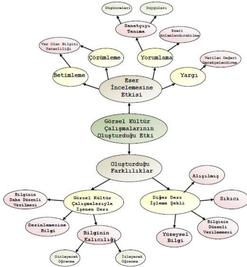
Şekil 2. Görsel kültür çalışmalarının oluşturduğu etki (Figure 2. The effect of visual culture studies)