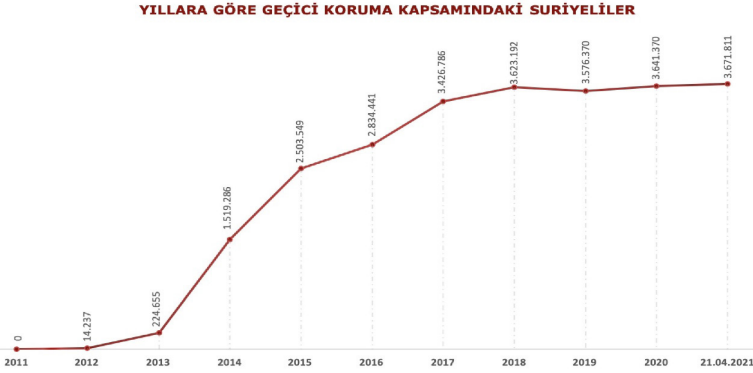
Grafik 1: Yıllara Göre Geçici Koruma Kapsamındaki Suriyeliler 5

Göç olgusu, muhtevası gereği fiziksel anlamda bir yer değişiminden daha fazla mana barındırmaktadır. Göç olgusu üzerine yapılan çalışmalardan da rahatlıkla anlaşılacağı üzere, göçle beraber göç edilen, başka bir ifadeyle göçmenlere ev sahipliği yapan ülkede demografik değişimler, dini ve etnik çatışmalar, ötekileştirme, toplumsal uyum, işsizlik, refah bölüşümü gibi çeşitli sosyal ve ekonomik problemler ortaya çıkmaktadır. Temelde insan hareketliliği olan göç olgusu, güvenlik ile ilgili bir mesele olmaktan ziyade bir yönetim meselesidir (Sağiroğlu, 2015, s. 19).