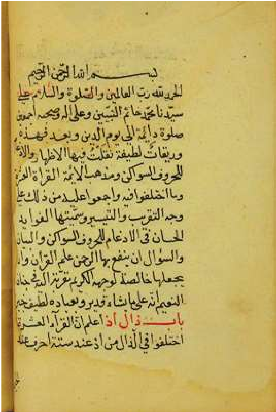
Kastamonu İl Halk Ktp, nr.2123, vr.1 a , İlk Sayfa