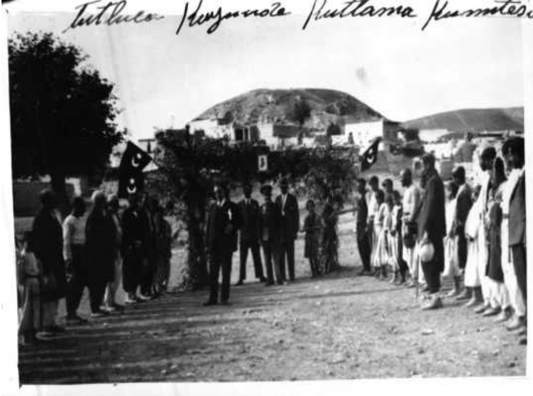
Urfa Köylerinde Cumhuriyet Bayramı Kutlamaları

19- Bayram günlerinde, merasim yerlerinde, halk kürsüsü başlarında balo esnasında emniyeti temimin için Emniyet müdürlüğüyle Jandarma kumandanlığı tertibat alacaklardır" (Urfa, S. 8, 28 Birinci Teşrin 1936).