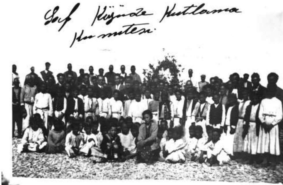
Urfa Köylerinde Cumhuriyet Bayramı Kutlamaları