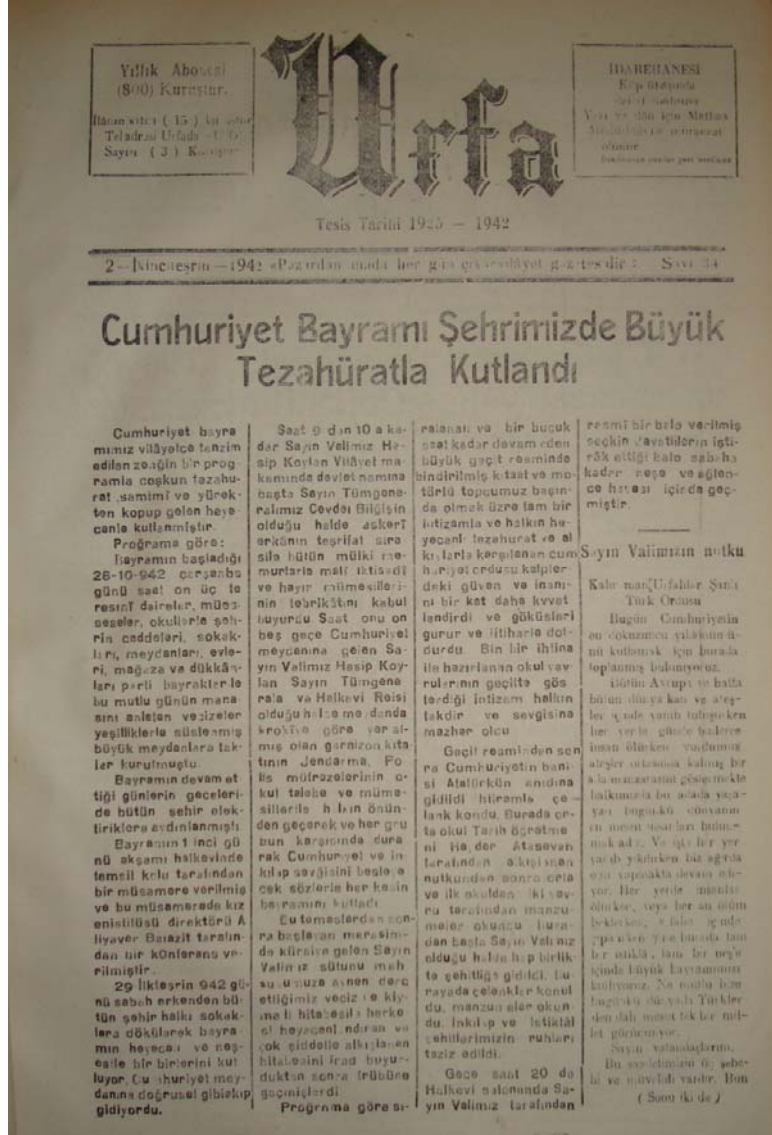
Urfa, S.34, 2 İkinci Teşrin 1942

sağlayan milli mücadele tarihimize tesirli ve mühim bir mevki işgal ettiğini belirtmiş ve yurdu ve şerefi için çalışmış olan asil ruhlu kahraman Urfaluların Valisi olduğundan dolayı gurur ve şerefi ifade etmiştir. Hitabe, Cumhuriyete, Edebi ve Milli Şeflerimize halkın sevgi ve bağlılık tezahüratı ve şiddetli alkışlarıyla sona ermiştir." (Işık, S. 1063, 31 Birinci Teşrin 1942).