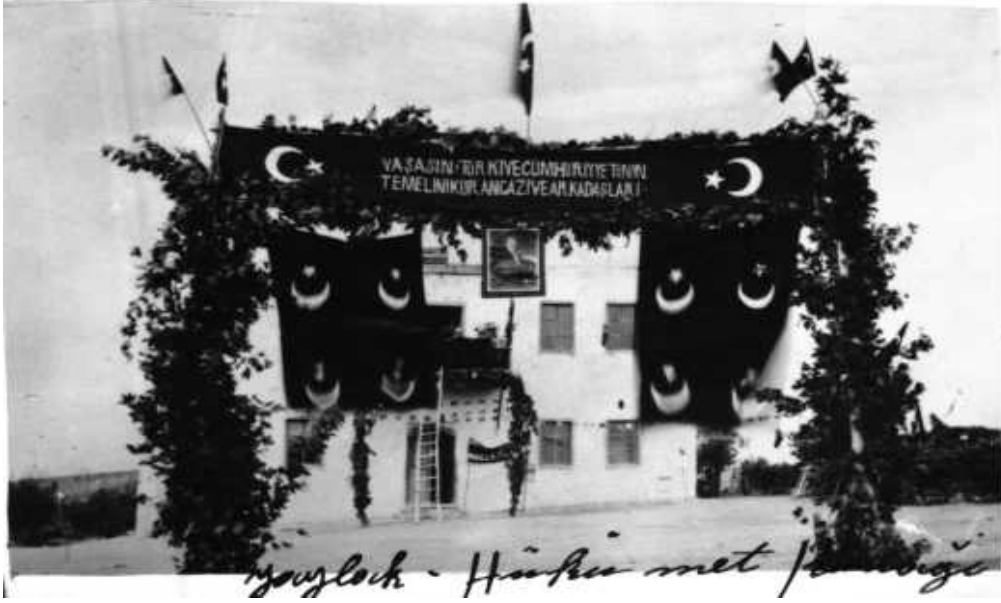
Cumhuriyet Bayramı Dolayısıyla Bayraklarla Süslenen Yaylak Hükümet Konağı