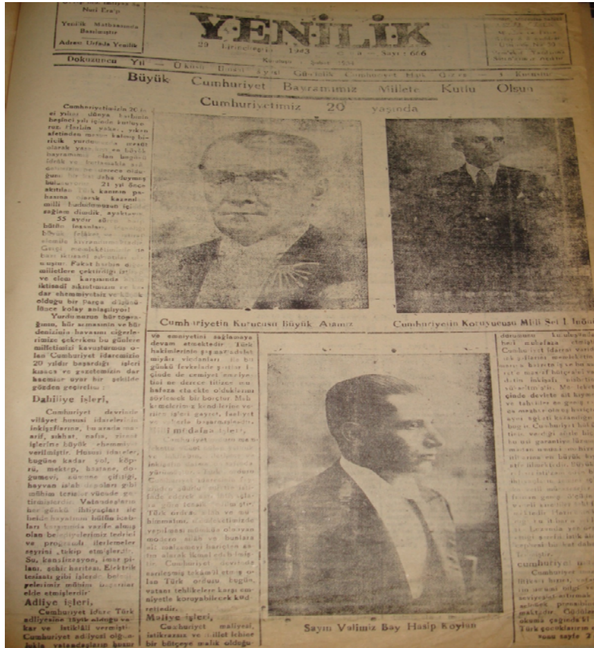
Yenilik, S.666, 29 Birinci Teşrin 1943

Cumhuriyet'in yirminci yıldönümü kutlamaları da, kutlama talimatlarına uygun olarak yapılmış ve programın bir sureti yine CHP Genel Sekreterliği'ne gönderilmiştir. Ayrıca gönderilen raporlar arasında, tören alanının bir krokisi de yer almaktadır (BCA, 490.01.1149.31.1.13).