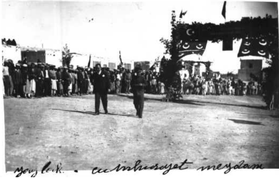
Cumhuriyet Bayramı Kutlamalarının Yapıldığı Yaylak Cumhuriyet Meydanı

Urfa'da, Cumhuriyet'in on birinci yıl dönümü kutlamaları amacıyla, Valilik ve Urfa Halkevi tarafından, CHP Genel Merkezinden gelen talimatlar çerçevesinde, bir kutlama programı hazırlanmış ve bütün resmi kurumlara iletilmiştir. Üç gün kutlanacak olan bayram, 28 Ekim öğleden sonra başlamıştır. 29 Ekim 1934 sabahı Urfa halkı, bayram kutlamalarına katılmak için Cumhuriyet Meydanı'nı doldurmuşlardır. Askeri kıtalar, öğrenciler ve halk, Kutlama Komitesi tarafından önceden hazırlanan krokiye göre, yerlerini almışlardır ( Urfa'da Milli Gazete , S. 236, 29 Birinci Teşrin 1934). Saat 09:00'da, Vilayette resmî kabul yapılmış ve 09:40'da Vali ve Resmî Heyetin, tören alanına gelmesiyle merasime başlanılmıştır. Törende çalınan İstiklal Marşı ve Onuncu Yıl Marşı'nın ardından, günün anlam ve önemine dair konuşmalar yapılmıştır. Son olarak yapılan resmî geçitle birlikte, sabahki kutlamalar sonlandırılmıştır. Gece ise, fener alayları yapılmış ve devlet erkânı ve halk, Urfa Halkevi tarafından düzenlenen resmi baloda bir araya gelmişlerdir ( Urfa'da Milli Gazete , S. 237, 5 İkinci Teşrin 1934).