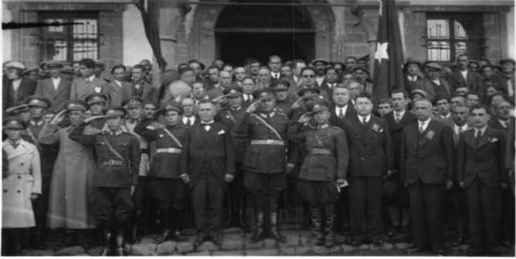
Urfa'da Cumhuriyet Bayramı Kutlamaları

Bayram münasebetiyle yapılan kutlama programı, konuşmalar, tören fotoğrafları ve gazetelerde yer alan Cumhuriyet Bayramı'yla ilgili yazıların bir örneği, Vali Kazım Demirer tarafından, CHP Genel Sekreterliği'ne rapor edilmiştir (BCA, 490.01.1149.31.1.50).