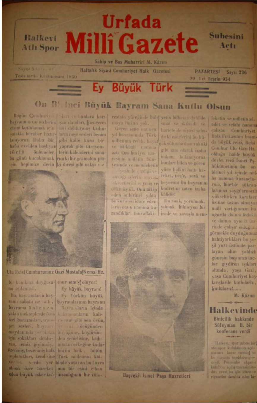
Urfa'da Milli Gazete, S. 236, 29 Birinci Teşrin 1934