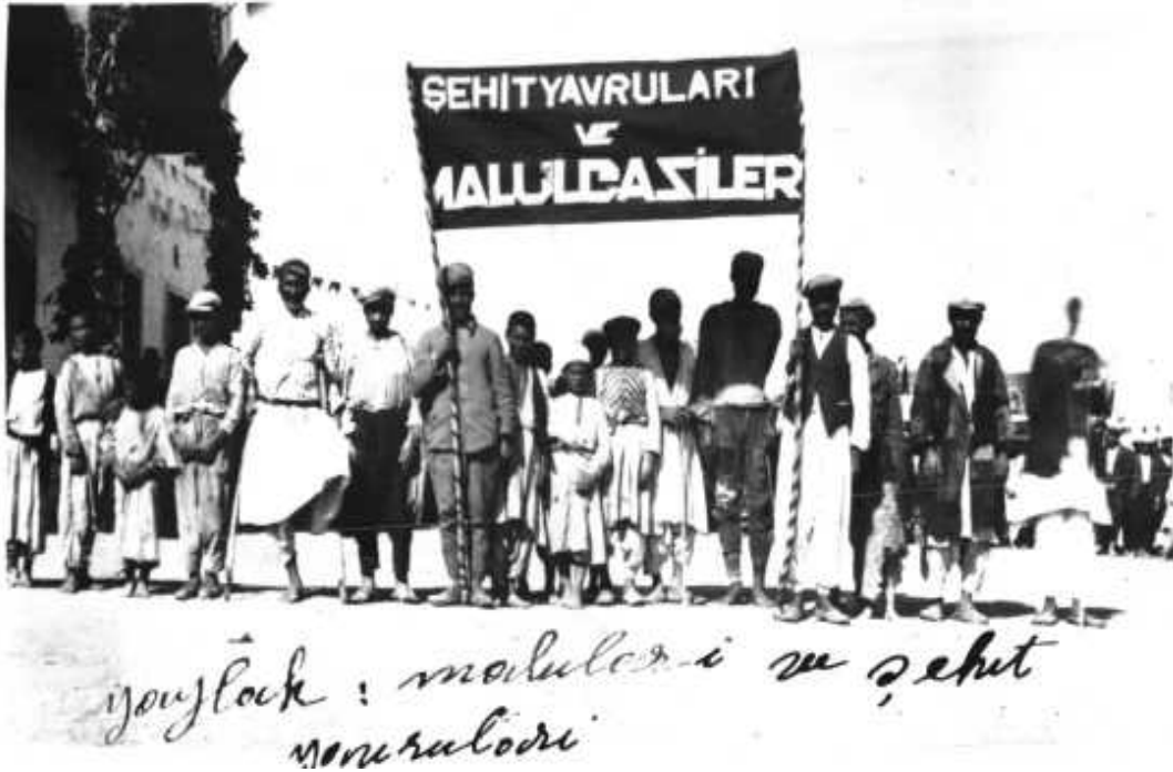
1947 Yılı Cumhuriyet Bayramı Kutlamalarında Yaylak'ta bayrama katılan malul gaziler ve şehit çocukları

Yerel gazetelerde de, bayram hazırlıkları ve kutlamalar hakkında bilgiler verilmiştir. Ayrıca Urfa Valisi Feyyaz Bosut'un Cumhuriyet Bayramı münasebetiyle, Cumhurbaşkanı, Meclis Başkanı, CHP Genel Sekreteri ve Birinci Umum Müfettişliği'ne çektiği telgraflara gelen cevaplar da gazete sütunlarında yer almıştır ( Urfa , S. 289, 7 Son Teşrin 1944).