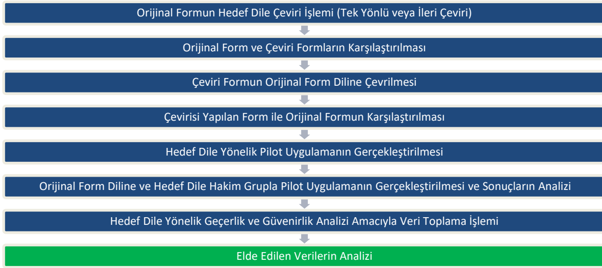
Şekil 1. Ölçme Aracı Uyarlama Sürecine Yönelik İşlemler

Bu çalışmada Sousa ve Rojjanasirat (2011) tarafından önerilen adımlar dikkate alınarak gerçekleştirilen işlem basamakları Şekil 1'de özetlenmiştir.