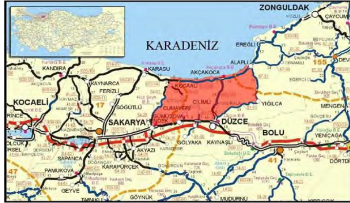
Şekil 2. Araştırma bölgesi (Ak, 2010)