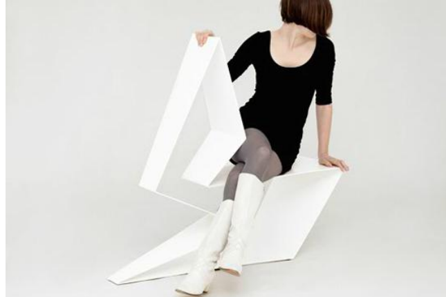
Görüntü 4. Eric Griffioen tarafından tasarlanan "Kaluza" isimli sandalye.

Hollandalı tasarımcı Eric Griffioen'in ürettiği farklı sandalye ve koltuk tasarımları bizlerin çok da alışık olmadığı yaratıcı uygulamalarıdır (Görüntü 4). Gündelik yaşamda kullanılabilen, yüzü geleceğe dönük bu tasarımlar, farkındalık yaratırken aynı zamanda hayatın içerisinde bir simgesel değer olarak var olmaktadır (Görüntü 5, Görüntü 6). Griffioen, tasarımlarını yaparken önceki tecrübelerinden yararlanarak sıkı bir çalışma içerisine girdiğini, her tasarımın bir sonraki yeni tasarımı getirdiğini söylerken, tasarımların bütünüyle içgüdüsel olarak oluştuğunu, bunları yaparken kendi kurallarını yıktığını ve tamamen hayal gücüyle birlikte tasarımlarının ortaya çıktığını belirtmektedir (Griffioen, 2012, http://www.erikgriffioen.nl/index.html ).