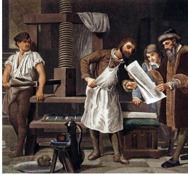
Görüntü 2. Johannes Gutenberg kendi baskı makinesinde basılmış bir sayfayı inceliyor.

Juhannes Gutenberg'in finansal ortağı Johann Fust ile birlikte Almanya'nın Manz şehrinde taşınabilir metal harflerle basım tekniğini bularak, baskı kalıplarının kullanılabilmesini sağlayan bir makine (Görüntü2) icat etmesi, matbaanın başlangıcı olmakla birlikte günümüz modern baskı makinelerinin de öncüsü olarak kabul edilir (Ress, 2006:62). Çin'de milattan sonra 170 yıllarında kullanılan tahta kalıpların bulunması, yaratıcı baskı fikrinin neredeyse insanlık tarihi kadar eski olduğunun bir göstergesidir. Ancak bilgi, birikim ve içten gelen yaratıcı düşünce sayesinde 1440 yılında Juhannes Gutenberg ve ortağı Johann Fust tarafından hayata geçirilen ilk matbaa makinesinin, insanlık tarihinde önemli bir dönemin başlamasına neden olduğu açık bir şekilde görülmektedir (Moran, 1978:17). Geçmişte edinilen bilgi ve tecrübeler, yaratıcılığı ateşlemekte, bir itici güç oluşturmaktadır. Bugün eğer insanoğlu yaratıcı olabiliyorsa bu geçmiş deneyimlerin katkıları ve içten gelen güdülerin birleşmesiyle mümkün olabilmektedir.