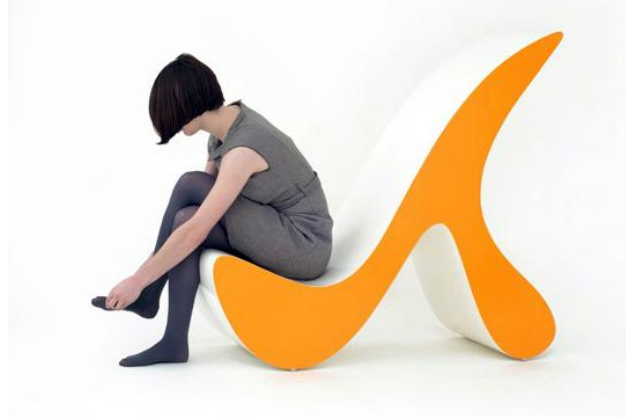
Görüntü 5. Eric Griffioen tarafından tasarlanan "Daveau" isimli sandalye.

(Image 5. "Daveau" chair design by Eric Griffioen)