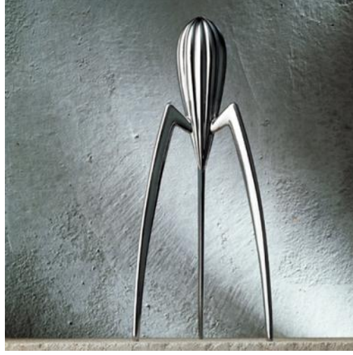
Görüntü 3. Philippe Starck tarafından tasarlanan narenciye sıkacağı.

(Image 3. Juicy Salif design by Philippe Starck)