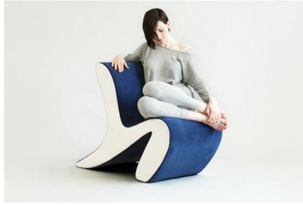
Görüntü 6. Eric Griffioen tarafından tasarlanan "Gio" isimli sandalye.

(Image 5. "Daveau" chair design by Eric Griffioen)