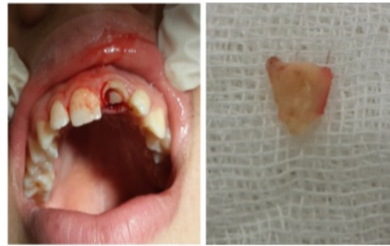
Resim 3: Dişin kırık palatinal parça çıkarıldıktan sonraki klinik görüntüsü ve kırık parça

Diğer kesici dişlerin vitalometrik muayenede pozitif cevap verdiği görüldü. Estetik sorunu gidermek için, travmatize dişin, hasta erişkin yaşa ulaşincaya kadar ağızda tutulmasına karar verildi. İlk olarak kırık palatal fragman çekildi (Resim 3) ve mukozal iyileşme sağlanması için kavite geçici dolgu materyali ile kapatıldı. Bir hafta sonrasına hasta kontrole çağrıldığında vestibül mukozanın ve dişeti marjininin iyileşmiş olduğu gözlemlendi (Resim 4). Aynı seansta kök kanal dolgusu uzaklaştırılarak post boşluğu hazırlandı ve fiber postlar yerleştirildi. Kron kısmı kompozit rezin ile restore edildi (Resim 5). İlgili dişin bir yıl sonraki klinik ve radyolojik incelemesinde herhangi bir patolojiye rastlanmadı (Resim 6).