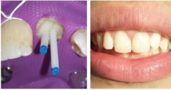
Resim 5: Fiber postların yerleştirilmesi ve kompozit rezin ile kron restorasyonu