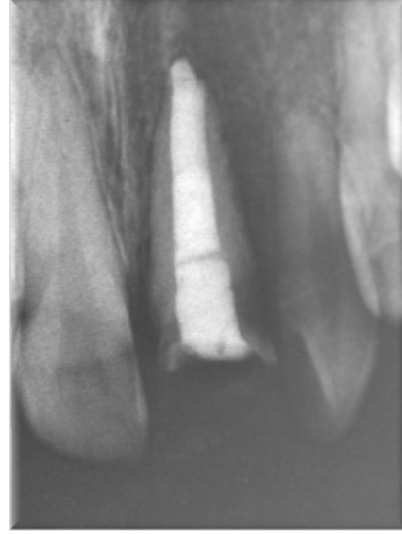
Resim 2: 21 no'lu dişin radyografik görüntüsü

Diğer kesici dişlerin vitalometrik muayenede pozitif cevap verdiği görüldü. Estetik sorunu gidermek için, travmatize dişin, hasta erişkin yaşa ulaşincaya kadar ağızda tutulmasına karar verildi. İlk olarak kırık palatal fragman çekildi (Resim 3) ve mukozal iyileşme sağlanması için kavite geçici dolgu materyali ile kapatıldı. Bir hafta sonrasına hasta kontrole çağrıldığında vestibül mukozanın ve dişeti marjininin iyileşmiş olduğu gözlemlendi (Resim 4). Aynı seansta kök kanal dolgusu uzaklaştırılarak post boşluğu hazırlandı ve fiber postlar yerleştirildi. Kron kısmı kompozit rezin ile restore edildi (Resim 5). İlgili dişin bir yıl sonraki klinik ve radyolojik incelemesinde herhangi bir patolojiye rastlanmadı (Resim 6).