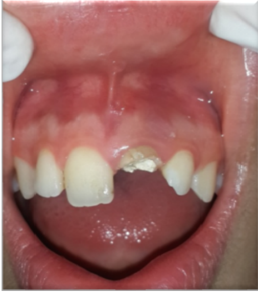
Resim 4: Bir hafta sonraki vestibül mukozanın ve dişeti marjininin iyileşmiş hali