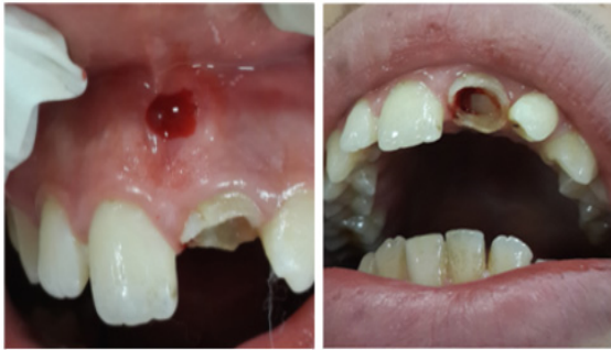
Resim 1: Preoperatif vestibül sulkus ve dişin klinik görüntüsü

16 yaşındaki erkek hasta futbol oynarken düşüp kırıdığı ön dişinin tedavisi için Ankara Üniversitesi, Diş Hekimliği Fakültesi, Endodonti Anabilim Dalı kliniğine başvurmuştur. Alınan anamnezde daha önceden 8 yaşında iken travma sonucu maksiller santral kesici dişinde kron kırığı olduğu, bu nedenle kanal tedavisi ve kompozit restorasyon yapıldığı, ancak düşüp yere çarpması sonucu aynı diş ikinci kere kırıdığı öğrenildi. Klinik incelemede; labial mukozada kanama, yırtık ve şişlik tespit edildi. Palatal marjinin altına uzanan kırık parçanın oynadığı görüldü (Resim 1). Radyolojik incelemede çok ince duvarları kalmış önceden kanal tedavisi yapılmış, geniş bir kök kanalı olduğu görüldü. İlgili dişin periapikal dokularının sağlıklı olduğu saptandı (Resim 2).