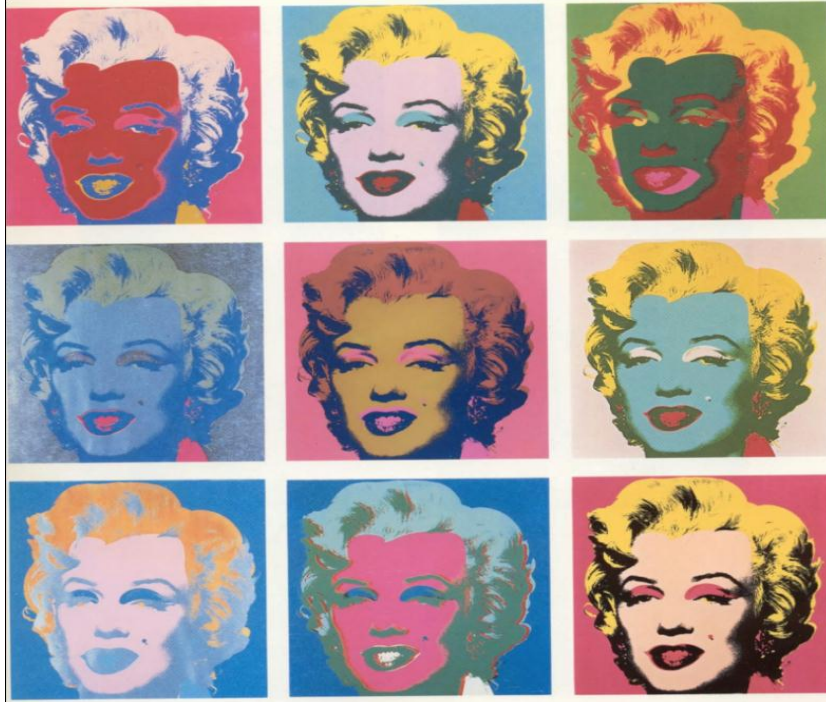
Şekil 10. Andy Warhol'un "Marilynler" adlı eseri (Figure 10. Andy Warhol's work called "Marilyns")

Yanı sıra çeşitli görüntüler arasında montaj ve kolaj çalışmalarında katman mantığıyla homojen yüzeyler elde etmede kullanılmaktadır. Gerçeklik duygusunu daha iyi vermek için illüstrasyon fotoğrafla iç içe geçmiştir. Birçok sanatçı için bu özellikler yaratılacak görüntünün üzerinde sonsuz olasılıklar kurgulayabilecekleri yeni ortamlar yaratmıştır.