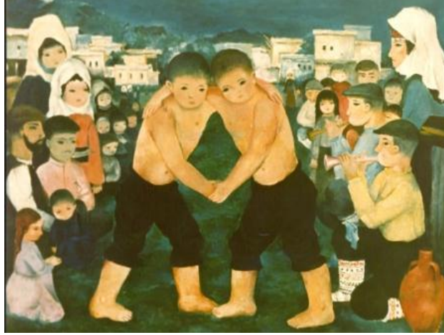
Şekil 11. Turgut Zaim'in minyatüre en yakın resimlerinden biri olan Tosuncuk Tablosu

Minyatür sanatı, geleneksel bir sanat türü olarak bugün büyük ölçüde geleneksel sanatları yaşatmaya çalışan dar bir sanatçı çevresinin himayesinde varlığını sürdürmektedir. Cumhuriyet'in ilk yıllarında minyatürden etkilenen ressamlardan Turgut Zaim'in eserleri minyatüre yakın naiflikleriyle öne çıkar.