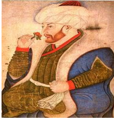
Şekil 3. Fatih Sultan Mehmet Nakkaş Sinan beyin eseri (Figure 3. Fatih Sultan Mehmet - Calligraphist Sinan's work)

13. yüzyılda Konya'da Abdülmü'min el-Hûyî'nin hazırladığı Varka ve Gülşen mesnevisinin minyatürleriyle, Harirî'nin Makâmât'ının minyatürleri bu dönemin en önemli eserleridir. Osmanlı devri minyatüründe, başlıca üç konu görülür. Bunlar, tarih, edebiyat ve din alanına giren eserlerden oluşur. En çok resimlenmiş olan yazmalar, birinci gruba girenlerdir. Bu eserlerin bir bölümü sultanların hayatına, bir kısmı fetih ve savaşlara, bir kısım Türk bilginleri ile bilgelerinin yaşamlarına aittir. Bunlara, bir devrin yaşayış biçimini gösteren şenlikleri de eklemek gerekir [10].