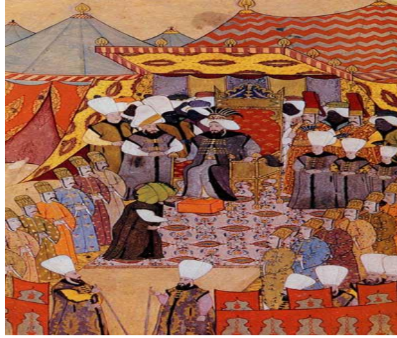
Şekil 6. Levni, III. Ahmet'e Hediye Sunumu (Figure 6. Levni's work, Presentation of gifts to Ahmet III)

XVIII. yy. Lale devrinde sultan III Ahmet'in 1720'de sünnet edilen üç Şehzadesiyle üç kızının ve öteki hanım sultanların evlenmeleri için düzenlenen eğlenceler, şenlikler ve geçit törenleri Sürname'de gösterilmiştir. XVIII. yüzyılın ünlü minyatür ustasını Levni (Abdülcélil Çelebi)'nin resimlediği bu Sürname iki boyutlu minyatür ile perspektifli ve ışık gölgeyi kullanan Avrupa resmi arasında bir geçiştir.