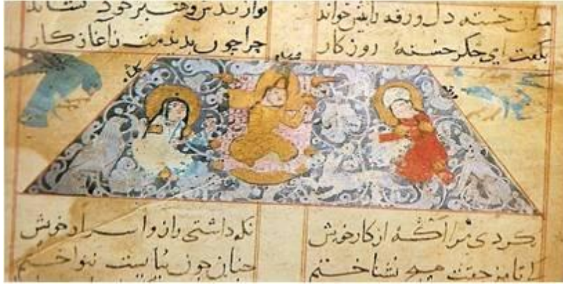
Şekil 2. Abdülmü'min el-Hûyî'nin Varka ve Gülşen minyatürü Albümünden (Figure 2. Abdilmumin el-Huyi miniature Varka and Golshah)

13. yüzyılda Konya'da Abdülmü'min el-Hûyî'nin hazırladığı Varka ve Gülşen mesnevisinin minyatürleriyle, Harirî'nin Makâmât'ının minyatürleri bu dönemin en önemli eserleridir. Osmanlı devri minyatüründe, başlıca üç konu görülür. Bunlar, tarih, edebiyat ve din alanına giren eserlerden oluşur. En çok resimlenmiş olan yazmalar, birinci gruba girenlerdir. Bu eserlerin bir bölümü sultanların hayatına, bir kısmı fetih ve savaşlara, bir kısım Türk bilginleri ile bilgelerinin yaşamlarına aittir. Bunlara, bir devrin yaşayış biçimini gösteren şenlikleri de eklemek gerekir [10].