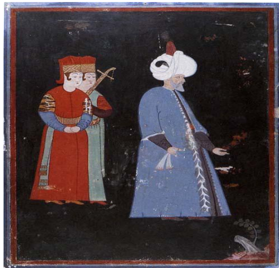
Şekil 5. Hünernâme, Nakkaş Osman eseri (Figure 5. Hunername, Calligraphist Osman's work)

Türk minyatür sanatının en verimli ve üretken dönemi olarak kabul edilen II. Selim ve III. Murat arasındaki dönemde minyatürde adeta bir patlama yaşanmıştır. Bu dönemde Niğâr'î insan tasvirleri yapmıştır. Yavuz Sultan Selim Barbaros, Hayreddin Paşa, I. François ve V. Şarl'ın resimlerini yapmıştır. Onun minyatürlerinde portre önem kazanır, kıyafetler en ince ayrıntısına kadar gösterilir. III. Murat döneminde Nakkaş Osman III. Murat Sürname'sinde şehzade Mehmet'in Sünnet düğünü nedeniyle yapılan geçit törenleri eğlenceler anlatılır. Elli iki gün süren düğünde doğudan batıdan Hükümdarlar, elçiler çağrılmış, iki yüzden fazla esnaf Sultanahmet meydanında mesleklerini ve ürünlerini göstererek geçmişlerdir. Hünernâme'de ise Kanuni Sultan Süleyman ve diğer Osmanlı Padişahlarının Savaşlarını, avlanmalarını anlatan, hayattan alınmış sahneleri göstermektedir.