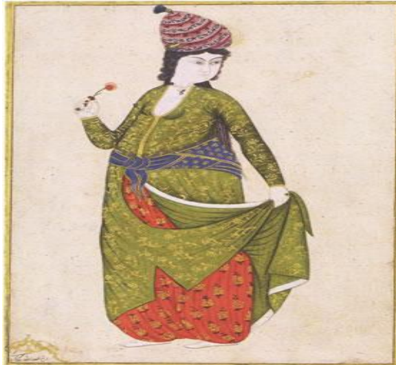
Şekil 7. Abdullah Buhari'nin bir minyatürü (Figure 7. Abdullah Buhari's miniature)

Levni ayrıca kadın figürleri de yapmıştır. Rakkaseler, Sazendeler onun minyatürlerinde kırmızı, sarı, açık mor, mavi ve çok az yaldızla gösterilmiştir.