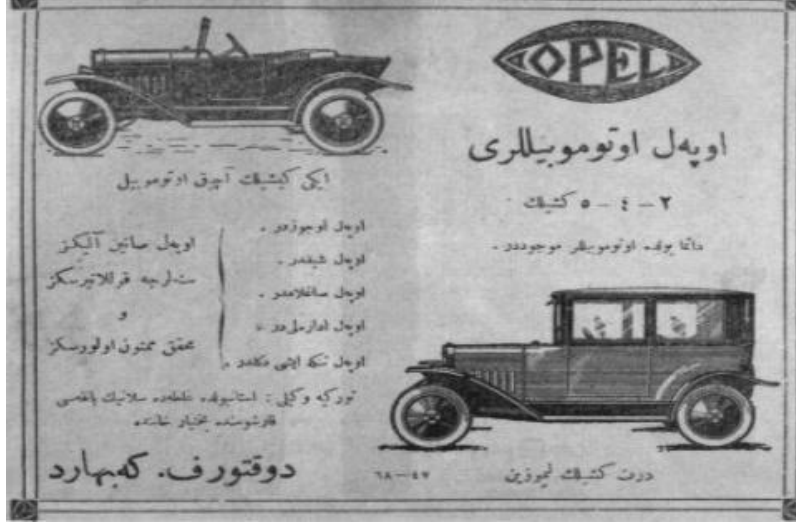
Şekil 8. II. Meşrutiyet'in ilanından sonra basılmış, illüstrasyonla desteklenmiş bir otomobil reklamı

(Figure 8. Illustration was used for designing an automobile advertisement which was printed following the proclamation of the Second Constitution)