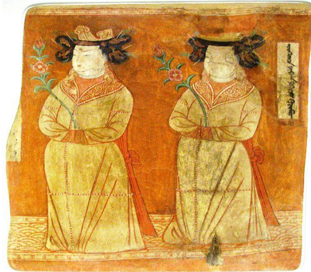
Şekil 1. Uygur Prensesleri, Bezeklik Mağarası, 9, 9-12. Yüzyıl CE, duvar sanatı, 66 x 57 cm. Bulunduğu yer: Museum für Indische Kunst, Berlin-Dahlem Müzesi.

özellikle elyazması İncilleri süslemeye başladı. Batı'da minyatürün gelişmesi ise 8.Yüzyılın sonlarına denk düşer. Baskı makinesinin bulunuşuna kadar Avrupa'da çok güzel ve görkemli minyatürler yapıldı. Bu dönemden sonra ise minyatür daha çok madalyonların üzerine portre yapmak için kullanıldı. 17. yüzyıldan itibaren fildişi üzerine yapılan minyatürler çoğaldı. Sonraları gelişen başka modern resim teknikleriyle birlikte minyatür sanatına karşı olan ilgi azaldı ancak bazı sanatçı çevrelerinde geleneksel bir sanat olarak varlığını sürdürdü.